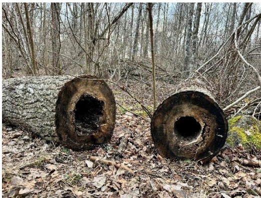
Figur 11. Död ved har lämnats på platsen med syftet att gynna biologisk mångfald.