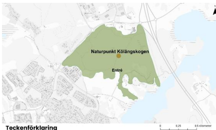
Figur 18. Visar Naturpunkt Kølängskogens avstånd till bebyggelse. Karta: Elin Eriksson (2026).

Vad gäller barns möjlighet till egna platser är möjligheterna goda i båda lekmiljöerna att hitta och skapa sina egna platser, kojor eller andra konstruktioner genom att nyttja vegetation, topografi och löst material.