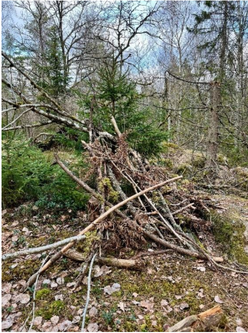
Figur 5. Vid naturpunkt Kølängsskogen finns spår av ett vindskydd eller koja som byggts av löst material.