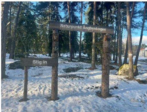
Figur 9. Naturpunkt Ängbyskogen nås genom en tydligt skyltad entré.