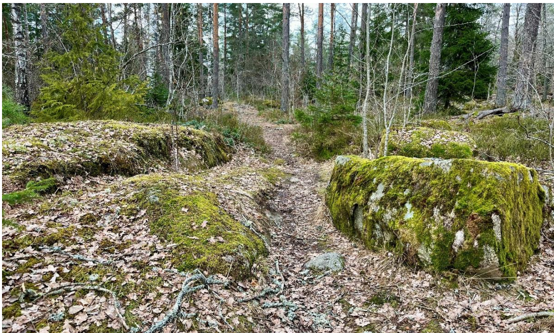
Figur 4. Vid naturpunkten i Kölängskogen utgörs de topografiska skillnaderna av stora stenblock och bergsknallar. Fotot är taget längs stigen mellan entrén och lekmiljöns mötesplats.

I de båda lekmiljöerna bidrar vegetationen med en krontäckning som täcker mer än hälften av himlen. I båda lekmiljöerna finns till gång till löst material som varierar beroende på säsong och som framför allt utgörs av kottar, kvistar, pinnar, stockar, barr, löv och bär (se Figur 5 och Figur 6).