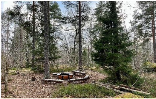
Figur 7. Vid naturpunkt Kølängskogen utgörs mötesplatsen av grillplats och bänkar. Till höger i bild skymtas också löst material som har lämnats på platsen.