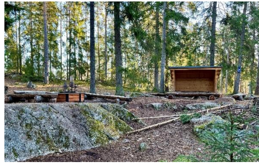
Figur 8. Vid naturpunkt Ängbyskogen utgörs mötesplatsen av en grillplats, vindskydd samt flera olika sittplatser. Fotot illustrerar de topografiska skillnader som uppstår av stenblock och bergsknallar. Till höger i bild har löst material lämnats på platsen.