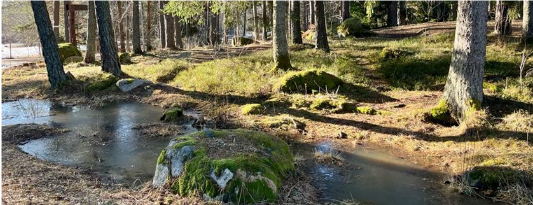
Figur 10. Visar exempel på tillfällig tillgång till vatten. Till vänster skymtar entrén till naturpunkt Ängbyskogen som visats i Figur 9.

I båda lekmiljöerna utgör grillplatserna det enda byggda element där vissa delar av konstruktionen består av andra material än naturliga material . I övrigt utgörs lekmiljöerna av natur.