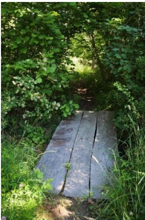
Figur 13. Entré till naturpunkt Kølängskogen i september där omgivande vegetation skapar en portal in i skogen. Foto: Knivsta kommun (2025).

Båda lekmiljöerna innehåller en variation som skapar lekmöjligheter och utmaningar för olika åldrar och förmågor. Lekmiljöerna ger utrymme för den fria leken och eget utforskande av det som finns i naturen. Tillgången till löst material ger möjlighet till bland annat fantasilek, skapande och konstruerande. Naturmiljön möjliggör också aktiviteter som svamp- och bärplockning, att studera naturens ekosystem eller att ta in omgivningen för vila och återhämtning. I Ängbyskogen finns också två utmarkerade naturstigar som leder vidare in i naturreservatet och tillbaka till naturpunkten. Vid naturpunkt Ängbyskogen finns plats-specifika och unika strukturer som särskilt urskiljer denna lekmiljö från andra lekmiljöer. Här finns djurskulpturer i trä samt troner som har skulpterats ur stubbar som finns kvar på platsen efter träd som har fällts (se Figur 16 och Figur 17).