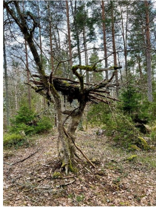
Figur 6. Vid naturpunkt Kølängsskogen finns också spår av andra konstruktioner som byggts av löst material. Foto: Elin Eriksson (2026).