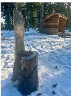
Figur 16. Visar tronen som skulpterats ur befintliga stubbar. Här finns spår från besökare som har samlat ihop kottar. I bakgrunden skymtas vindskyddet vid naturpunkt Ängbyskogen. Foto: Elin Eriksson (2026).