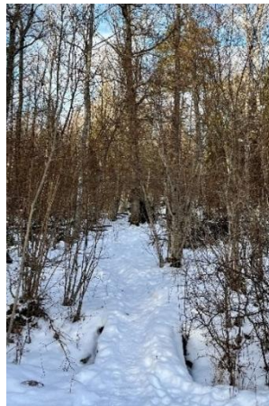
Figur 14. Entrén till naturpunkt Kølängskogen i februari.