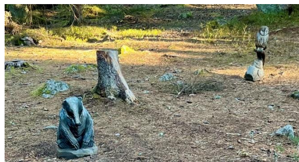
Figur 17. Djurskulpturer vid naturpunkt Ängbyskogens mötesplats.