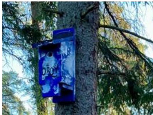
Figur 12. Fågelholk som finns uppsatt i ett träd intill mötesplatsen vid naturpunkt Ängbyskogen.