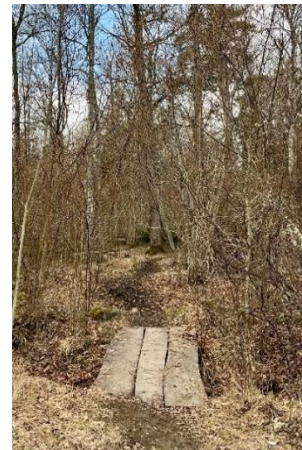
Figur 15. Entrén till naturpunkt Kølängskogen i mars.