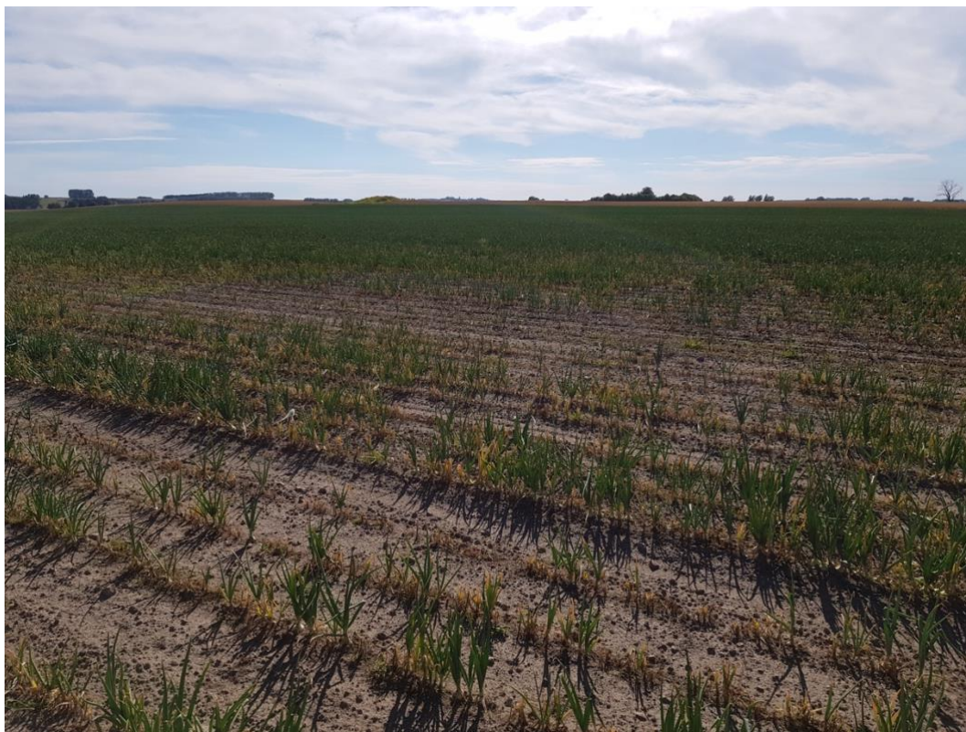
Figur 1: Kraftiga angrepp av Fusarium oxysporum i lökodling belägen i sydöstra Skåne

olika formae specialis av F. oxysporum har observerats (Leslie & Summerell, 2006).