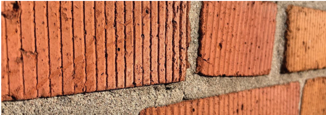
Figur 6. Tegel. Moa Price (2026).

Studien Zhang et. al (2019) visar att bränt tegel kan förbättra strukturen hos urbana jordar. Teglet ökar den hydrauliska konduktiviteten när det tillförs i naturliga jordsubstrat. Detta beror på att det bidrar till en högre porositet genom att ändra jordens struktur. Vidare visar studien att bränt tegel har sämst fosforrening bland bränt-, obränt tegel och betongkross på grund av att dess partikelyta har en slätare struktur. I detta fall var fosforreningen hos det obrända teglet avsevärt bättre (Zhang et. al 2019).