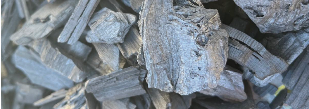
Figur 5. Biokol. Moa Price (2026).

Biokol framställs genom pyrolys, en syrebegränsad till syrefri uppvärmning som förkolnar organiskt material. Pyrolysen kan genomföras med olika temperatur och på så vis ge olika egenskaper hos det förkolnade materialet.