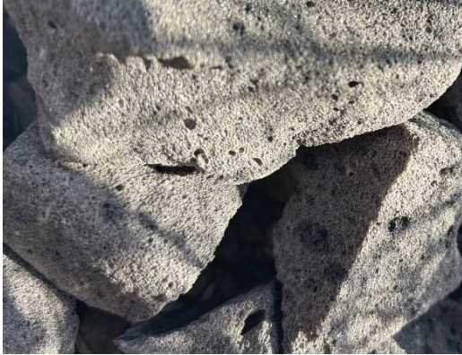
Figur 9. Skumglas. Moa Price (2026).