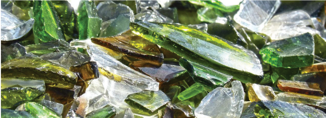
Figur 8. Krossat glas.

I en studie av Gill et. al (2009) framgår att glaspartiklar kan ge samma hydrauliska egenskaper som sand. Studien visar även att dess rening är jämförbar med den rening som kan ses hos sand. Detta med undantag för fosforreningen som är mer effektiv hos sand. Vidare framgår att glas har god permeabilitet, vilket i sin tur gör att tillförsel av glas i naturliga jordar ökar resistensen mot kompaktering (Gill et. al 2009). Reningen av kväveoxid och nitrat förbättras av att glas innehåller kiseloxid vilket skapar en något sur yta på partiklarna (Alam et. al 2021).