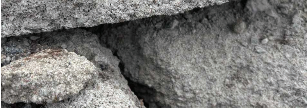
Figur 7. Krossad betong. Moa Price (2026).

Den krossade betongen renar fosfor genom adsorption på partikelytan (Alam et. al 2021; Tanmoy et. al 2022). Krossad betong har en grov partikelyta. Den grova partikelytan gör att de krossade betongpartiklarnas begränsade area är stor. Detta medför i sin tur att den krossade betongens reningsförmåga är god, liksom för obränt tegel när de jämförs med bränt tegel (Zhang et. al 2019). En studie av Deng och Wheatley (2018) visar att den mest effektiva fosforreningen med hjälp av krossad betong (2-5mm) sker vid pH 5 vilket då ger en reningseffekt på 90%. Reningsförmågan minskar dock med minskad partikelstorlek. Den grova partikelytan ger även en god infiltrationsförmåga (Zhang et. al 2019).