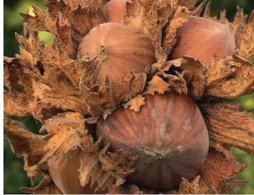
Figur 10. Hassel husk. Zoli Magyarorzág (2016) CC0.

Skumglas framställs genom att pulveriserat glas värms upp tillsammans med ett skumningsmedel. Uppvärmningen sker i en gasugn, när skummedlet förgasas fylls glasmassan av mikroporer (Matlock och Rowe 2016). Processen bildar ett poröst material med låg bulkdensitet.