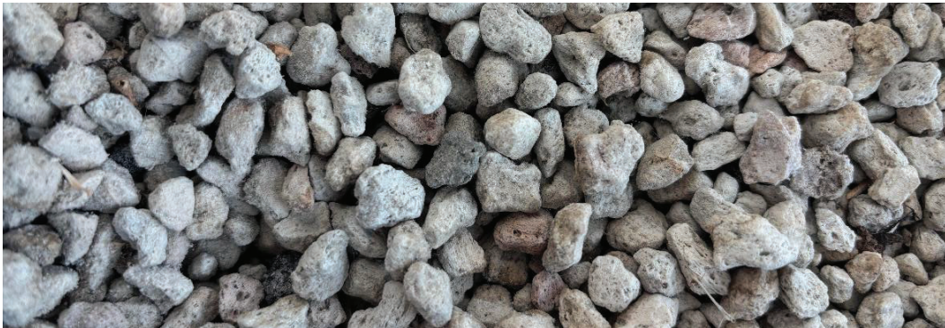
Figur 2. Pimpsten. Moa Price (2026).

Karaktäristiskt för pimpstenen är dess lätta vikt, därav används pimpstenen ofta i anläggningar med viktbegränsning, som exempelvis på gröna tak eller på bjälklag.