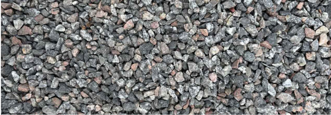
Figur 4. Makadam. Moa Price (2026).

Enligt Statens väg- och transportforskningsinstitut VTI, Hellman et.al (2025) har makadam en porvolym på 30–40%. Den maximala porvolymen nås när alla stenar är lika stora, det vill säga när kornstorleken är sorterad. Däremot påverkas porvolymen mindre av partiklarnas inbördes storlek. Med en minskad kornstorlek minskar dock materialets permeabilitet. Detta stärks av att Blombäck et. al (2023) menar att makadam i förhållande till naturliga jordar har mycket hög permeabilitet på grund av dess stora andel makroporer.