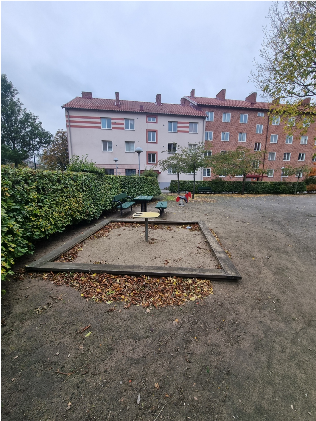
Figur 4. Den befintliga lekutrustningen på bostadsgården.