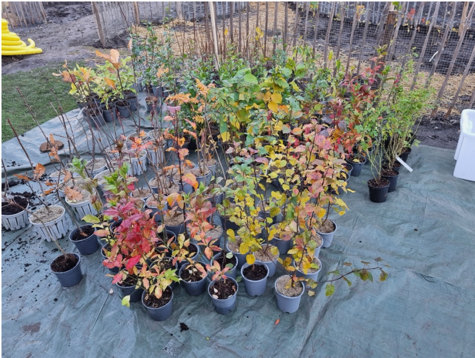
Figur 8. Växtmaterial från planteringsdagen.

varierade inhemska träd- och buskarter samt genom att utnyttja skillnader i markfukt och mikroförhållanden eftersträvades en miljö som kan erbjuda skydd, födosöksmiljöer och spridningsmöjligheter för olika arter. Kombinationen av mikroskog och angränsande ängsytor syftade till att skapa ekologisk variation och en mer komplex grönstruktur inom gårdsmiljön. Växtlistan för lignoser återfinns under kapitlet för bilagor.