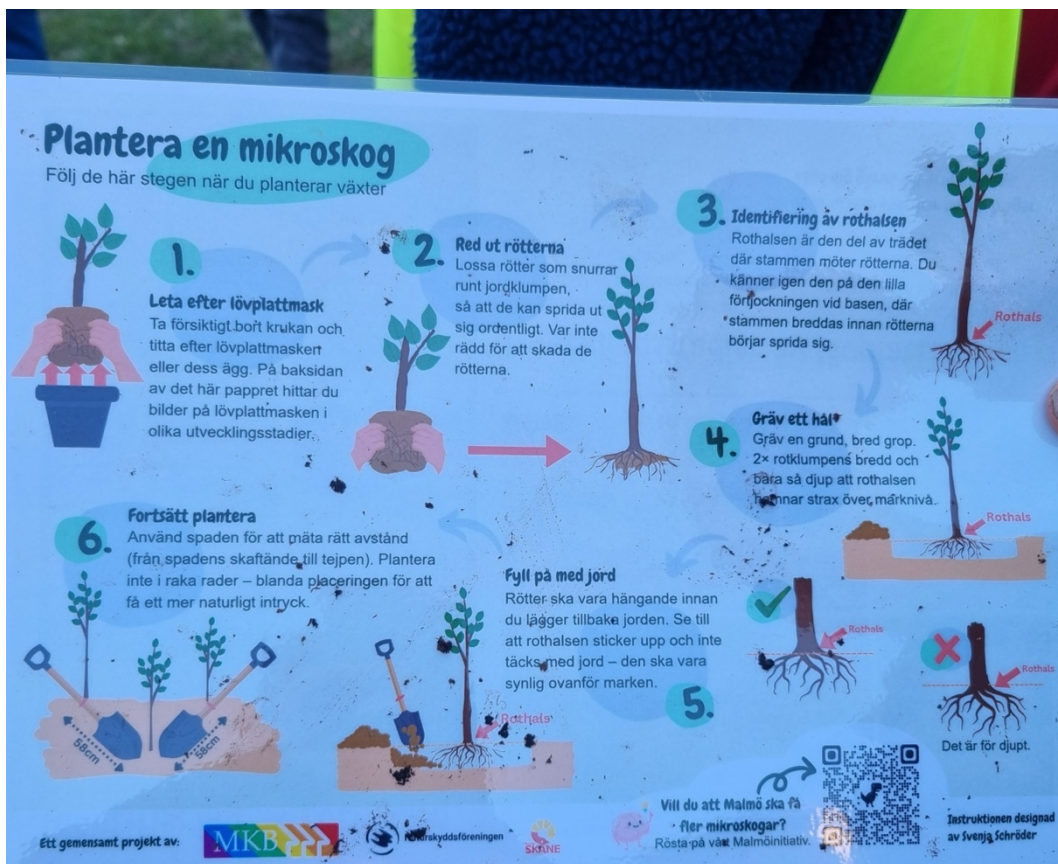
Figur 10. Planteringsbeskrivning framtagen av Svenja Schröder (2025) för planteringsdagen.

Användningen av platsen i detta skede präglas således av begränsad tillgänglighet, där fokus ligger på etablering snarare än vistelse. De planerade ängsytorna, som utgör en del av den övergripande gestaltningen, är ännu inte anlagda utan avses genomföras i en senare etapp. Detta innebär att platsens fulla funktion och användning ännu inte är realiserad vid tidpunkten för studien.