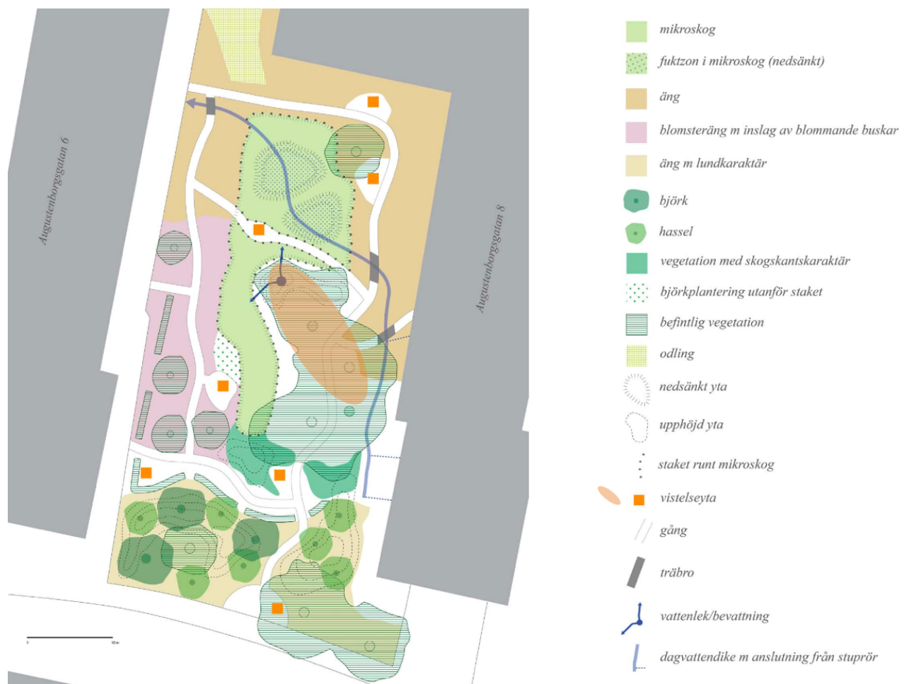
Figur 7. Gestaltning av mikroskogen i Augustenborg av Emma Nygren, 2025. Principskiss med skalstock (0–10 m) angiven i bilden.