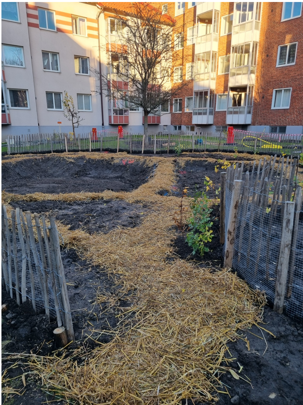
Figur 9. En del av ytan avsedd för plantering.