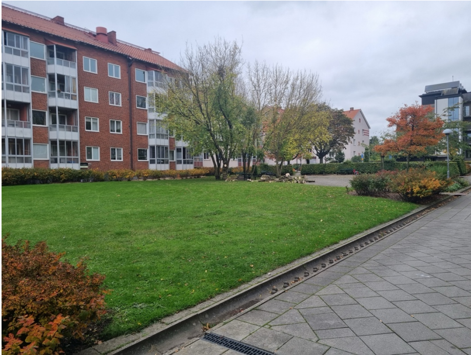
Figur 2. Gårdsrummet innan etableringen av mikroskogen.

nyttjades av boende, vilket bidrog till att platsen redan före etableringen hade inslag av gemensamt bruk och lokalt engagemang. Den yta som senare togs i anspråk för mikroskogen saknade dock en fast programmerad funktion och användes flexibelt i vardagen.