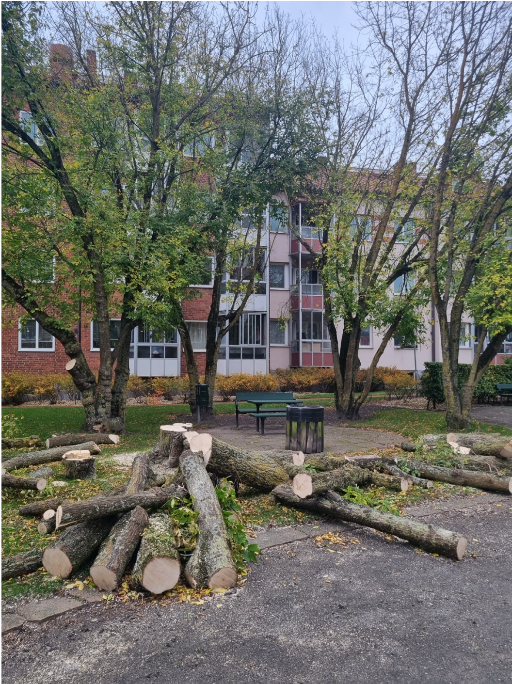
Figur 5. Förberedelser inför etableringen av mikroskogen och planteringsdagen.