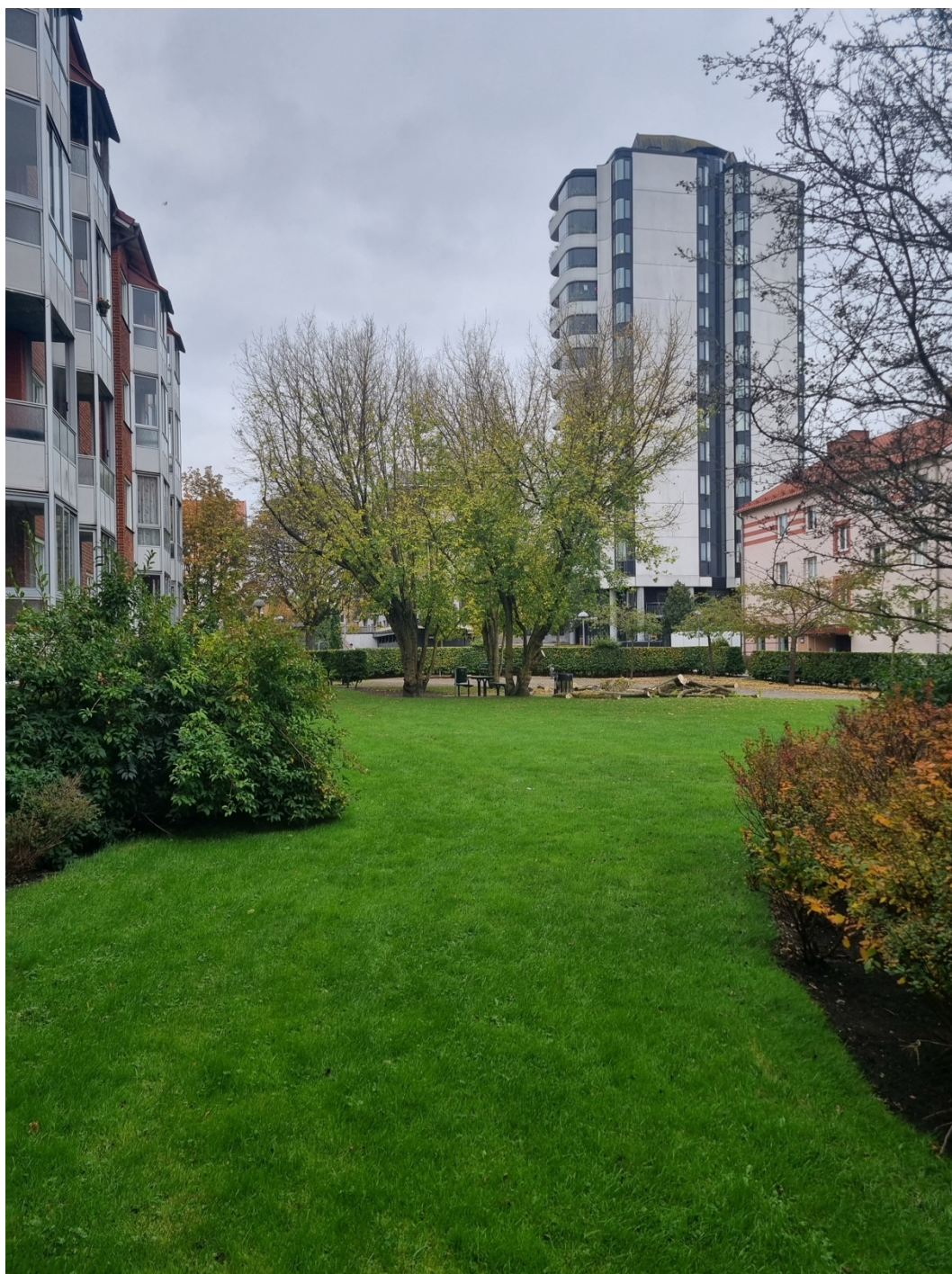
Figur 6. Rumsligheten.

hur intervjupersonerna resonerar kring mikroskogens gestaltning, användning och långsiktiga funktion i bostadsgårdsmiljön.