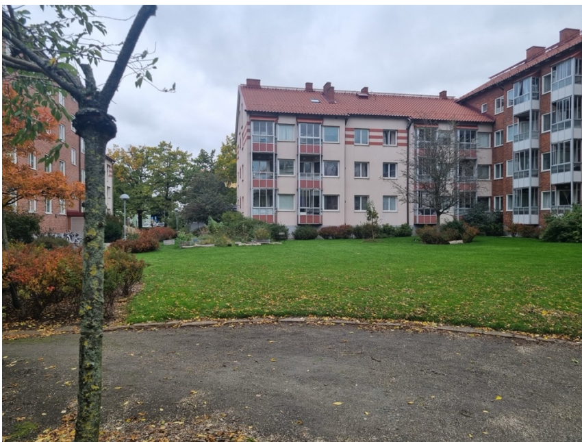
Figur 3. En annan vy av gårdsrummet innan etableringen av mikroskogen.