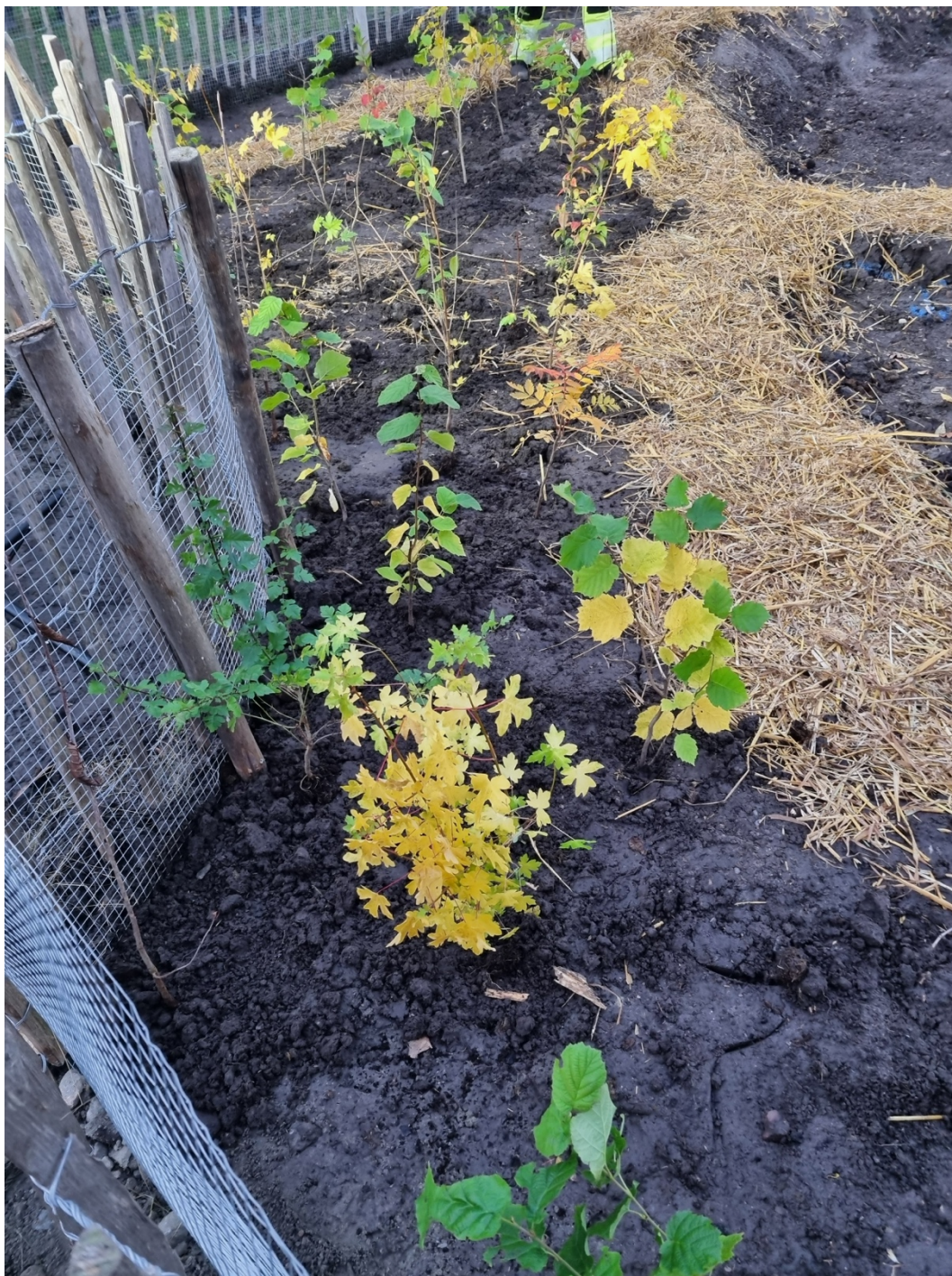
Figur 11. Nyplanterad mikroskog.