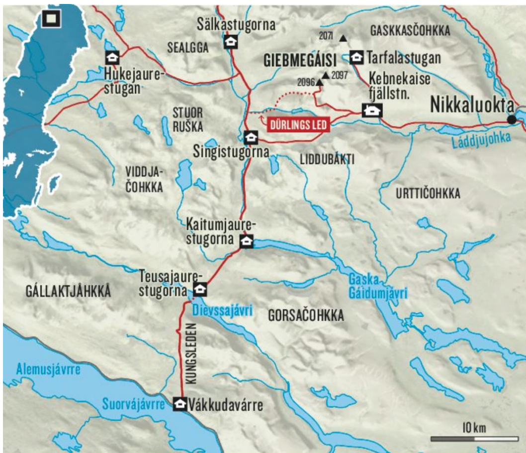
Figur 2. Karta över den nordligaste delen av den svenska fjällkedjan, hämtad ur artikeln "Norra Kungsleden nerifrån: Vakkotavare–Nikkaluokta" (Turist nr 3, 2023:26). [Kartografiskt material] [2024-11-02]

att visa Durlings led upp till Kebnekaise. Utöver Durlings led, är även de leder som går mellan fjällstugor markerade. Förvaltningen av dessa stugor sker genom STF. Även sjöar, älvar, terräng och bergstoppar som präglar landskapet är tydligt markerade. Dessa "naturliga" element framhävs särskilt medan kulturella och sociala komponenter utelämnas. Utelämnandet av landskapets kulturella och sociala dimensioner i kartan, med undantag för element kopplade till STF, bidrar till att ytterligare förstärka framställningen av fjällskapet som en naturlig entitet. Att de enda kulturella komponenterna som tillåts i kartorna är de som är kopplade till STF, medan andra kulturella dimensioner såsom samiska element osynliggörs, visar på en maktstruktur där STF:s perspektiv erkänns och samiska osynliggörs. Ett exempel på centrala kulturella samiska aspekter som utelämnas från kartan är samebygränsen mellan Girjas och Laevas, som sträcker sig strax ovanför Kebnekaises fjällstation (Sametinget 2024a). Vidare framgår inte heller rengärden, kåtor eller samevisten som är belägna inom området (Sametinget 2024b).