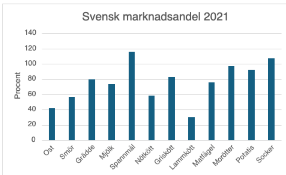
Figur 1. Så mycket av den totala konsumtionen produceras i Sverige. Källa: egen bearbetning av Jordbruksaktuellt (2022).

Idag har Sverige en genomsnittlig självförsörjningsgrad på 50 procent (LRF u.å.a.). En hög försörjningsgrad gör landet mer solitt för att kunna hantera olika typer av kriser eller handelshinder som exempelvis importförbud. Global handel är dock inget negativt och motsätter inte en ökad grad av självförsörjning (LRF u.å.a.). EU utnyttjar sin handelspolitik för att främja mänskliga rättigheter, sociala standarder och säkerhetsstandarder, respekten för miljön samt hållbar utveckling (Europaparlamentet 2019).