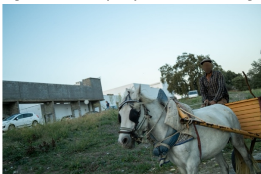
Figur 37. En romsk man använder sin häst som transportmedel.