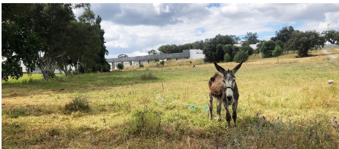
Figur 36. En romsk familjs åsna betar i det höga gräset.