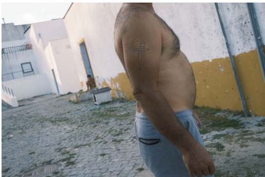
Figur 33. Män utan tröja är vanligt varma dagar i området.