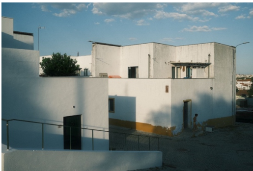
Figur 4. Ett av husen i Malagueira.