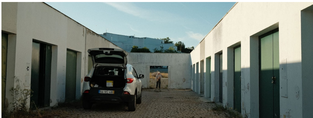
Figur 28. Garagen i Malagueira ligger i separata byggnader från bostadshusen.