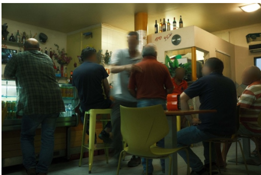
Figur 24. Gäster på en av barerna.