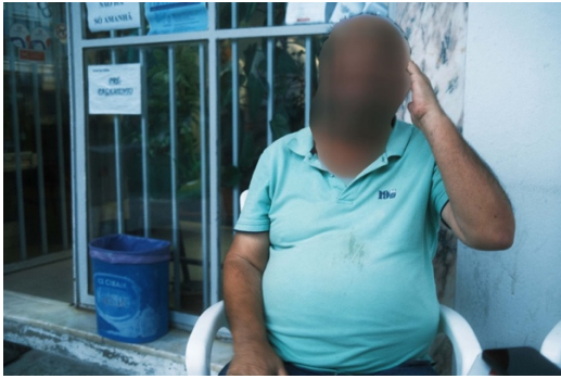
Figur 32. Man i fläckig pikétröja.