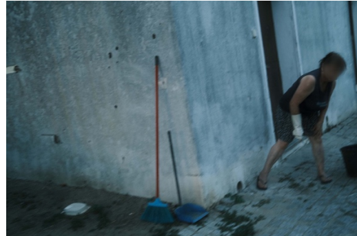
Figur 19. Kvinna som städar utanför sin dörr på kvällen.