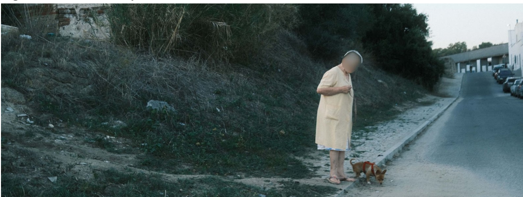
Figur 16. Kvinna på kvällspromenad med sin hund.