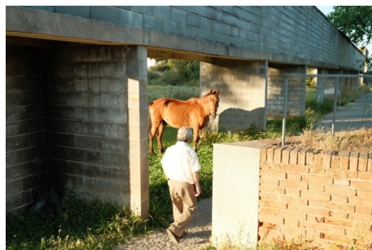
Figur 38. Ibland kan man se en av romernas hästar stå och beta i det höga gräset i utkanterna av Malagueira.