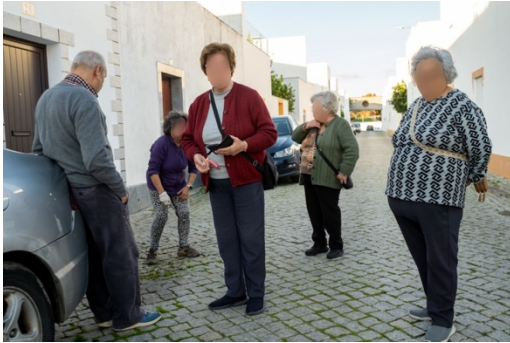
Figur 17. Kvinna som plockar ogräs och pratar med förbipasserande.

djuren på gatan. Ofta utför de någon hushållssyssla hemma och tar pauser för att socialisera på gatan utanför med andra kvinnliga grannar eller förbipasserande. Ibland hjälps de åt. Vid några tillfällen har jag sett kvinnor befinna sig på någon av de lokala barerna, men oftast har det varit i sällskap av en man. Vid endast ett tillfälle såg jag en kvinna på en av barerna som jag anade var där utan sällskap, men det är snarare undantaget som bekräftar regeln – baren är männens sociala arena.