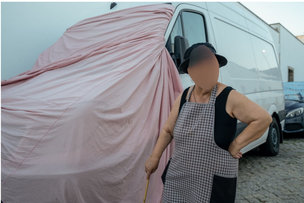
Figur 22. Kvinna iklädd ett förkläde ute på gatan i Malagueira.