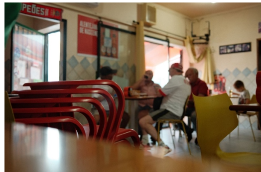
Figur 26. Gäster på en av barerna.