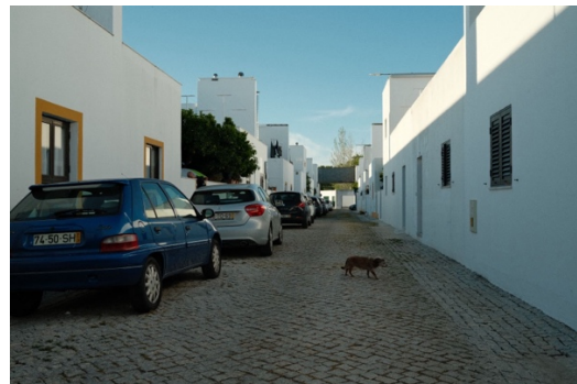
Figur 6. En av gatorna i Malagueira.