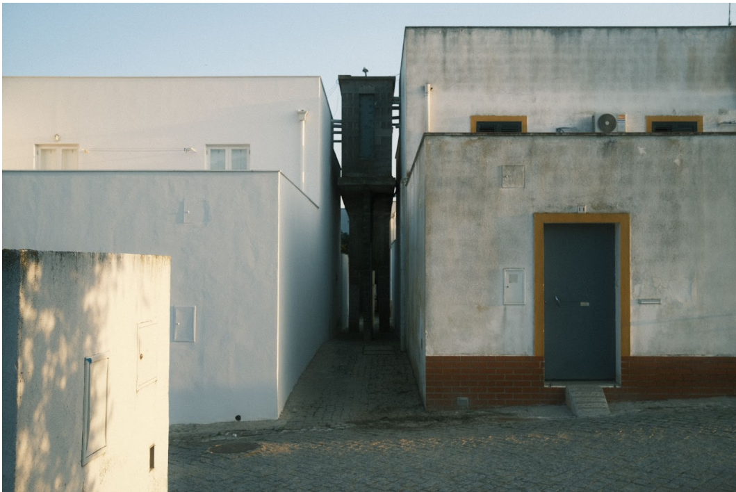
Figur 12. Akvedukten leds på vissa platser i området mellan husen. I dessa gränder är det endast möjligt att passera till fots.

Den grå akvedukten går igenom hela Malagueira och leder el, gas och vatten till alla husen. Det var ett billigt sätt för Siza att slippa gräva ner alla ledningar i marken samt ett sätt att koppla ihop Malagueiras landskap med Évoras, eftersom staden har en gammal akvedukt från 1500-talet som är ett av de mest uppenbara och imponerande monumenten.