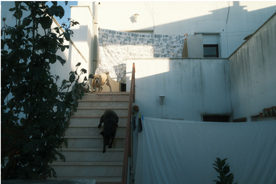
Figur 9. Bild från ett av husen med en lägre mur till innergården. Hundskall tar upp en stor del av ljudlandskapet av det annars ganska tysta Malagueira när man vandrar längs gatorna.