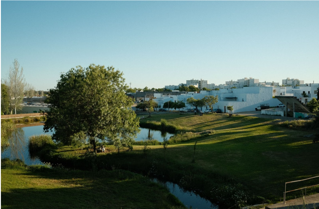
Figur 3. I förgrunden den konstgjorda sjön Ribeira da Torre följt av de sockerbitsliknande husen som är signifikanta för Malagueira. Längst bak syns de höga husen vid det intilliggande området Cruz da Picada.