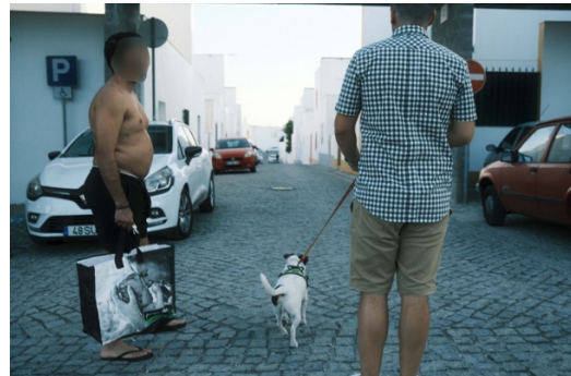
Figur 35. Man utan tröja i flipflopsandaler möter en annan man på hundpromena