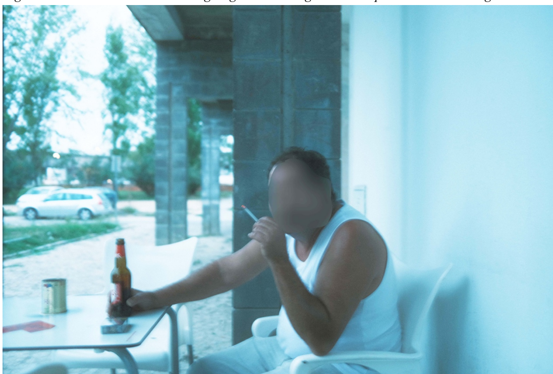
Figur 31. Mannen röker en cigarett och dricker öl på en av uteserveringarna.