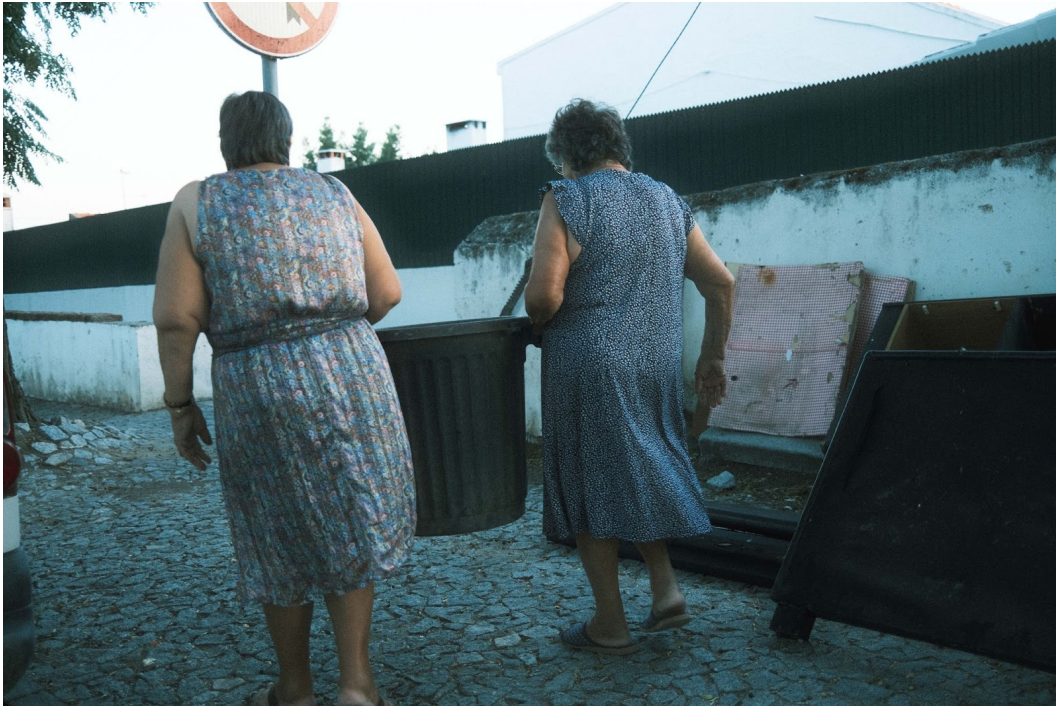
Figur 21. Två kvinnor hjälper varandra att bära iväg något i en stor hink.