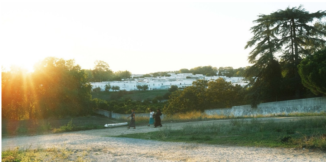
Figur 39. Tre romska kvinnor vandrar i utkanten av Malagueira. Längre bak i bilden syns de vita husen.