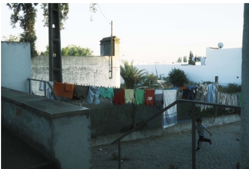
Figur 14. Tvättlinor utanför husen.

Eftersom det är just vardagslivet som jag har observerat i Malagueira, och färre extraordinära händelser, så har det varit enklare att upptäcka olika mönster i hur invånarna rör sig och interagerar med varandra, eftersom dagarna i fält har varit relativt liknande varandra.