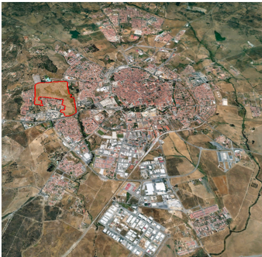
Figur 1. Malagueira markerat i rött i förhållande till Évora. (Karta: Google Earth Pro. Egen illustration.)

Projektet har vunnit flera priser för att det bland annat anses vara ett socialt och arkitektoniskt lyckat projekt (ibid.). Gomes (2016: 59) förklarar hur Siza har lyckats få in hela den sociala historien om platsen: "inte bara regionens folkspråk utan även den sociala dynamiken i sig som befolkningen levde och lever".