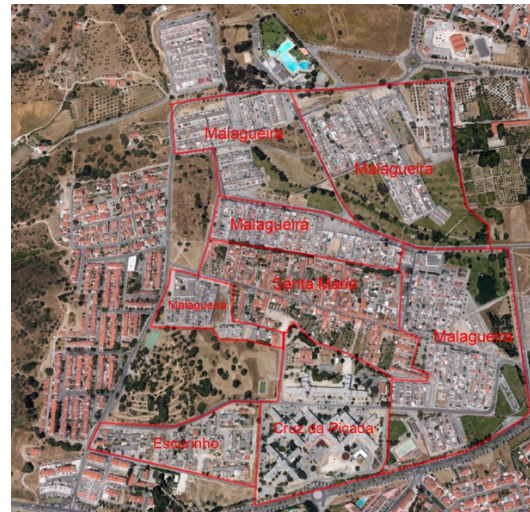
Figur 2. Malagueira markerat i förhållande till de intilliggande områdena. (Karta: Google Earth Pro. Egen illustration.)