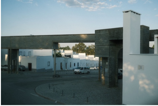
Figur 10. Akvedukten.