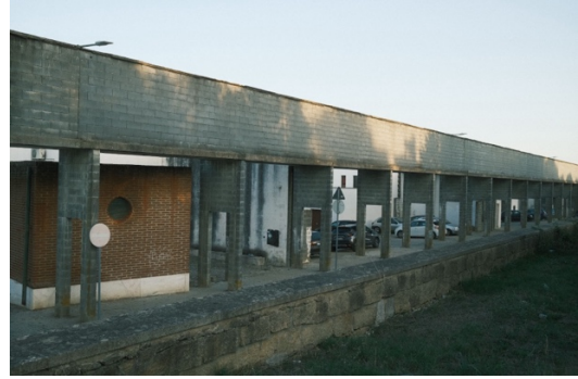
Figur 11. Akvedukten.

Den grå akvedukten går igenom hela Malagueira och leder el, gas och vatten till alla husen. Det var ett billigt sätt för Siza att slippa gräva ner alla ledningar i marken samt ett sätt att koppla ihop Malagueiras landskap med Évoras, eftersom staden har en gammal akvedukt från 1500-talet som är ett av de mest uppenbara och imponerande monumenten.