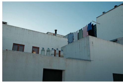
Figur 15. Tvättlinor på en av takterasserna