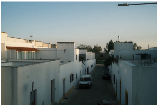
Figur 5. Murarna till husen är olika höga.