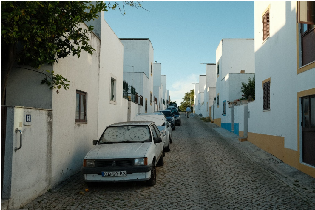
Figur 8. En av gatorna i Malagueira.