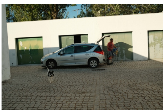
Figur 29. Mannen städar sin bil i sitt garage.