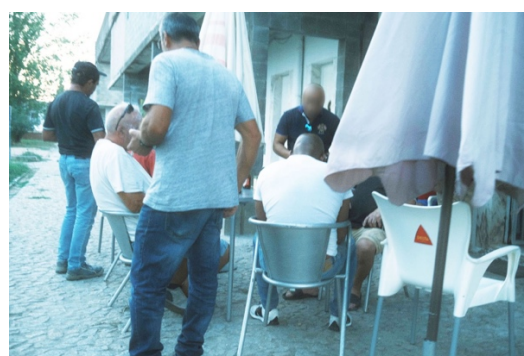
Figur 30. Män på en av uteserveringarna.