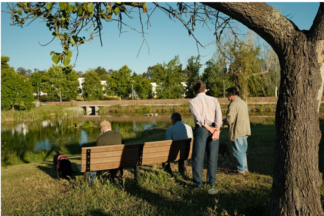
Figur 27. Äldre män med sina hundar umgås vid utsikt mot sjön Ribeira da Torregra.