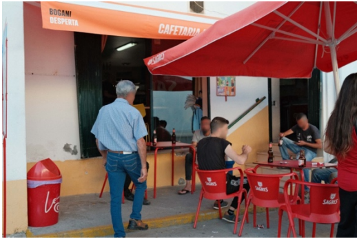
Figur 23. Uteserveringen på en av barerna.