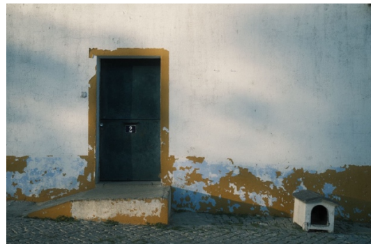
Figur 7. Innanför dörren finns en trädgård.