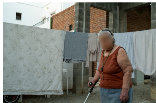
Figur 20. Kvinna passerar sin väninnas tvätt ute på gatan.