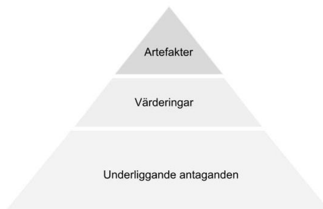
Figur 3: Egen omarbetning av Schein (1990)

Modellens syfte är att skapa en förståelse för kulturens olika nivåer, där den övre delen, artefakter , är den som är mest synlig, även för utomstående. Denna del består till exempel av värdeord. Värderingar består av sådant som alla i organisationen förstår men som kan ta ett tag för nya inom organisation att ta till sig i början. Underliggande antaganden , kan i motsats till de övre vara svår att förklara även för insiders (Schein 1990). Denna del består av sådant som anses så självklart i kulturen att man inte talar om det och att det kan vara svårt att i själva verket sätta ord på.