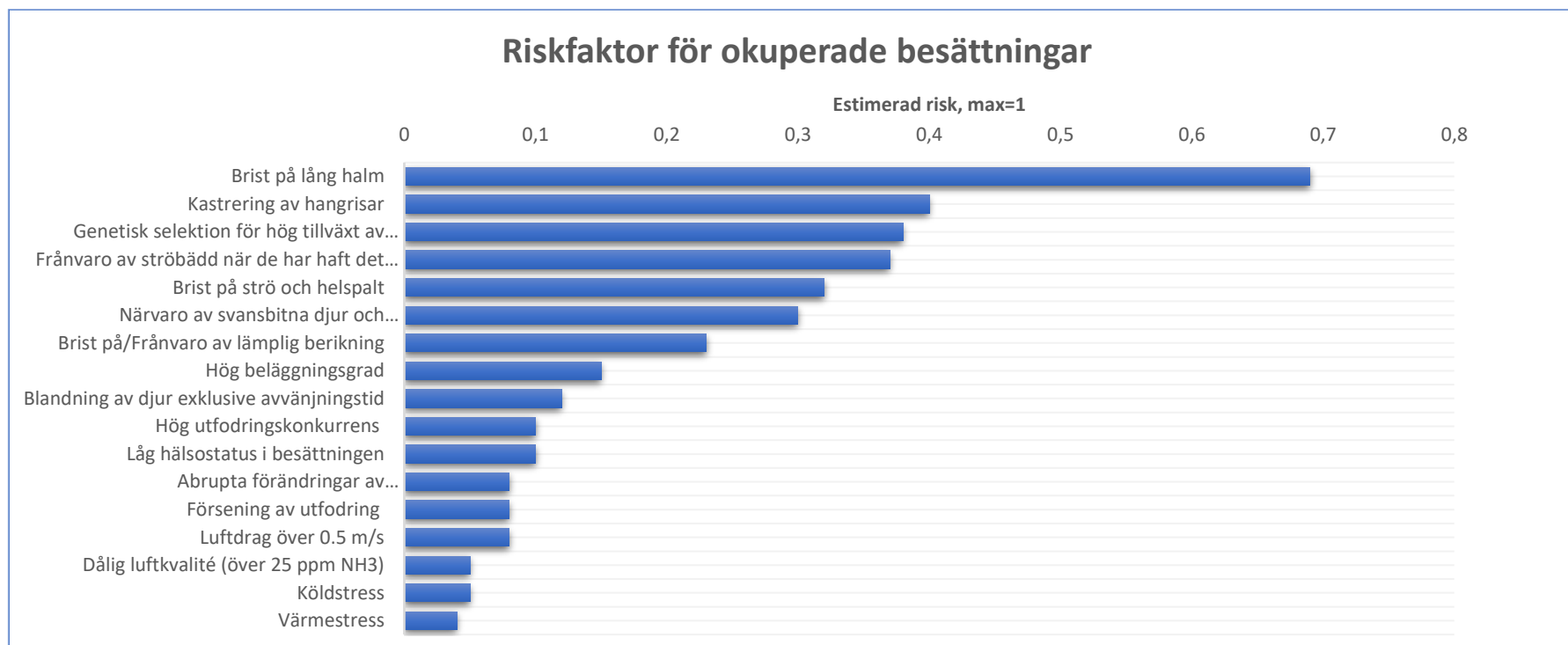
Figur 1. Tabell som visar riskfaktorer för svansbitning och hur stor risken är att svansbitning utbryter (EFSA 2007)