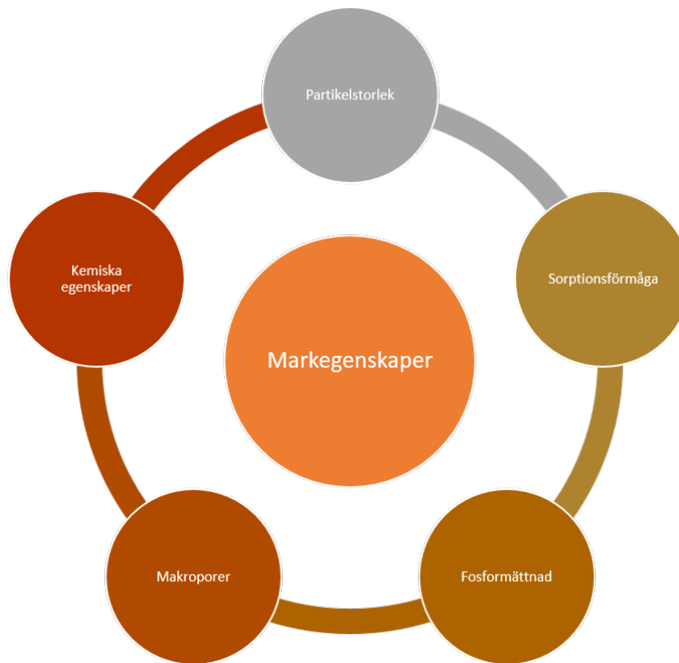
Illustration: Markegenskaper hos jordar vilket påverkar näringsläckaget.