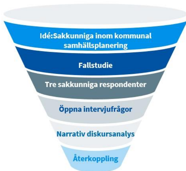
Figur 1. Metodologisk översikt i trattform. Illustrerad av författaren.

För att illustrera den metodologiska processen som används för att göra den här uppsatsen har en trattform illustrerats. Trattformen visar samtliga steg från uppsatsen som idé till den sista återkopplingen till respondenterna efter intervjuerna (figur 1). Anledningen att en trattform används för att illustrera metoden är för att i början av uppsatsen fanns mycket utrymme att styra studien. Däremot minskade möjligheten att justera uppsatsens upplägg ju längre metoden användes. Sammanfattat kan metoden delas in i sex olika steg. Vilka presenteras under figur 1.