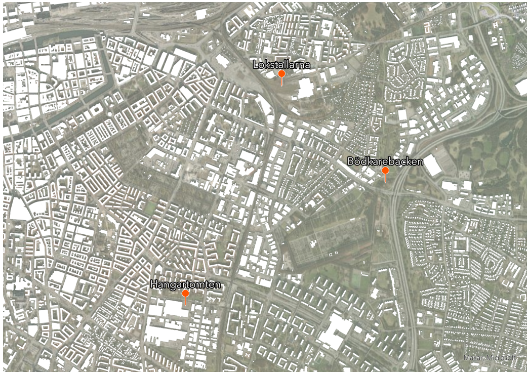
Figur 7, karta som visar de tre platsernas lokalisering i relation till varandra. Källa: Lantmäteriet (2023), Kartograf: Eriksson, A. & Gauffin Jatta, F.

Bödkarebacken är lokaliserad där Sallerupsvägen möter Inre Ringvägen (se figur 7 och 8). Det är en grönskande kulle i ett i övrigt flackt stadslandskap. Bödkarebackens lokalisering sätter platsen i något som kan beskrivas som stadens mer perifera områden, vilket gör att platsen för många kan framstå som okänd. Placeringen mellan de två stora trafiklederna gör även att platsen kan förbli okänd tills den dagen eventuell exploatering sker. Toppen av kullen erbjuder en bra utsikt över det närliggande landskapet som består av bostadsområden, parker och industrimark.