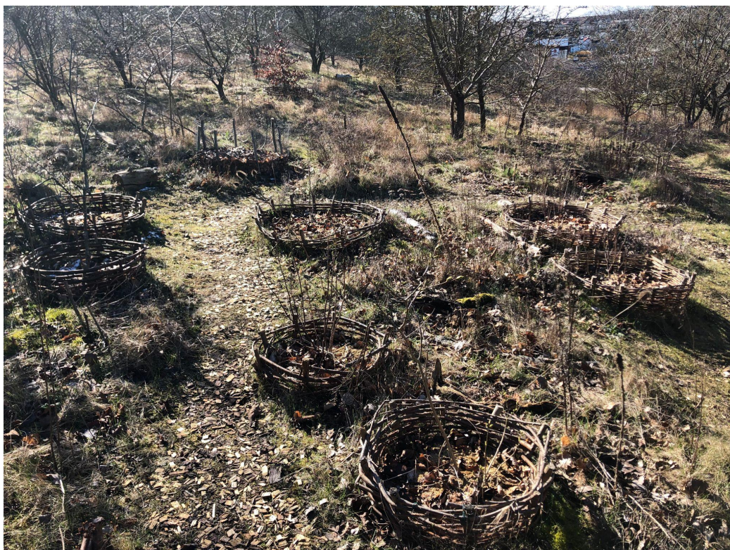
Figur 15 & figur 16, visar territorialiseringen vid Bödkarebacken.