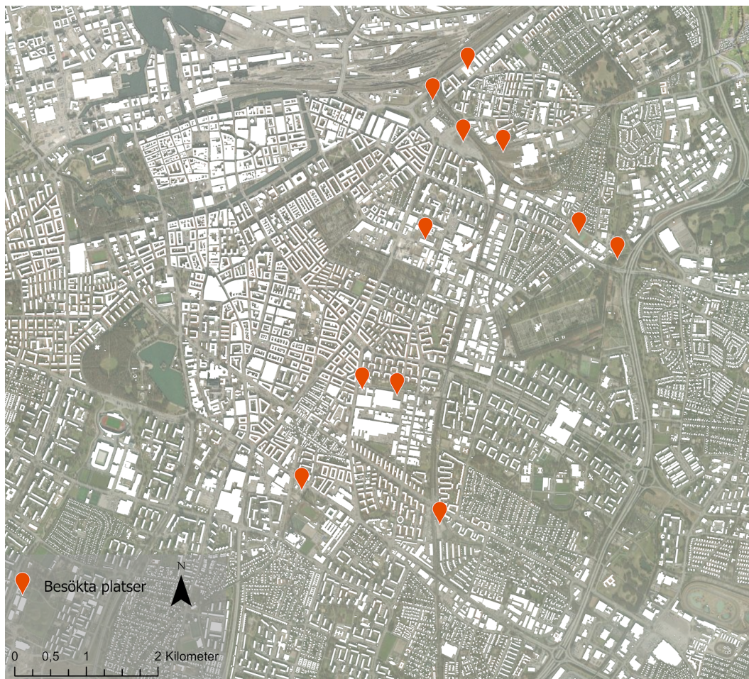
Figur 3, karta över de olika pilotbesöken som ägde rum innanför Inre Ringvägen. Kartograf: Eriksson, A. & Gauffin Jatta, F.

både Bödkarebacken och Hangartomten upptäcktes, vilket påvisar den styrka som finns i att vara på plats för att upptäcka stadsrum som ofta inte är synliga genom kartmaterial.