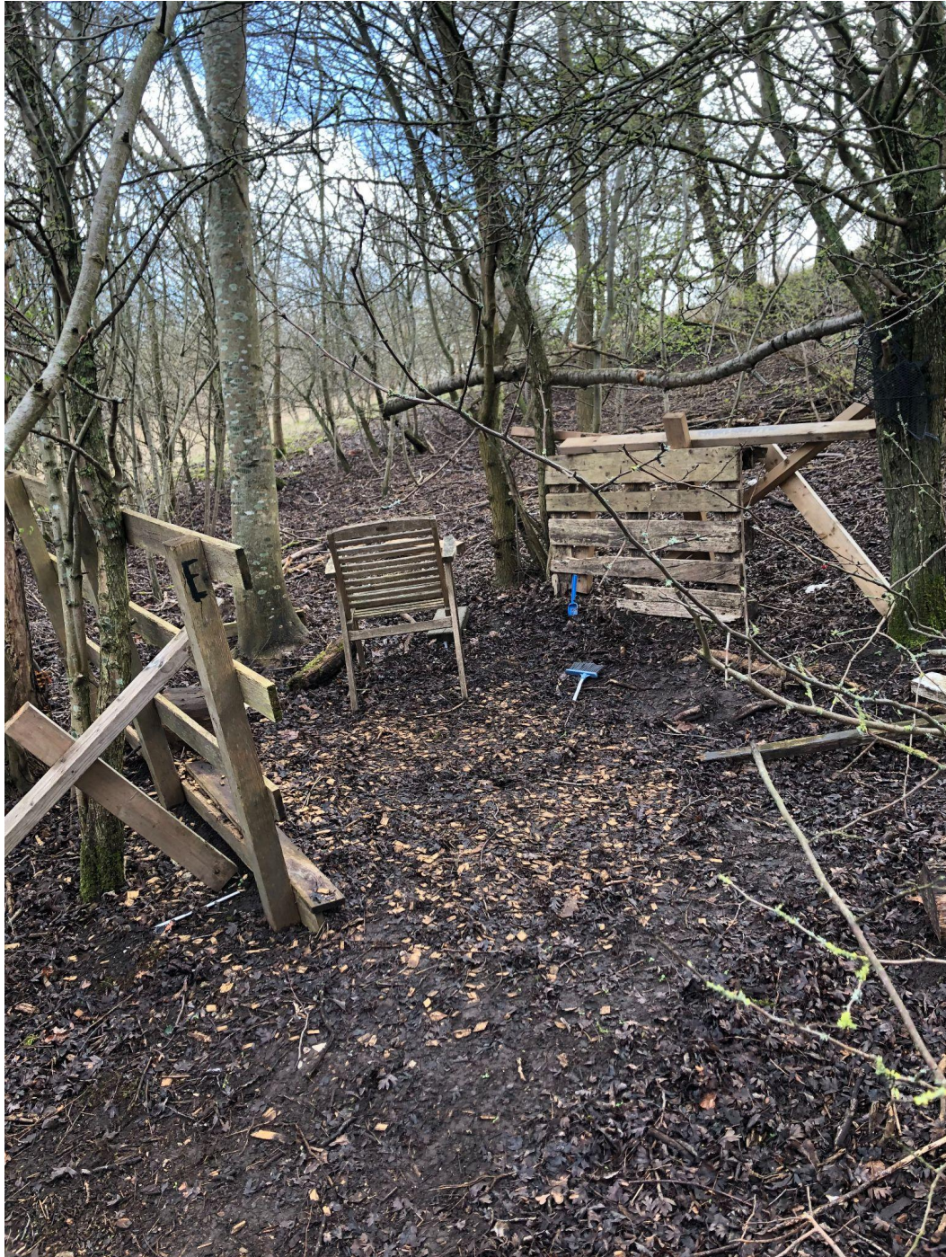
Figur 13, bild som visar den egentillverkade arbetsplatsen vid Bödkarebacken.