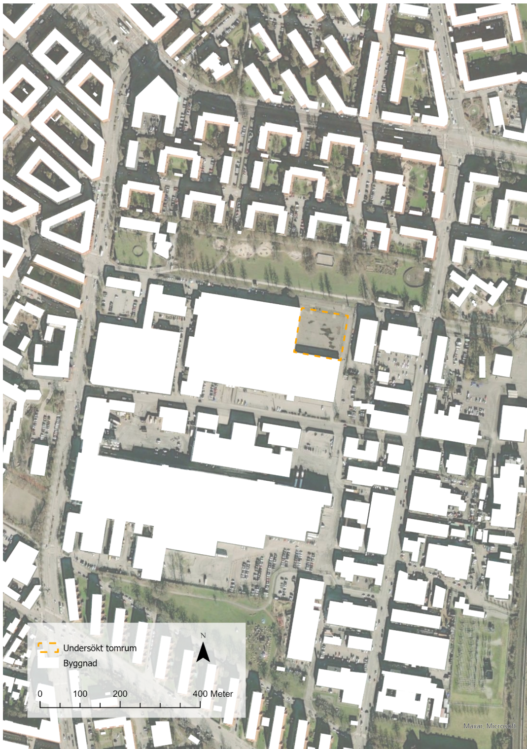
Figur 10, karta som visar Hangartomtens lokalisering. Kartograf: Eriksson, A. & Gauffin Jatta, F.