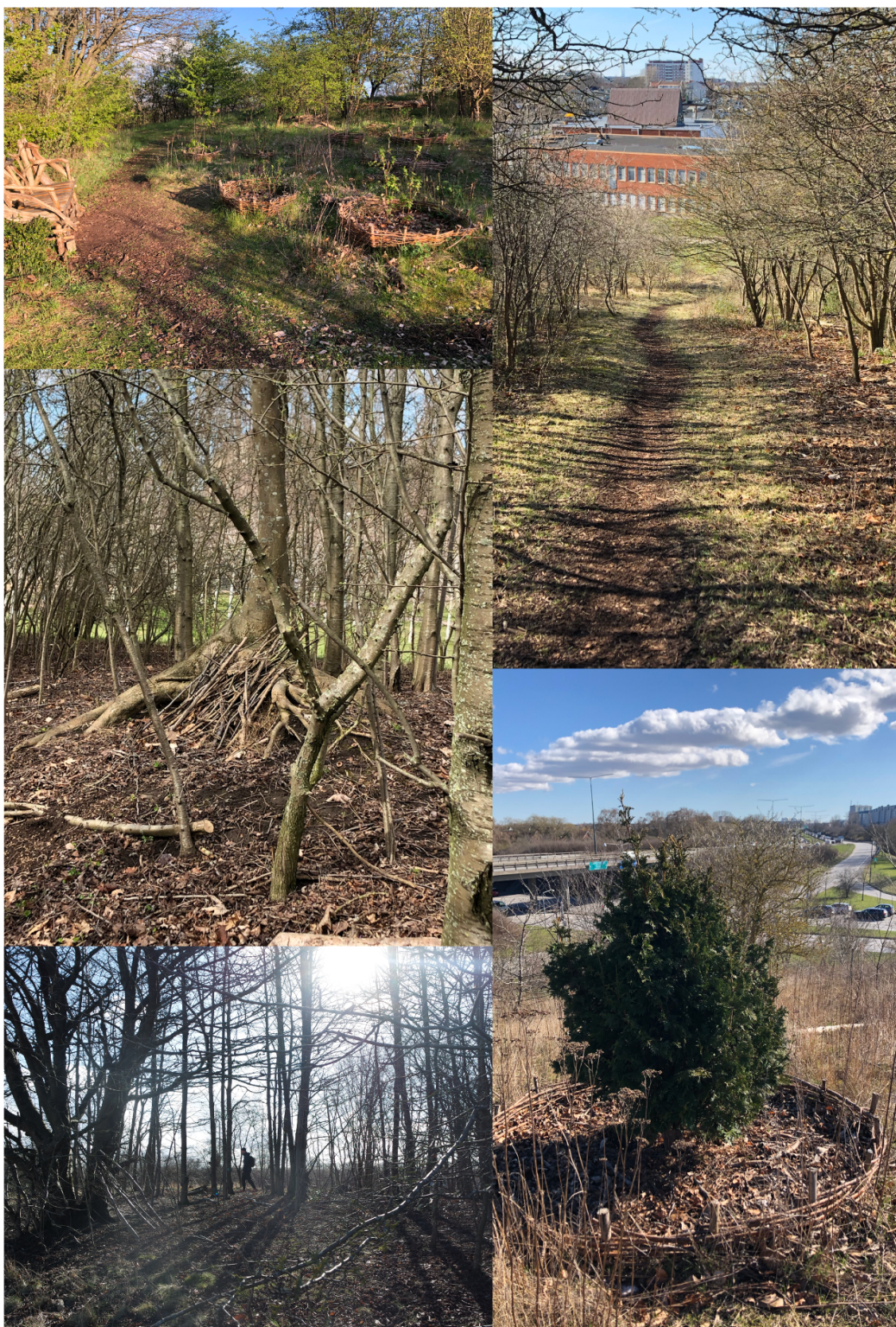
Figur 4. Bilder över Bökarebacken.