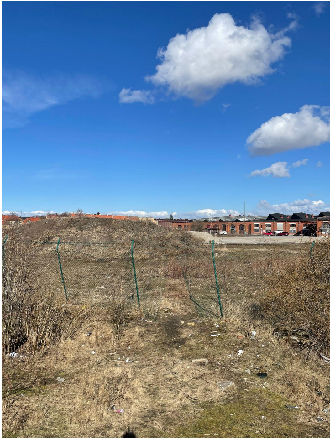
Figur 12, bild som visar hål i staketet vid Lokstallarna.