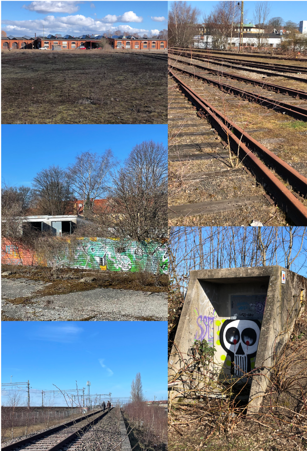
Figur 6. Bilder över Lokstallarna.