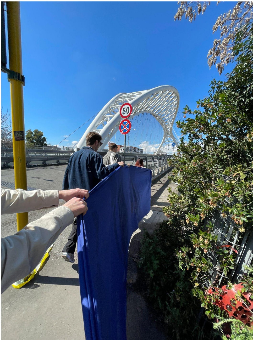
Figur 2, en konstnärlig aktion som Stalker genomförde tillsammans med konststudenter från Rom och Nantes samt från SLU och Malmö Universitet. Det 30 meter långa tygstycket representerade var en flod tidigare hade runnit.