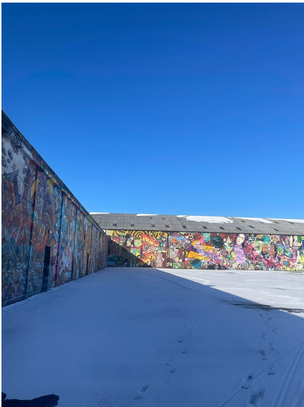
Figur 17, bild som visar Hangartomtens graffitiprydda väggar.

associationen kan gå att likna med en territoriell distinktion , vilket innebär att man genom att associera ett territorium med olika positiva eller negativa attribut kan tillskriva platsen olika egenskaper. “Det kan t.ex. handla om mimetisk territorialitet, där ett visst territorium blir eftertraktansvärt eftersom någon grupp approprierat/annekterat det, eller om exkluderingar där vissa grupper inte anses höra hemma på vissa territorier, eller om stigmatiseringar (Kärholm, 2004, s. 94). Bb (i personlig kommunikation den 11 april