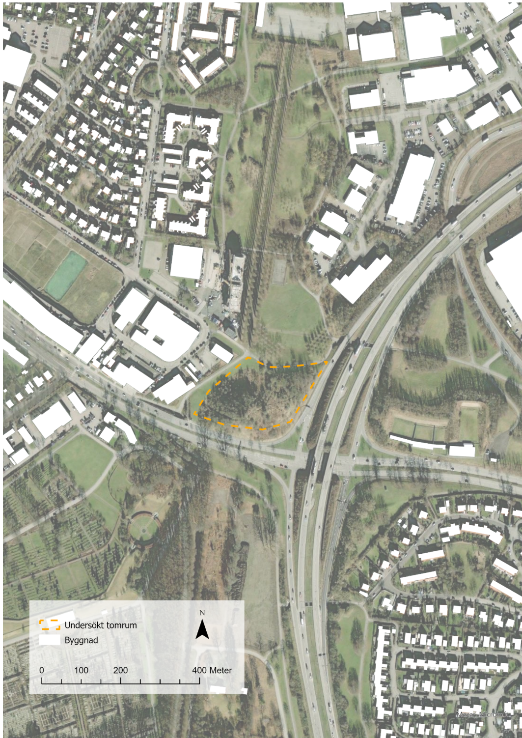
Figur 8, karta som visar Bökarebackens lokalisering. Källa: Lantmäteriet (2023), Kartograf: Eriksson, A. & Gauffin Jatta, F.