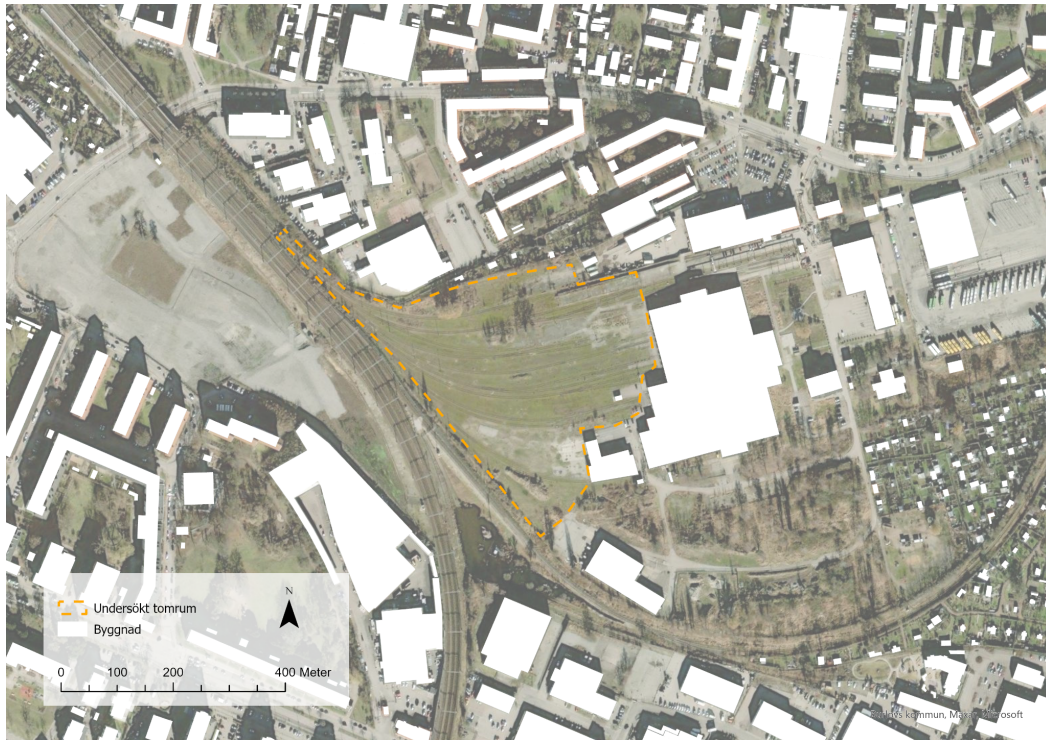
Figur 9, karta som visar Lokstallarnas lokalisering. Källa: Lantmäteriet (2023), Kartograf: Eriksson, A. & Gauffin Jatta, F.

Den tredje platsen som ingår i fallstudien är Hangartomten. Hangartomten är belägen i de norra delarna av Sofielund (se figur 10), närmare bestämt vid Enskifteshagen. Området runt omkring är ett populärt tillhåll för gatukonstnärer, musiker samt kulturella och sociala gemenskaper. Hangartomten är en stor asfalterad yta som framstår som tom och övergiven. Tomten är belägen inom kvarteret Kampen, ett kvarter med flertalet byggnader av industriell karaktär och som är omgärdat av stängsel. Hangartomten avgränsas åt syd och väst av byggnadskroppar vars fasader är prydda av muralmålningar. Bakom all konst finns arbetsgruppen och föreningen Centrum för urban konst (CFUK) som verkar för att göra den närbelägna graffitihangaren permanent och utveckla Malmö som gatukonststad. Tomten uppmärksammades, likt Bödkarebacken, i stunden genom att vi passerade platsen på väg mot en annan fastighet. Om det inte vore för all den urbana konst som är väl synlig från cykelvägen hade Hangartomten troligtvis inte uppmärksammats. Hangartomten är cirka 0,5 hektar stort. För att förstå Hangartomten som plats har hänsyn tagits till hela kvarteret och stora delar av Sofielunds verksamhetsområde.