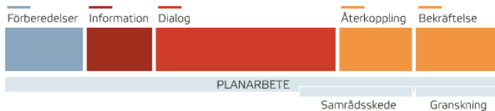
Figur 1. Steg i dialogprocessen

De olika etapperna i dialogprocessen vid fysisk planering idag har illustrerats av Boverket (2021a), se figur 1. Etappen dialog har placerats efter att en process med förberedelser och information har genomförts. Denna process innefattar bland annat att besluta om hur mycket invånare ska involveras och när i planeringen samt skickas en inbjudan till dialog ut till dem som anses vara berörda intressenter.