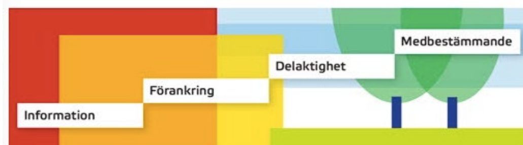
Figur 2. Illustration för delaktighetstrappan.

Boverket beskriver att förankring, delaktighet och medbestämmande ska involvera någon form av dialog, medan information är ett tillfälle av enkelriktad kommunikation. Boverket konstaterar också att modellen inte har någon egentlig erkänd riktning, utan många dialogprocesser rör sig mellan och parallellt med de olika nivåerna på olika sätt beroende på vad det är för fråga som diskuteras. (Boverket 2022c).