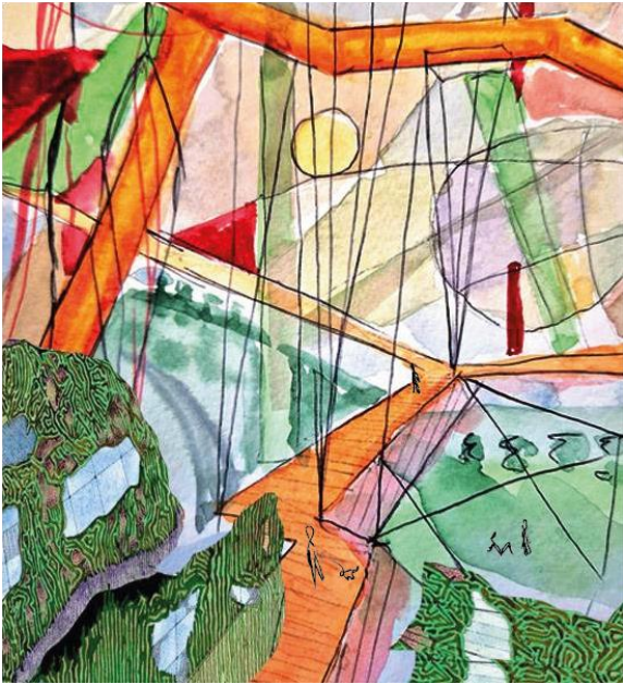
Figur 4. Inspirerad av Peter Cooks skiss 'Filter City' (Moa Göransson 2023)

Handskissad och abstrakt skapandeprocess