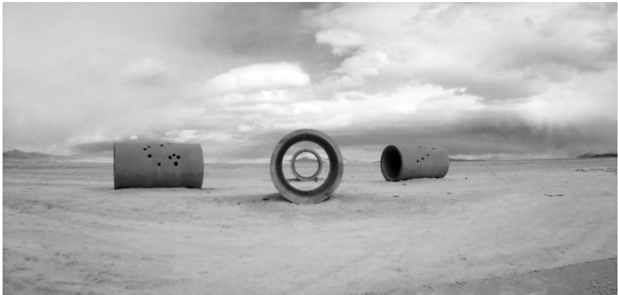
Figur 8. Fotografi av Nancy Holts 'Sun Tunnels' (N 2015)

Holt spenderar mycket tid utomhus för att observera och analysera landskapet (Holt Smithsonian foundation, 2021). Holt har uppfattningen att landskapets betydelse och de båda lyfter vikten av att förstå omgivningen och lära känna den innan man tillför något i den, hon inspireras även av landskapets former och linjer och använder dem i skapandet av sina verk (Holt Smithsonian foundation, 2021).