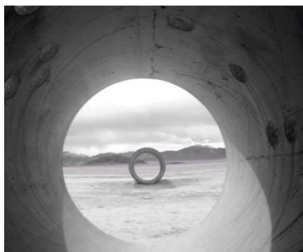
Figur 7. Fotografi av Nancy Holts 'Sun Tunnels' (N 2015)

Nancy Holt var en mångsidig konstnär som skapade allt från film och poesi till skulpturer och installationer (Holt Smithsonian foundation, 2021). Mest känd är hon för sin landskapskonst och de platsspecifika installationer hon utformade. Genom att jobba med naturen och dess element lyckades Holt skapa verk som inte bara harmoniserade med sin omgivning, utan också blev en del av den. Hennes installationer tar hjälp av ljuset, solen eller landskapet och blir på så sätt ett med sin omgivning (Holt Smithsonian foundation, 2021).