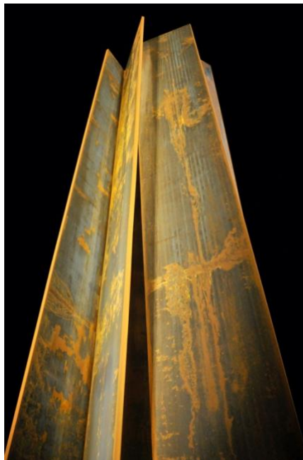
Figur 9. Corténskulptur av Richard Serra (LBM1948 2019)