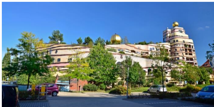
Figur 2. Waldspirale i Darmstadt, Tyskland. av Friedensreich Hundertwasser

Friedensreich Hundertwasser, konstnär och arkitekt, hade som motto; den raka linjen är något fejt ritat med en linjal, utan tanke eller känsla; det är en linje som inte finns i naturen (Hundertwasser u.å.). Med detta menade han bland annat att linjaler och regler dödar kreativiteten. Mottot applicerade Hundertwasser på sina målningar såväl som på de hus han ritade, exempel målningen nedan. Hundertwasser har beskrivits som sui generis , vilket menas med den enda av sitt slag (Merriam-Webster u.å.). Ordet används mer allmänt för allt som kan stå för sig själv (Merriam-Webster u.å.) och menas i Hundertwassers fall att han inte passar in i någon konststil.