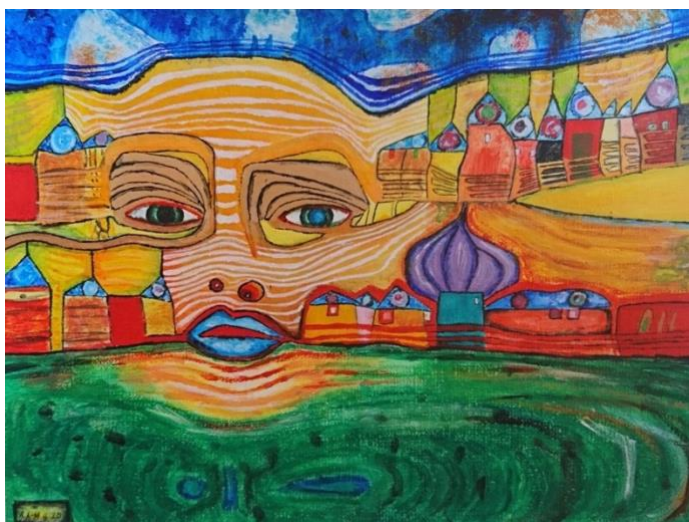
Figur 3. Inspirerad av Hundertwassers målning 'Irrinland über dem Balkan' (Alma Hultén 2020)

Hundertwassers död, ligger i Darmstadt och har en fasad av linjer och färger i lager (Fernweh nach welt 2016). För Hundertwasser, som arbetade för grön arkitektur och tyckte att alla horisontella ytor var reserverade för naturen, var det viktigt att stora delar av Waldspiralens tak var oåtkomligt för människan så enbart naturen fick frodas. I en artikel i StadtKulturMagazin (Trinkaus 2021) blir paret Birte och Konrad intervjuade om hur det är att bo Waldspirale. Att leva i harmoni med naturen, enligt Hundertwasser ideal, är viktig även för paret och var en av anledningarna till att de flyttade in i lägenheten som har direkt tillgång till innergården. John Dew, tidigare direktör på stadsteatern i Darmstadt, har bott i Waldspirale sedan 2005 och berättar under en intervju hur han inte har några tankar på att flytta och beskriver huset som en illusion av att leva i något handgjort (Fernweh nach welt 2016). Dew fortsätter att huset är som ett konstverk i sig och i varje ny lägenhet han sett upptäcker han fler spännande saker, som ovanliga fönster, pelare mitt i rummet eller färgade glasskivor.