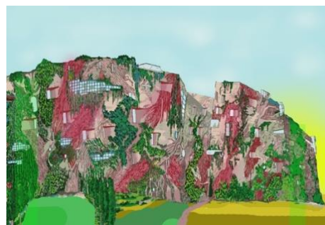
Figur 5. Inspirerad av Peter Cooks skiss 'Inhabited Wall' (Moa Göransson 2023)

I en intervju med ArchDaily (2016) berättar Cook om värdet med att arbeta för hand. Han jämför det med att jobba i digitala program, som han förklarar kan skapa fantastiska saker, men det analoga arbetssättet tillåter-enligt Cook- arkitekten att göra fel, vilket han säger gynnar arkitekturen eftersom att handen är så tätt sammankopplad med hjärnan och att det snabbaste sättet att få ner en idé därför är att skissa det för hand. Genom att låta