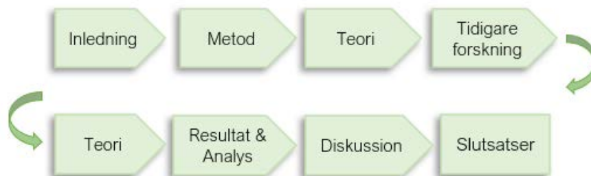
Figur 1. Uppsatsens disposition. Egen bearbetning.

I nästkommande kapitel kommer uppsatsens tillvägagångssätt och metod att presenteras, samt vilka aktörer som har intervjuats. I kapitel tre presenteras det teoretiska ramverket som är utvecklat för denna studie, ramverket är ett verktyg för att besvara forskningsfrågorna. Kapitel fyra berör bakgrunden kring ämnet om klövviltsförvaltning och följs av ett kapitel om tidigare forskning. I kapitel sex presenteras studiens resultat och analys. De två sista kapitlen redogör för studiens diskussion samt författarens slutsatser. Uppsatsens disposition illustreras i figur 1.