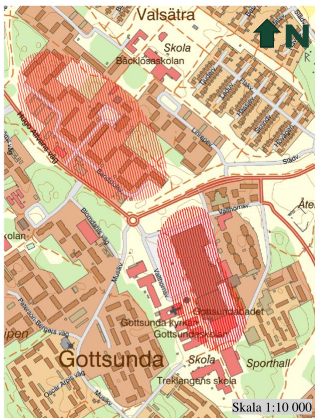
Figur 1. Fastighetskarta över södra Valsätra och centrala Gottsunda. De platser som är markerade med rött raster, Bandstolsvägen överst och området runt Gottsunda centrum nederst, är adresser som blivit utpekade som mest otrygga.

närvaro och bättre belysning (Uppsala kommun 2018). I Valsätra önskade 61 % av undersökningsdeltagarna en ökad polisnärvaro i bostadskvarteren och i Gottsunda låg siffran på 46 %. I samma undersökning framkom även att de platser som upplevdes mest otrygga i området låg koncentrerade runt Bandstolsvägen i Valsätra och runt Gottsunda centrum, markerade på kartan i Figur 1. Mohamed Omar (Omar 2017) som bott på Bandstolsvägen mellan år 2005 och 2016, skriver i sin blogg om hur synen av kriminalitet, våld och droghandel var en del av vardagen. Han beskriver även hur stadsdelen präglas av kulturellt, mentalt och ekonomiskt utanförskap och kallar det för en no-go-zon. Även May Shaabani, bosatt i Valsätra, berättar för UNT om hur otryggheten gör att hon aldrig vistas utomhus i Gottsunda när det är mörkt och att hon även när det är ljus ser sig över axeln (Sandow 2019).