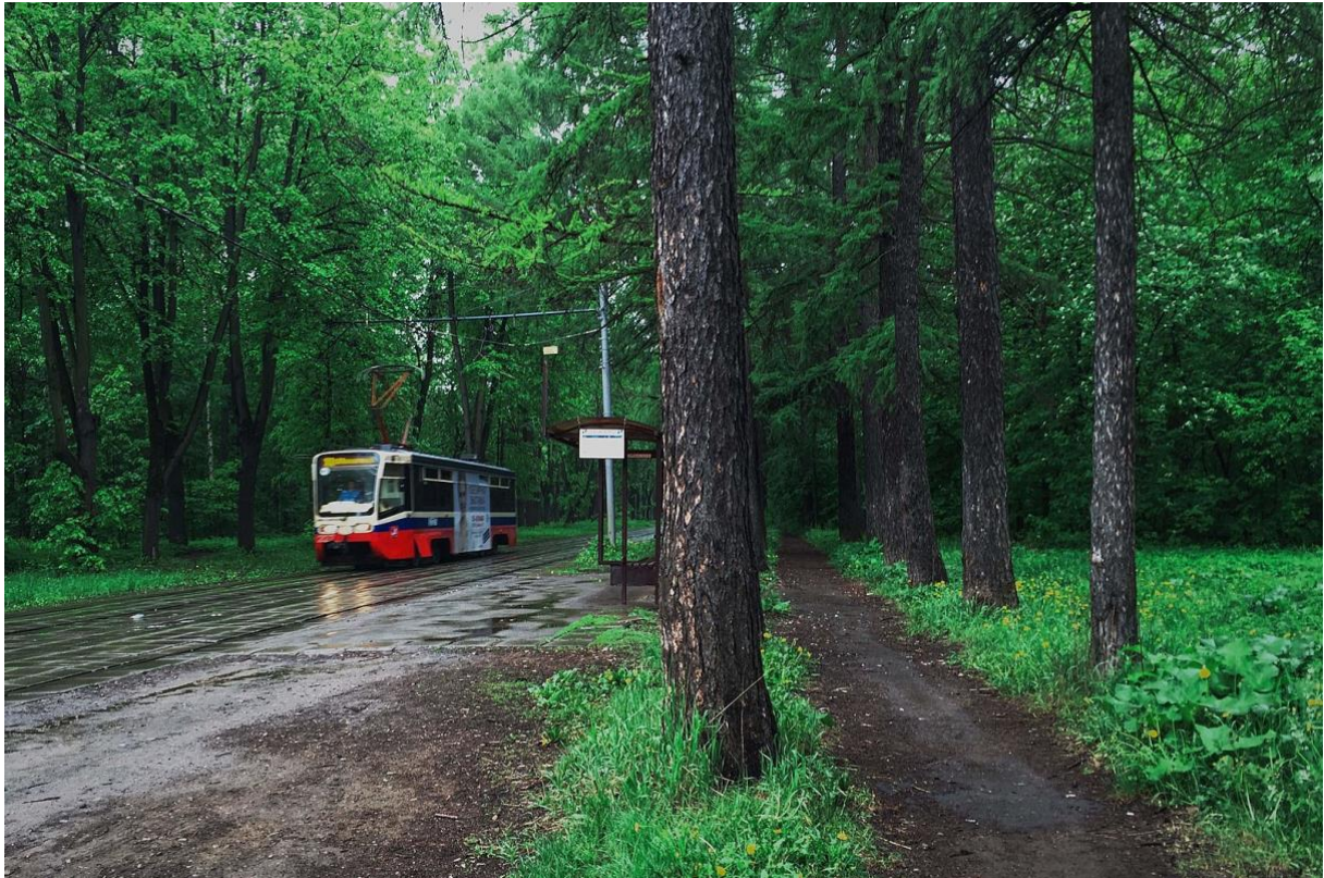
Figur 7. Moscow, tram tracks through Izmaylovsky Park (Grachev 2016) (CC BY 2.0). Figurtext: Spårvagn i Izmaylovsky-parken

I början hade parken vattenelement i parkens centrala del, utformad som en cirkel, och var grunden för parkens resterande utformning (Slepnev och Al-Qatranly 2021). Två alléer, en större och en mindre, cirkulerade i förhållande till vattnet i parkens mitt. Under åren har parken blivit en uppskattat grönområde i staden och parken har flera gånger använts för sociala evenemang. En gedigen plantering av buskar och träd har dessutom tillförts i parken med åren. Ytterligare tillägg i form av olika typer av attraktioner tillfördes också. I dag är parkområdet dessutom en del av en beskyddad naturmark (ibid).