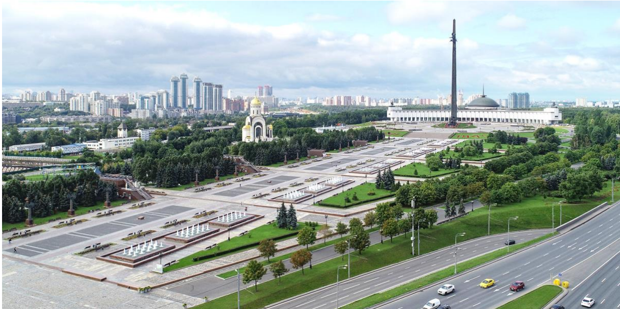
Figur 5. Victory park on Poklonnaya Hill. Figurtext: Segerparken på Poklonnaya Gora där ett upprest monument syns i änden av parken tillsammans med vattenspel i ett axiellt mönster från monumentet. Stora ytor hårdgjort syns i gångarna mot monumentet.

Ett exempel på en av de många objekt som finns i parken i Poklonnaya Gora, är statyn av sakt George som dödar en drake utsmyckad med svastikor och som ska symbolisera segern över Nazityskland. Förutom statyn finns det också museum, religiösa kapell, en stor öppen yta och mindre minnesmärken och platser. Platsen är en viktig del för den ryska historien, särskilt strax efter andra världskrigets slut fram till mitten av 1980-talet. Faktum var att det kanske till och med var den enskilt mest betydelsefulla händelsen för skapandet av den nationella identiteten i Sovjetunionen, menar Forest och Johnson (2002).