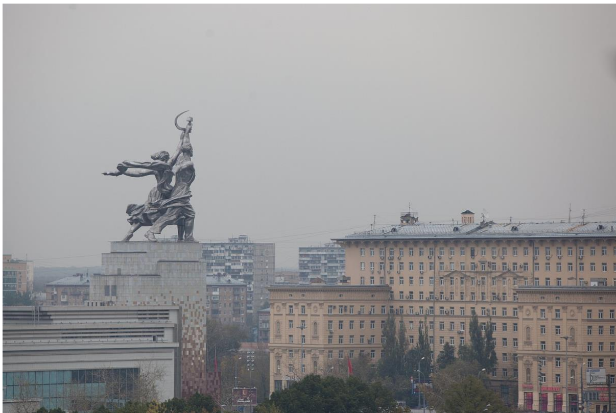
Figur 1. Moscow, Worker and Kolkhoz Woman from the Main Gate. Figurtext: I Vera Muchinas verk "Arbetare och kolchoskvinna" syns en man och en kvinna hållandes i hammaren och skäran (sovjetiska symboler för industri och jordbruk) som tillsammans stegar bestämt in i framtiden. Verket är ett klassiskt exempel på socialistisk realism och skulle inspirera befolkningen i Sovjet att göra likadant.