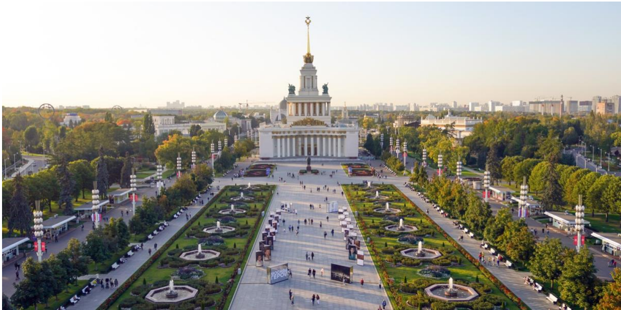
Figur 6. VDNKh. Figurtext: Bild på VDNKH-parken 2020 efter flera genomgående förändringar

Från och med 1991 kom parken att förlora det statliga stödet för sina utställningar, vilket ledde till att parken förlorade sin status som en viktig utställningsplats, enligt Forest och Johnson (2002). Förändringen ledde till att parken övergavs, tills paviljongerna började att hyras ut. Så småningom blev paviljongen för kemi en lekplats för barn med ett Djungelboken-tema och paviljongen för atomenergi blev en plats för tekniska tjänster som hade datorer, faxar, kopiatorer och annan teknisk utrustning. Ryssarna kunde köpa allt från hemelektronik, smycken och bilar på platsen och längre fram byggdes även ett nöjesfält i parken. Forest och Johnson (2002) skriver fortsättningsvis att parken fick en strategisk plan 1999 som skulle utveckla parken till en mer storskalig utställningspark av mer kommersiell karaktär.