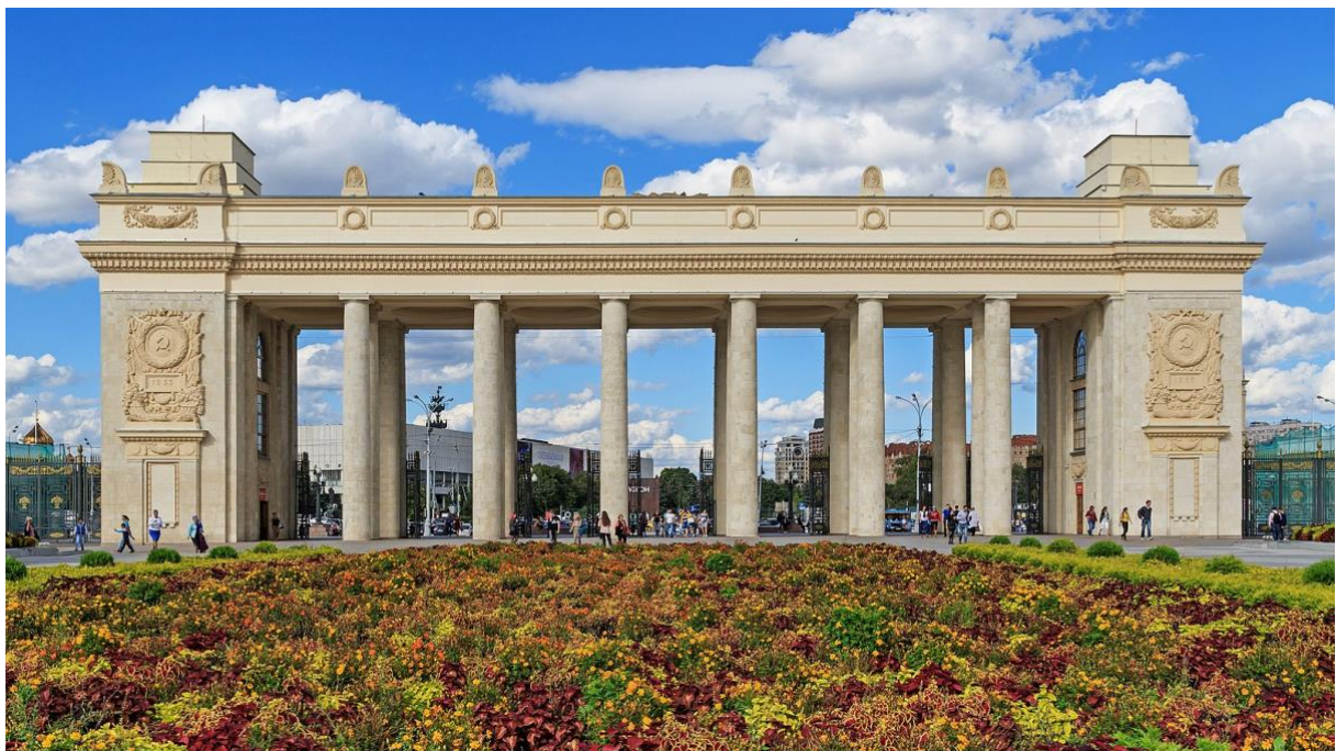
Figur 3. Moscow Gorky Park main portal. Figurtext: Huvudentré till Gorkijparken.

Under åren fram till andra världskriget var Gorkijparken en populär plats för aktiviteter och rekreation men även karnevaler, teater och musikevent ägde rum. Efter andra världskriget och början av 1950-talet hade dock parkens popularitet minskat betydligt (Shaw 2011). På 1950-talet invigdes den stora porten till parkens entré utan någon särskild uppmärksamhet. För Gorkijparken innebar 1950-talets nya politik inga större förändringar, liksom mycket av resterande arkitektur i Sovjetunionen (ibid). Parkens popularitet fortsatte senare under andra hälften av 1900-talet att minska och så småningom att bli utkonkurrerad av andra nyare och modernare parker. Shaw (2011) menar dessutom att parken i dag tenderar till att betraktas som omodern med en spretig blandning av olika tidstypiska och internationella objekt.