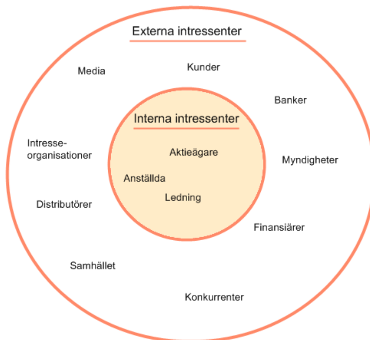
Figur 2. Figur över en organisations externa och interna intressenter (egen version enligt Kotler 2000, s. 40-47).

Utöver denna distinktion kan också en göras mellan direkta och indirekta intressenter göras (Grafström et al. , 2008, jmf Buchholtz & Carroll, s. 87). Direkta intressenter är intressenter som är nödvändiga att tillfredsställa för organisationens överlevnad. Dessa kan exempelvis vara kunder, anställda, finansiärer och ägare. Indirekta intressenter är de som inte direkt kan påverka företagets överlevnad. Media, myndigheter och intresseorganisationer är sådana aktörer som ofta kategoriseras som indirekta, men det visar sig snart att denna uppdelning är problematisk (Grafström et al. , 2008, s. 68). I medias fall så kan den rapportering som media bedriver göra att kunder aktivt väljer bort en organisations produkter, vilket gör att den indirekta påverkan är i själva verket livsviktig för organisationen att hantera (Grafström et al. , 2008, s. 68). Uppdelningen säger alltså inte något om hur viktig en intressent är att ta hänsyn till. Inte heller är det en fast uppdelning – en intressent som är indirekt i dag kan snabbt bli en direkt aktör. Detta samtaget gör att organisationer måste bevaka sin relation till både indirekta och direkta aktörer.