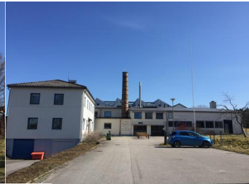
Fig 3. Vy över Uddebo andelsjordbruk. Fig 4. Gula huset.