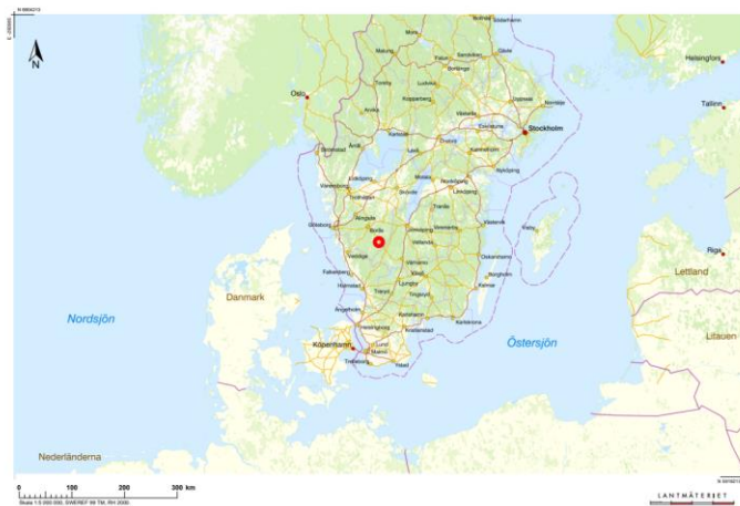
fig.2, Uddebo. SWEREF 99 RH 2000. [Karta] [2021-05-11]