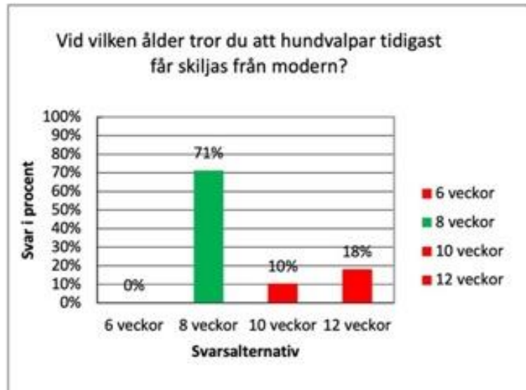
Figur 3. Respondenternas svar på vid vilken ålder hundvalpar tidigast får skiljas från modern. Det korrekta svarsalternativet är markerat i grönt, övriga i rött.

Majoriteten av respondenterna svarade rätt på frågan om när hundvalpar tidigast får skiljas från modern (Fig. 3). I figuren nedan presenteras samtliga svar på frågan.