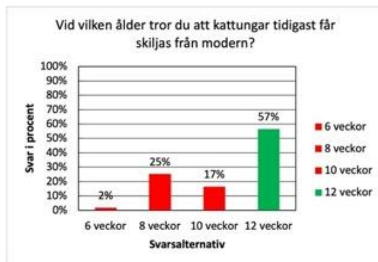
Figur 4. Respondenternas svar på vid vilken ålder kattungar tidigast får skiljas från modern. Det korrekta svarsalternativet är markerat i grönt, övriga i rött.

Majoriteten av respondenterna svarade rätt på frågan om när kattungar tidigast får skiljas från modern (Fig. 4). I figuren nedan presenteras samtliga svar på frågan.