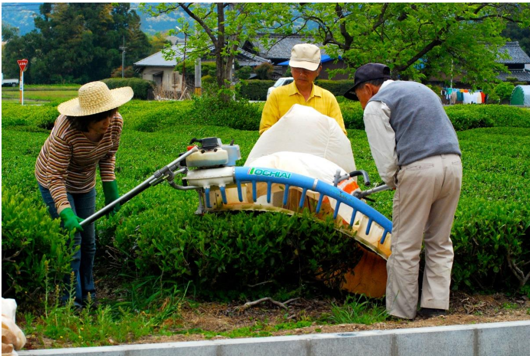
Figur 5. En skördemaskin för två personer bestående av en krökt häcksax och luftmunstycken som blåser tebladen in i den uppsamlade påsen. (Studholme 2009) (CC BY 4.0)

De enklare redskapen är främst saxar och blad- eller knivredskap som kan skötas av en person. Det finns även klippaggregat som antingen kan drivas för hand, dras på hjul eller vara självgående (Willson 1992b). De allra största maskinerna kan skörda två till tre rader på en och samma gång. Ett exempel på en mer avancerad maskin är en roterande cylinderskärare som sitter på en självgående maskin på hjul (Rutatina & Corley 2019). Hastigheten och klipphöjden är justerbara. En maskin hanteras av tre arbetare, två som ser till att den rör sig korrekt och en som samlar ihop de skördade bladen (se Figur 5.). Det är viktigt att de maskiner som används inte är för tunga då de kan göra marken mer kompakt. Enligt Dalimoenthe (2008) är potentialen hos maskin-plockning nästan sex gånger högre än för handplockning. En maskin skulle kunna ersätta 20 arbetare under en plockningsomgång.