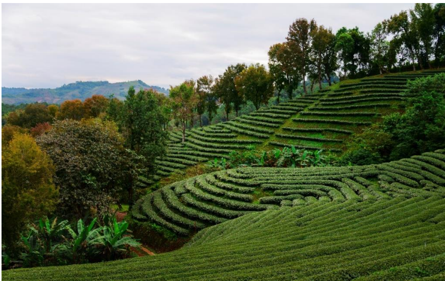
Figur 1. Terrassodling med lähäcksplanteringar. (Tong Lee 2018) (CC BY-ND 4.0)

Enligt Chen (2009) bör teodlingar i Kina endast etableras på sluttningar med max 25°. En alltför brant sluttning ökar risken för vattenavrinning, jorderosion och jordskred (Jayasinghe et al. 2019; Othieno 1992). Nederbördsintensiteten och jordens fuktighet är också en betydande faktor rörande erosion (Ziadat & Taimeh 2013; Othieno 1992). En dräneringsanläggning av något slag, till exempel ett dike, kan motverka ansamling av vatten vilket i sin tur kan förhindra erosion eller jordskred (Willson 1992a). Terrassodling är ett annat exempel (se Figur 1.). Terrasser är rader av upphöjningar som förekommer med jämna mellanrum i odlingen. De stoppar erosionen och är vanliga i till exempel Kenya. En täckgröda kan sås eller planteras för att minimera risken för läckage och erosion när marken förberetts inför en te-plantering. Detta motverkar också ogrästillväxt (se 7.5. Ogräsbekämpning).