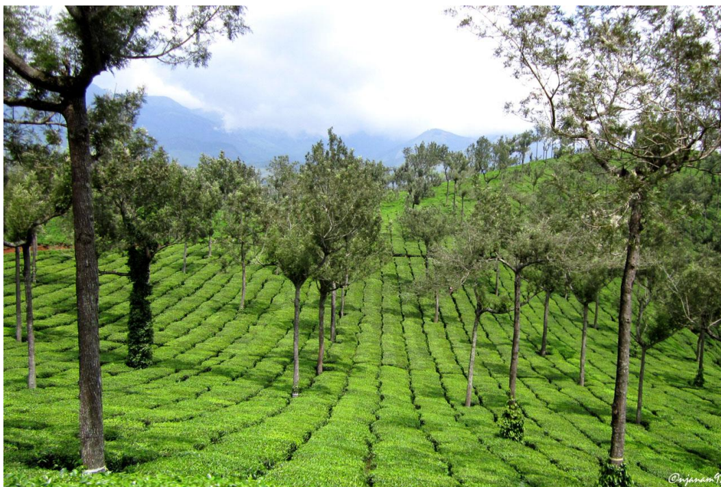
Figur 3. Teodling med skuggningsträd. Kerala, Indien. (Malik 2012). (CC BY-NC-ND 4.0)

al. 2008; Duncan et al. 2016). Skuggning av odlingen kan göras med träd eller skuggvävar (se Figur 3.). Willson (1992a) rekommenderar att plantera skuggningsträd ett år innan te-plantorna. I Bangladesh planteras temporära och permanenta träd samtidigt, eftersom de permanenta träden har en längre etableringsperiod (Rahman et al. 2020). Efter ungefär fem år, eller när de permanenta trädens kronor är tillräckligt täckande, tas de temporära träden bort. De träd som används som skuggningsträd tillhör främst familjen Fabaceae följt av Meliaceae . I Bangladesh används ofta släktet Albizia som permanenta skuggningsträd. I ett försök av Mulugeta (2017) mer än dubblerades skörden i torr vikt när skuggningsträden bestod av Albizia -träd, jämfört med o-skuggade tebuskar. Albizia -träden släppte igenom 65 procent relativ ljusintensitet och ledde till förbättrad luftfuktighet, luft-, blad- och jordtemperaturer samt ökad jordfuktighet. En reglering av lufttemperatur och luftfuktighet kan dessutom bidra till en reducerad förekomst av vissa sjukdomar och insekter (Wijeratne 2018).