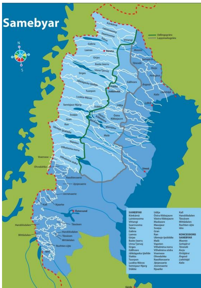
Figur 1. Karta över samebyarna i Sverige (Samiskt informationscentrum 2020a)

Det finns tre olika typer av samebyar; fjäll-, skogs- och koncessionssamebyar. En fjällsameby förflyttar under renåret sina renar mellan skogsområdet i öster, högfjällsområdet i väster och lågfjällsområdet som ligger däremellan. Fjällsamebyn flyttar ofta med sina renar upp på högfjället sommartid. Skogssamebyar bedriver oftast renskötseln i skogen året runt. I Sverige pratar man om ”fjällren” och ”skogsren” men det handlar likväl om samma art. En koncessionssameby bedriver koncessionsrenskötsel, vilket innebär att en same får ansöka om tillstånd (koncession) att sköta renar året runt utanför lappmarksgränsen i Tornedalen. Renar sköts då åt dem som äger eller brukar jordbruksfastigheter i området (Sametinget 2020a, Samiskt informationscentrum 2020a; Rehbinder & Nikander 1999). Koncessionsrenskötsel är den typ av renskötsel som är mest stationär.