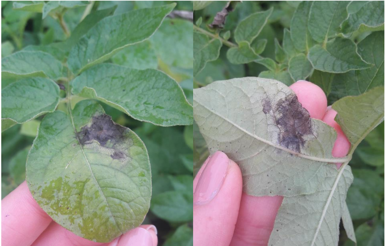
Figur 1 – Angripna celler initierar hypersensitiv respons vilket resulterar i nekrotiska, mörka fläckar omgivna av hyfer, vilka bildar ett vitt mögelludd på undersidan och grågrönt mögelludd på översidan.

Som man kan se i figur 1 bildas nekrotiska fläckar på bladen vid angrepp av P. infestans . Detta sker till följd av den hypersensitiva respons (programmerad celldöd) som växten själv utlöser. Om luftfuktigheten är hög så bildas ett vitt mögelludd längs med fläckarnas kanter, främst på bladundersidan. Är luften torr kan en grågrön, millimeterbred kantzon anas kring de nekrotiska fläckarna på ovansidan bladet (Andersson & Sandström 2000).