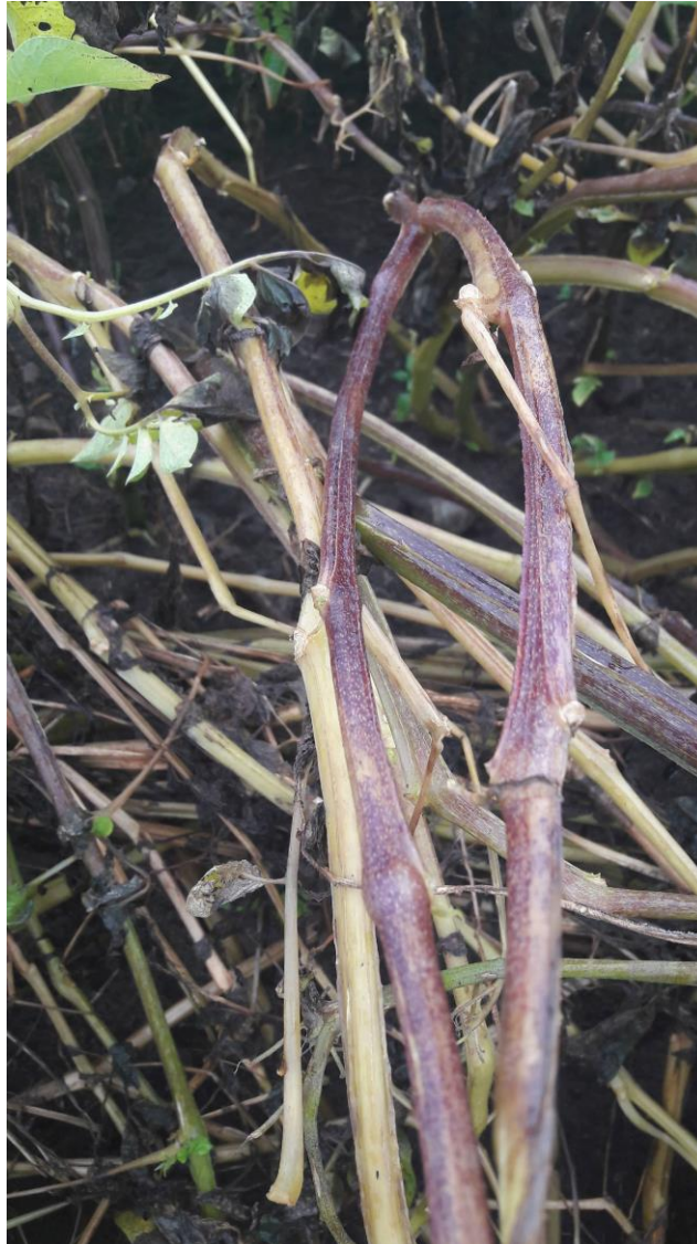
Figur 2 – Infekterade stjälkar får mörkbruna strimmor på stjälkarna.

Om smittade knölar används som utsäde, alternativt att smittade knölar ligger kvar i fältet från föregående säsong (sk. överliggare ) växer mycelet in i groddarna och upp i stjälkarna. Då väderförhållandena är dem rätta visar sig angreppet som mörkbruna strimmor på stjälkar eller bladskaft (Andersson & Sandström 2000; CABI, 2019). Detta illustreras i figur 2.