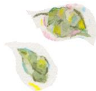
Figur 5. Spenat Spinacia oleracea .

Färgämnet tillverkas genom torkning och efterföljande lösningsextraktion (Francis, 2002).