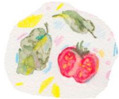
Figur 1. Tomat Solanum lycopersicum .

Lykopen E160d återfinns bland annat i livsmedlen glass, sylt, tuggummi och läsk (Livsmedelsverket, 2020g).