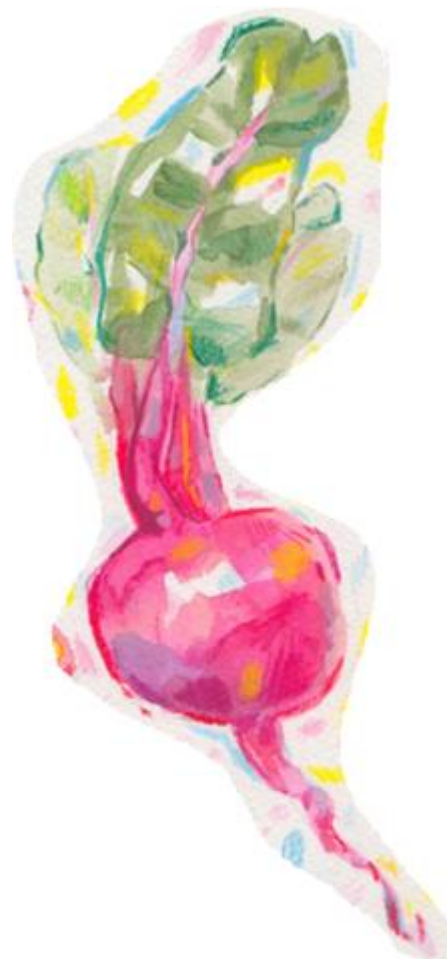
Figur 4. Rödbeta Beta vulgaris .

Vid förändringar av pH är betanin ett förhållandevis stabilt färgämne (Potter & Hotchkiss, 1995; Francis, 2002). Vid värmebehandling eller i starkt ljus riskerar däremot den rödrosa färgen att brytas ner och ersättas av brun färg (Potter & Hotchkiss, 1995; Francis, 2002; Chapman, 2011). Färgämnet oxiderar dessutom lätt i miljöer med hög vattenaktivitet. Det betyder att färgämnets färg förändras lätt i produkter med mycket vatten och lågt innehåll av socker (Chapman, 2011).