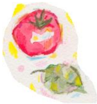
Figur 2. Tomat Solanum lycopersicum .

Halten lykopen i tomater kan variera. Lykopenhalten ökar allt eftersom frukten mognar och blir