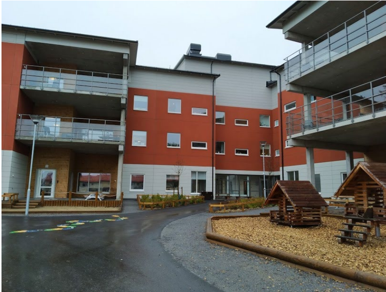
Figur 10. Vård- och omsorgsboendet har balkonger ut mot förskolegården.

för gemenskap och utbyten där de äldre till exempel kan berätta om vad de planterade när de var yngre.