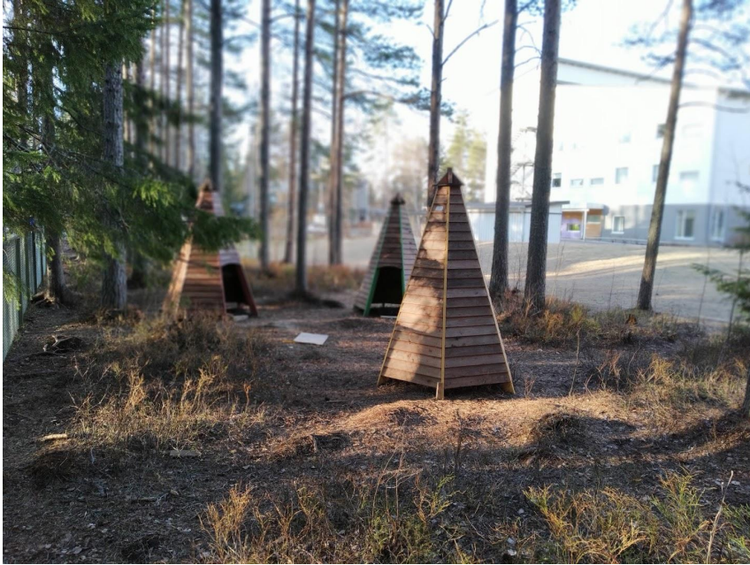
Figur 14. Skogsremsa med kojor.