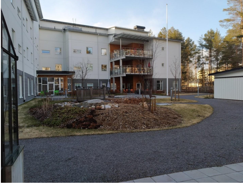
Figur 17. På vård- och omsorgsboendets utemiljö finns fontän och planteringar.