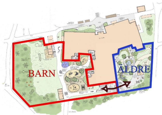
Figur 13. Utemiljöns uppdelning mellan stora och små barn på förskolan samt de äldre på vård- och omsorgsboendet. Pilen visar var det finns en grind mellan gårdarna som möjliggör för rörelse och möten mellan grupperna.