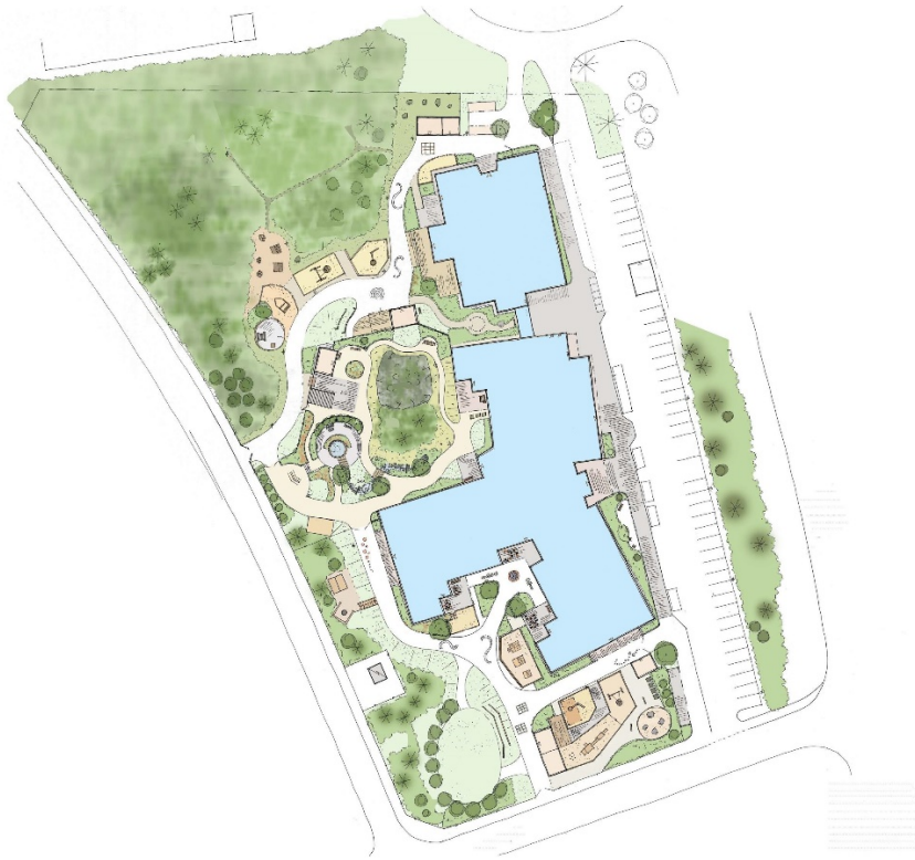
Figur 2. Ungefärlig situationsplan över Lundagårds utemiljö.