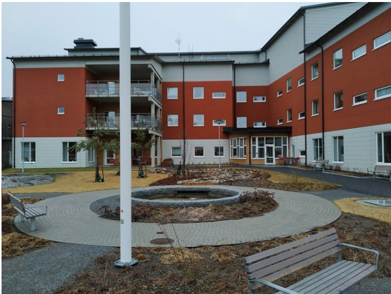
Figur 8. I vård- och omsorgsboendets utemiljö finns fontän och bänkar.

Den mittersta gården i samverkanshusets utemiljö tillhör vård- och omsorgsboendet och innehåller en fontän, har till största del jämna ytor, små slingrande vägar som är lämpliga för promenader, balansgång med stöd för rehabiliteringsträning och flera bänkar. Vegetationen är sparsam på de äldres gård och eftersom utemiljön är relativt nyanlagd har många av de planterade växterna inte riktigt etablerat sig ännu vilket gör att utrymmet upplevs som öppet.