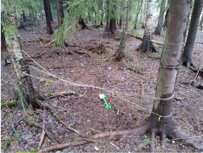
Figur 7. Förskolans skog ger möjlighet till utforskande lek.

Den mittersta gården i samverkanshusets utemiljö tillhör vård- och omsorgsboendet och innehåller en fontän, har till största del jämna ytor, små slingrande vägar som är lämpliga för promenader, balansgång med stöd för rehabiliteringsträning och flera bänkar. Vegetationen är sparsam på de äldres gård och eftersom utemiljön är relativt nyanlagd har många av de planterade växterna inte riktigt etablerat sig ännu vilket gör att utrymmet upplevs som öppet.