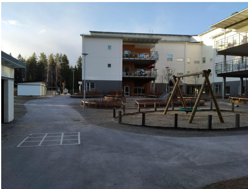
Figur 16. Barnen har tillgång till tillverkad lekutrustning. De äldre har balkonger som vetter ut mot förskolans utemiljö.

Vård- och omsorgsboendets del av utemiljön skiljer sig från barnens på flera sätt. Den är till att börja med mindre än barnens och innehåller en fontän som de äldre kan promenera runt eller sitta vid. Det finns också planteringar, rabatter och utformningar av stenar som kan ge de äldre något vackert att betrakta. På gården finns ett flertal bänkar utplacerade. Bänkarna står både i öppna lägen och lite mer skyddade lägen. Det finns en pergola som de äldre kan sitta under och en del stora tallar och stora stenar har bevarats på gården. Hela verksamhetens utemiljö är belägen i ett bostadsområde och angränsar till mycket skog som är väl synlig från utemiljöns alla delar. Korta promenadslingor finns över hela området och utemiljön rymmer också utrustning för balansövning där de äldre kan utöva rehabiliteringsträning.