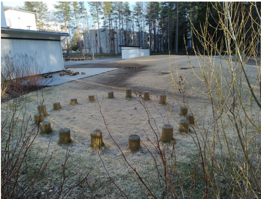
Figur 15. Cirkel med stubbar, lösa stubbar för lek och en kulle med en trappa.