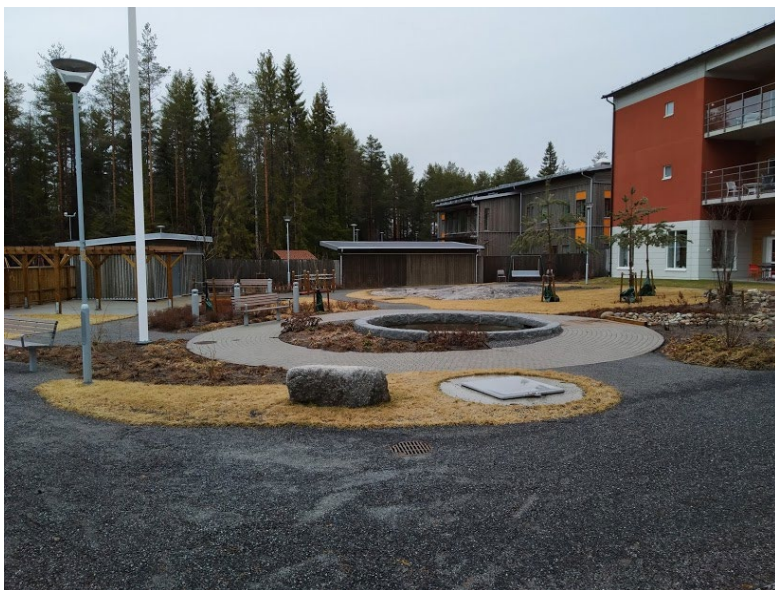
Figur 9. I vård- och omsorgsboendets utemiljö finns promenadstråk.

Det finns stora skillnader mellan barnens utemiljöer och de äldres utemiljö, enligt den intervjuade förskolläraren och enligt analyser under platsbesök. 4 Det finns en skillnad i hur miljöerna är uppbyggda och till exempel hur växterna har planterats. De äldres utemiljö har jämnare markytor och utrustning för rehabiliteringsträning medan barnen har en utemiljö med större höjdskillnader och skog. Utemiljöerna upplevs ha anpassats utifrån barns och äldres olika behov.