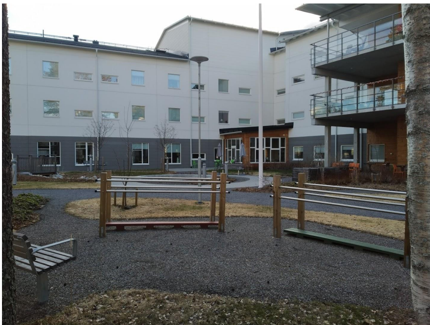
Figur 19. Utrustning för balansövning och promenadslingor.