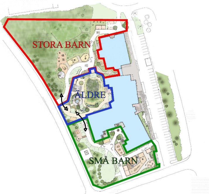
Figur 3. Utemiljöns uppdelning mellan stora och små barn på förskolan samt de äldre på vård- och omsorgsboendet. Pilarna visar var grindar finns mellan gårdarna som möjliggör för rörelse och möten mellan grupperna.