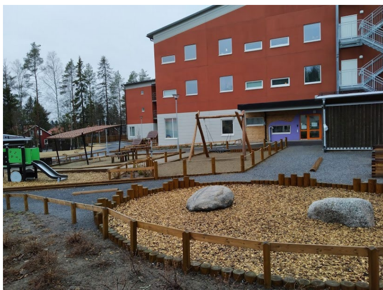
Figur 4. Tillverkad lekutrustning.

De större barnen har en stor andel skog på sin gård. I skogen kan barnen leka bland träd, rötter och stenar och öva på sin motorik och balans. Barnen har också tillgång till tillverkade lekredskap som gungställning, båt och stugor. Intervjupersonen berättar att de mindre barnen brukar gå över till de större barnens gård ibland för att få leka i den större skogen. 3