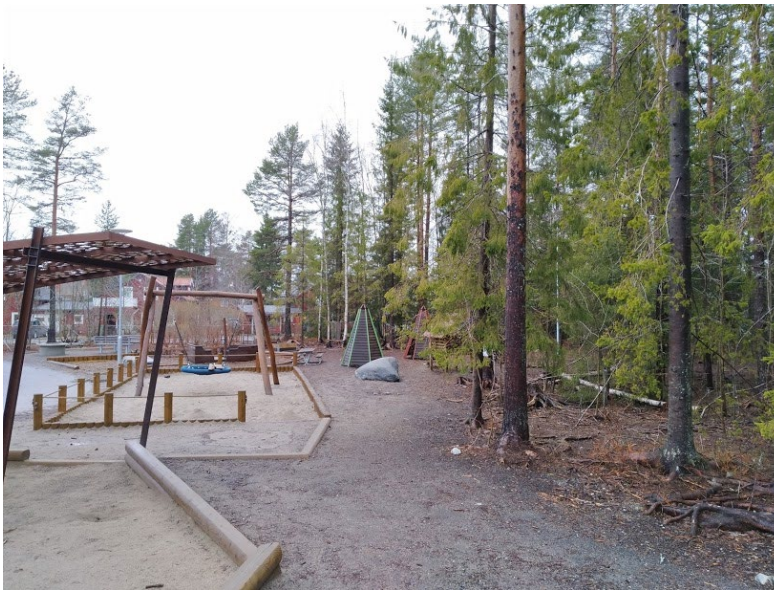
Figur 6. Den tillverkade lekutrustningen möter skogen.