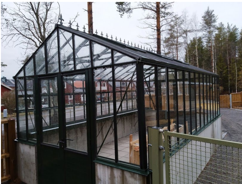
Figur 11. Gemensamt växthus.