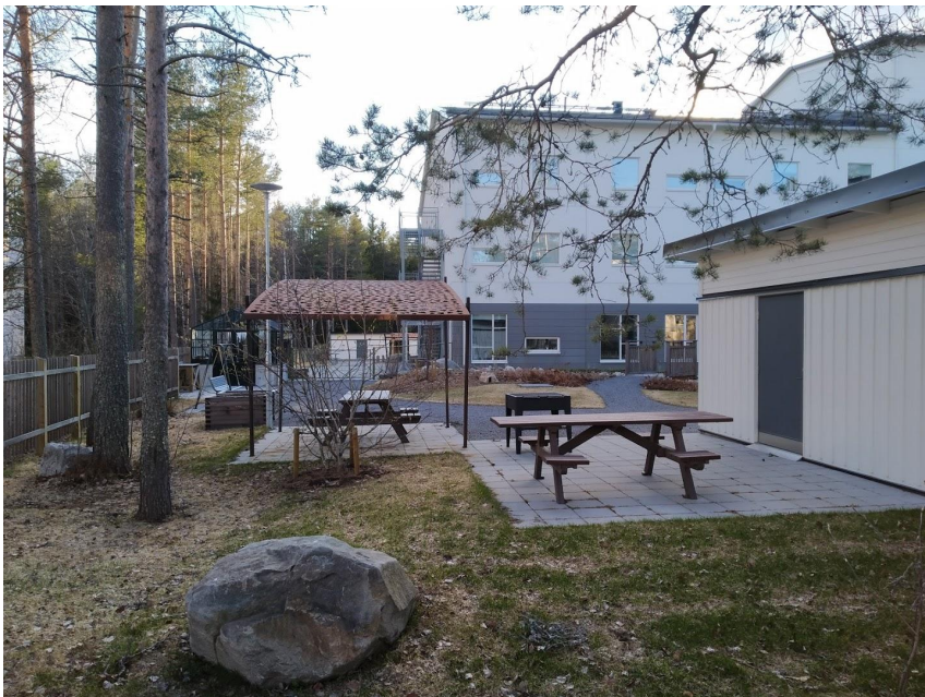
Figur 18. Bänkar står placerade på ett flertal ställen på gården och träd och skogsmiljö är närvarande.