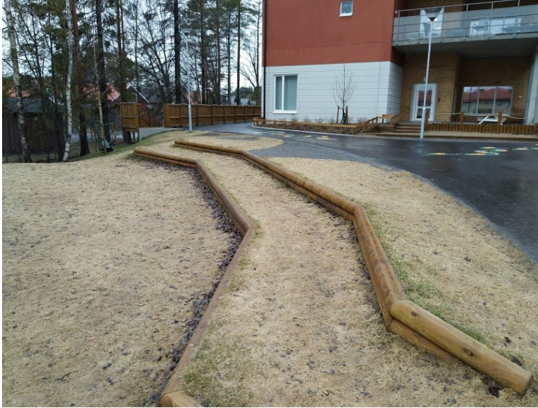
Figur 5. Trappa byggd i gräsmattan för möten och lek.