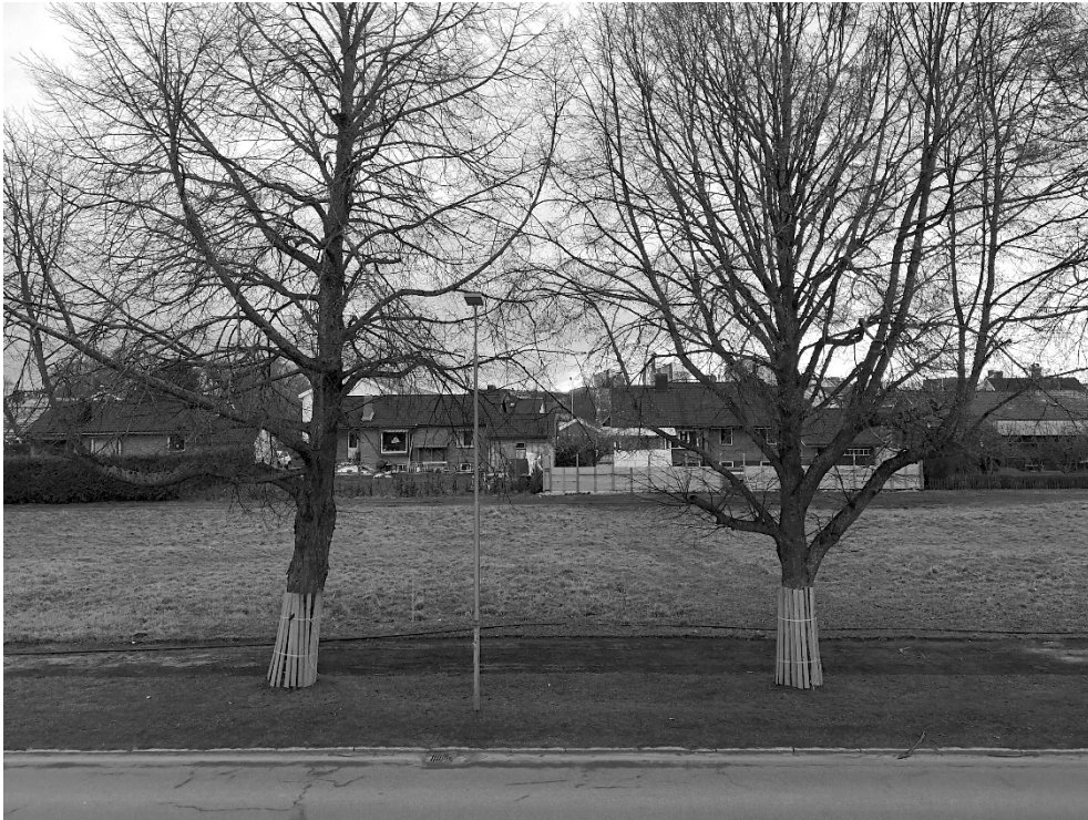
Figur 8. Foto taget från platsen där modulbostäderna låg. På andra sidan, bakom träd och staket skymtar boendets enda grannar. Bristen på "eyes on the street" vända mot Fiskebyvägen bidrar till att platsen känns otrygg kvällstid.

Vad gäller trygghet – såväl faktisk som upplevd – är områdets förutsättningar mindre positiva. Jane Jacobs myntade begreppet "eyes on the street" och beskrev det som att: