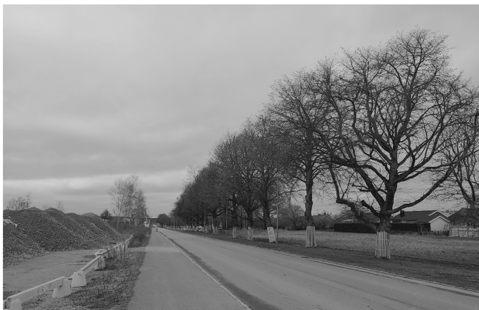
Figur 2. Grushögarna till vänster i bild utgjorde tidigare markunderlag för modulbostäderna. Allén och grönområdet, till höger i bild, utgör en tydlig fysisk och symbolisk gräns: här slutar Pryssgården. Foto: Oskar Persson, 20-02-20

Ungefär 100 meter öster om Fiskeby 1:48 korsar Fiskebyvägen Finspångsvägen, en tvåfilig 70-väg kantad med fabrikslokaler längs med den södra sidan och blandad bostadsbebyggelse på norra. Vägen leder in mot centrala Norrköping, är vältrafikerad och har en busstrafik som är något oregelbunden och avgår mellan var och varannan timma. Närmsta busshållplats ligger cirka 500 meter bort, vid Eneby centrum. Där finns även en spårvagnshållplats. På var sida om Finspångsvägen finns cykelvägar som – kanske beroende på avsaknad av vindskydd – används förhållandevis lite.