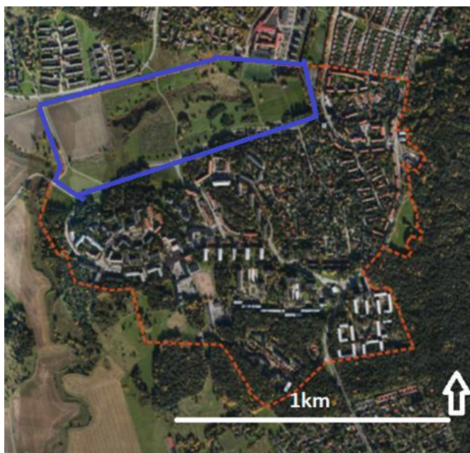
Figur 2: visar det nuvarande läget i programområdet samt den uppskattade grönstrukturen som riskerar försvinna vid förtätningen. Eriksberg och Ekebydalen är inramat i rött. Den blåmarkerade delen är Ekebydalen som ej kommer att förtätas.

Kommunen har vidtagit flera åtgärder för att inkludera olika grupper i processen vilket är positivt då detta skapar möjlighet för de boende att påverka sin omgivning. Materialet användes sedan som underlag för deras fortsatta arbete enligt planen. Det framgår dock inte hur detta material tas vidare och om dessa röster som hördes under exempelvis samrådsredogörelsen verkligen påverkar processen.