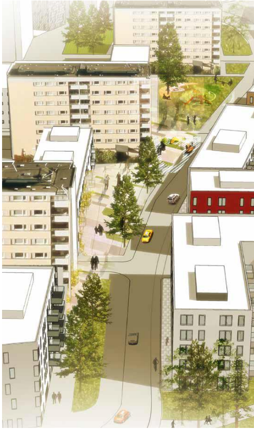
Figur 4: en illustrationsbild som visar den tänkta nybyggnationen i Eriksberg.