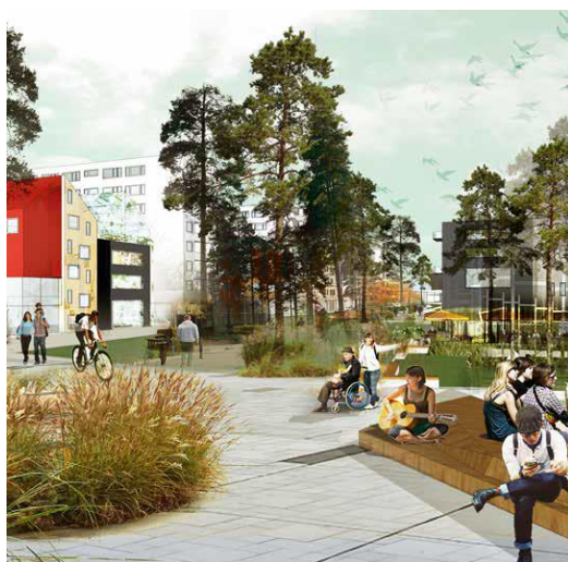
Figur 5: en illustrationsbild som visar det allmänna mötesrummet i staden med utveckling av befintliga torg och parker. Bild hämtad från Planprogrammet för Eriksberg och Ekebydalen 2017, Uppsala Kommun.

Engagera de boende på området i hållbarhetsfrågor för att stärka den sociala anknytningen i samhället bland individerna och även till omgivningen för att skapa acceptans till förändringar och förbättringar, med inriktning mot ett hållbart samhälle.