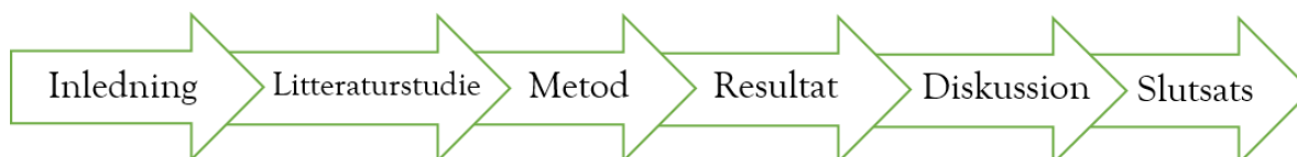
Figur 1. Uppsatsens struktur (egen bearbetning)

För att läsaren ska få en överblick över uppsatsen presenteras uppsatsens struktur i figur 1 nedan. I inledningen ges en bakgrund till uppsatsens valda ämne, där följer sedan en formulering av problemet som mynnar ut i syfte och frågeställningar för uppsatsen. I litteraturstudien presenteras den litteratur och teori som har använts för att analysera materialet. Därefter presenteras den metod som har använts i uppsatsen och ger läsaren en inblick i tillvägagångssätt, urval, analysmetod och diskussion. Slutligen följer resultat, diskussion och slutsats. I resultatet kommer det datamaterial som samlats in presenteras. I diskussionen kommer datamaterialet att analyseras för att sedan sammanfattas i slutsatsen.