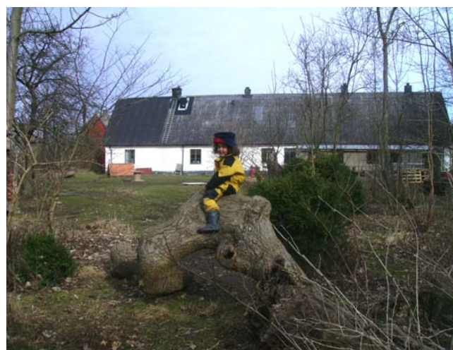
Fig.18 Jag kan klättra upp