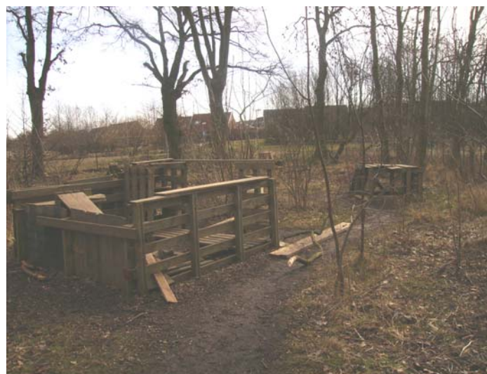
Fig. 10 Riddarborg och polishus, vem vill vara fångslad här?