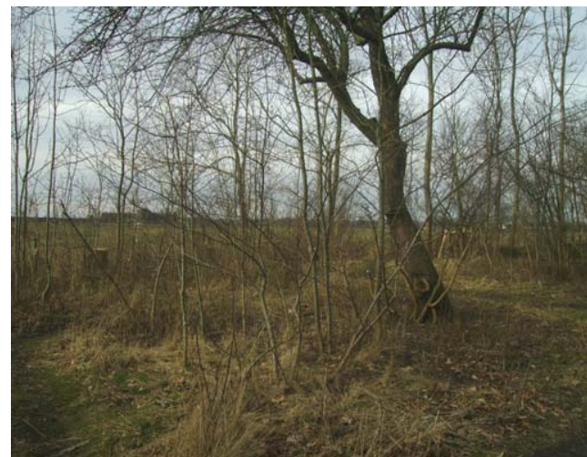
Fig. 4 Platser uppstår, andra förfaller