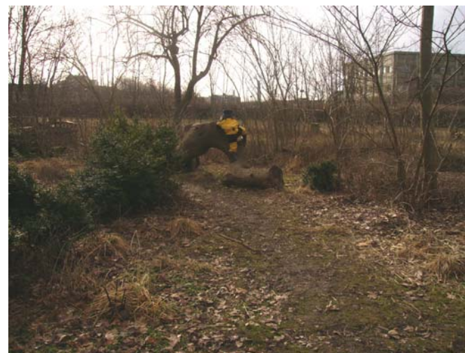
Fig. 16 Jag kan klättra