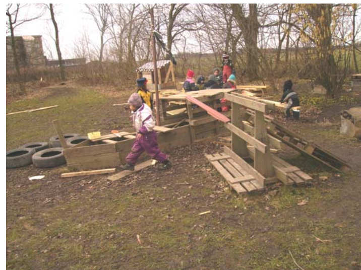
Fig. 13 Förskolepedagog omringar av intresserade barn.

De stora gamla träden som syns i figur fjorton hyser boplats åt råkor och kråkor. Fåglarna ingår i barnens verksamhet då de får matrester, bröd eller städar upp efter tappad mat. Många barn iakttar fåglarnas rörelsemönster och sociala förhållningssätt gentemot varandra, vidare tycker barn om att studera fåglar hur de kämpar med att samla kvistar och bygga bo och ibland begraver barnen nedfallna fågelungar. De stora träden inger trygghet, hälsa, må bra känsla vilket även vetenskapliga studier visat på.