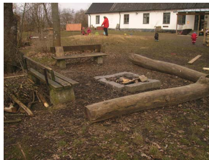
Fig. 12 Periodvis eldas det dagligen.