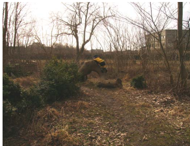
Fig. 17 Jag kan klättra

En uteförskola, som Vinden, med en varierande utformning av utemiljön, tillåter barn, oavsett ålder och mognad, finner lämpliga objekt att pröva sina förmågor. Där är platsen stor och där kan barn leka utan att behöva störa eller avbryta varandras lekar. Här får barn utvecklas i en lagom ljudnivå med god tillgång till dagsljus varje dag. På sommaren får barn på uteförskolan Vinden tillgång till halvskuggiga områden, under alla träd och buskar som finns på tomten och där kan barn leka eller vistas och minskar därmed risken att bränna sig.