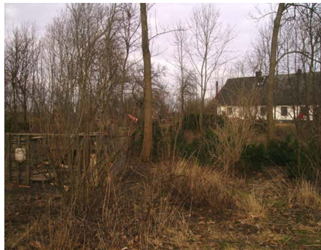
Fig.2 Rum för spänning, och enskildhet.