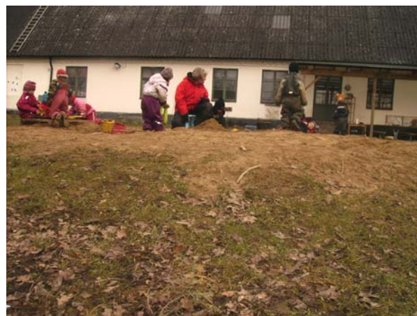
Fig.8 Ojämn mark i naturen.