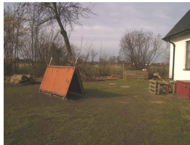
Fig.11 Mångfunktionellt staffli stimulerar till olika lekar.

Eldstaden som visas i figur tolv används näst intill dagligen på uteförskolan Vinden och bakom vänster bänk finns ved som barn och förskolepedagog samlat ihop. Runt eldstaden hålls det många gånger spontan samling och det poppas alltid popcorn över öppna elden vid födelsedagar. På elden kokas även nyskördad nässelsoppa på våren, då sitter barnen runt eldstaden på stockarna och äter ur sina kåsor. På hösten grillas egen skörd av äppleskivor och squash.