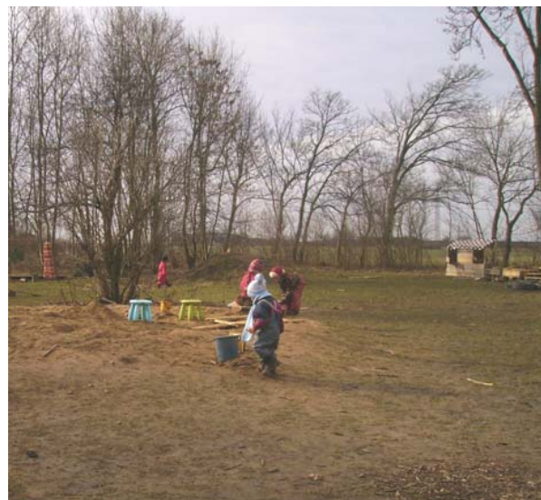
Fig.7 Inga tydliga gränser, allt har ett samband.

Vid sandleverans får sanden utformning av en kulle, för att successivt utjämnas med omgivningen. På uteförskolan finns inga regler att sanden måste stanna i sandhögen, där finns inga gränser utan allt har ett samband och barns kreativitet stimuleras. Figur åtta visar på aktiviteter som kan fortskrida bredvid varandra i sanden. Sanden används ideligen varje dag och många avancerade bak och maträtter går tillagas. Framåt vårkanten brukar sandhögen successivt omvandlas till en sandgrop och under sommaren kan barnen få dela sandgropen med myror. Även enorma komplexa vattenkonstruktioner kan få komma till stånd i sandgropen och som förskolepedagogen sa ”jag vet inte vem det är som har roligast, jag eller barnen”. Den ojämna strukturen i naturen blir ypperligt underlag för de minsta att träna motorik på.