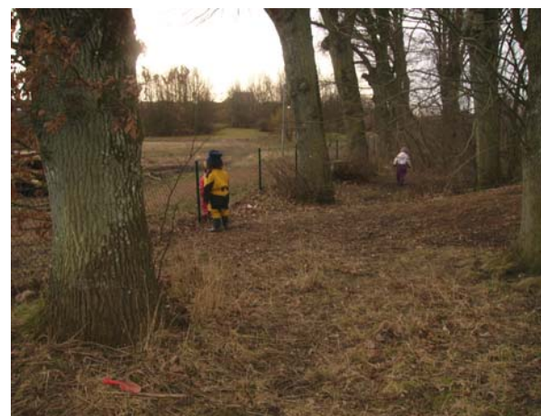
Fig. 14 Stora träd är bra boplats för råkor och kråkor.