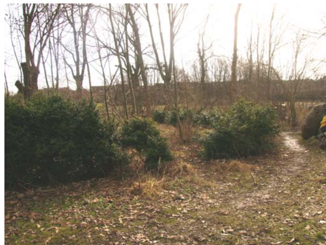
Fig.1 Landskap som lockar till lek.

Figur ett visar växlighetskaraktären på uteförskolans mellanzon, det vill säga inte öppet och inte slutet. Figur två visar hur uteförskoletomten sluter sig längre bort från förskolebyggnaden barnet är. Barnet kan söka sig till denna miljö då det är mogna för större utmaningar, här har inte längre förskolepedagogerna barnen under full uppsikt, utan barnet lär sig förlita till sig själv eller på sina kamrater.