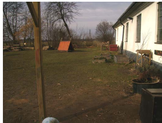
Fig.5 Planterings lådor intill förskolebyggnaden.

Utifrån miljön i figur sex kan barns fantasier flöda fritt, till exempel av hur katten sitter och spanar efter sork eller möss. Barn är medvetet om sin omgivning och låter omgivningen få ta stor roll i deras aktivitet och miljö. Fågelhuset i anslutning till komposthögen sköts delvis om av barnen som lägger dit bröd och fågelfröer