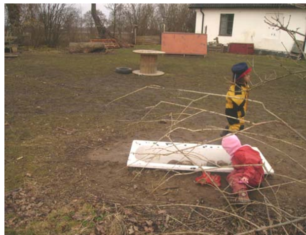
Fig. 9 Nedgrävt badkar med vatten.

Figur tio visar resultat av barns lek som förskolepedagoger spunnit vidare på och utvecklat till tema, de försöker alltid planera utifrån barns lek i landskapet för att på passande plats bygga konstruktioner som figur tio visar. Här ser vi riddarborg närmast och polishus längre bak. Konstruktionerna är placerade i vilda delen på tomten (se Bilaga 1) och upplevelsen av att det är stora barn som bestämmer här är stark. En tomt som är anpassad till alla åldrar är bra för alla barn. Den vilda delen av tomten kan förskolepedagoger inte se tydligt från den öppna zonen intill förskolebyggnaden och jag kan förstå att barnet kan uppleva fångslad här och att det finns behov av en borg att skydda sig i.