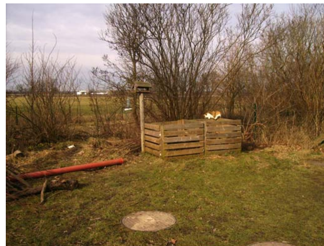
Fig.6 Katten spanar vid komposthögen.