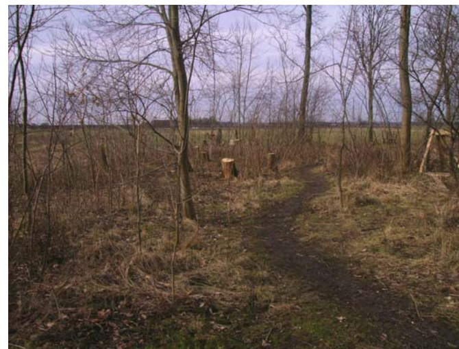
Fig.3 Slingrande gångar uppmuntrar .

Figur tre och figur fyra delger uppfattning om hur området längst bort från förskolebyggnaden är utformad. Här går barn och pedagoger, antingen enskilt eller tillsammans och samlar ved till eldstaden. Något som fascinerar mig i denna miljö är att det stundvis är knäppt tyst för att i nästa sekund höra höga ljud av skratt, gråt eller skrik av spänning, förtjusning eller förskräckelse. I denna miljö finns kreativitet och upptäckarglädjen stimuleras. Figur fyra kan vara en plats som under sommaren är helt täckt med brännässlor och går därför inte alls att använda då eller så kan det vara en plats som under sommarhalvåret ger en behaglig skuggig miljö att studera hasselmöss på.