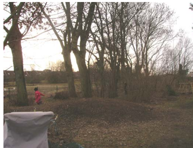
Fig. 15 Topografisk variation stimulerar

På uteförskolan Vinden skapar barn egna platser. Figur sexton visar bevarandet av nedsågad stock, den har tagits tillvara bland annat för den biologisk mångfalden men även för att berika tomtens utformning. Det har lett till att gamla stockar och stubbar tilldelats olika funktioner och objekt utifrån barnets egna fantasier. En uteförskoletomt som är utformad för att sporra barnets till att kämpa, utmana och undersöka tyder på att förskoletomten får en viktig roll i barnets vardagsmiljö