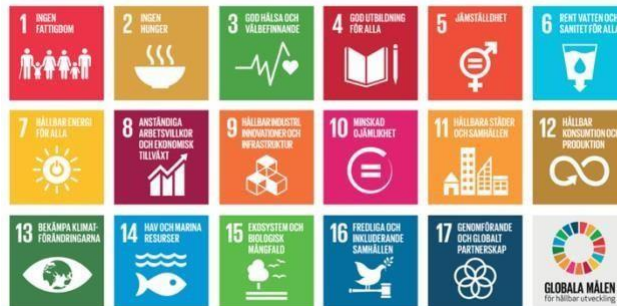
Figur 1. De globala målen som utgör Agenda 2030 och som antagits av FN:s medlemsländer för en hållbar utveckling. Mål 6, 15, och 15 hanteras inom vattenförvaltningen (UNDP 2019).

beroende av en integrerad förvaltning och engagemang från hela samhället. I svensk förvaltning av vatten är det främst mål 6 (Rent vatten och sanitet för alla), 14 (Hav och marina resurser) och 15 (Ekosystem och biologisk mångfald) som hanteras inom vattenförvaltningen (HaV 2019).