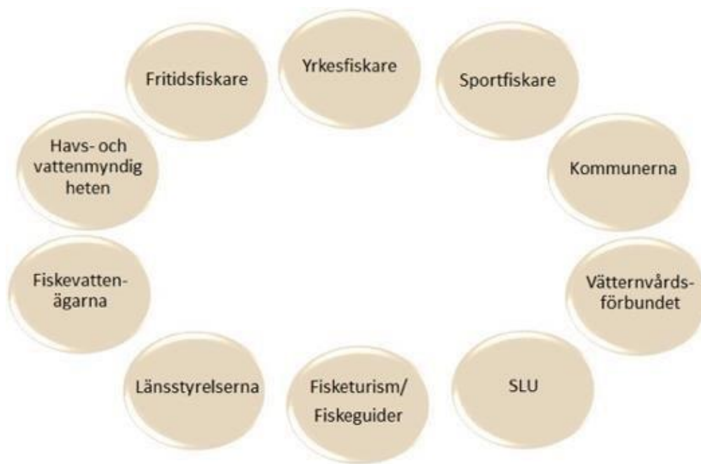
Figur 2. De intressenter av fisk och fiske, forskare och myndigheter som är kopplade till Vättern och som ingår i Fiske (Samförvaltning Vätternvårdsförbundet 2017, s. 13). SLU: Sveriges lantbruksuniversitet.

Samförvaltningen syftar till att öka förståelse och ansvarstagande mellan alla berörda aktörer. Det är en plattform för dialog, en funktionell länk vilket bidrar till snabbare processer – samförvaltningen utgör därmed en viktig nyckel för adaptiv förvaltning. De intressenter avseende fisk och fiske, forskare och myndigheter som är kopplade till Vättern ingår i Samförvaltningen och utöver detta är de också indelade i arbetsgrupper med olika uppdrag och ansvarsområden. Samförvaltningen är ett rådgivande organ och det är myndigheterna som fattar de slutgiltiga besluten.