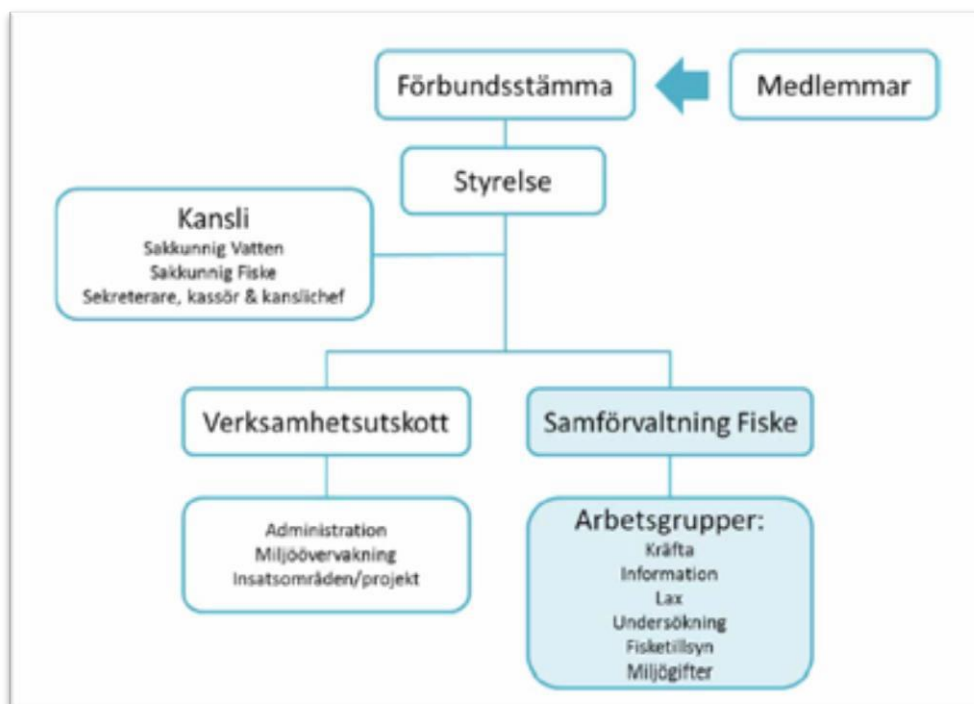
Figur 3. Vätternvårdsförbundets organisation där Samförvaltning Fiske är blåmarkerat (Vätternvårdsförbundet 2017, s. 13).