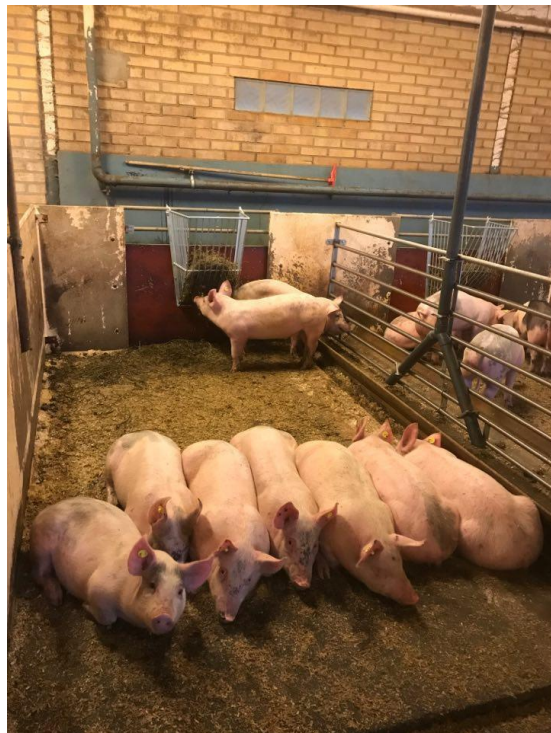
Figur 2. Översiktsbild slaktsvinsbox