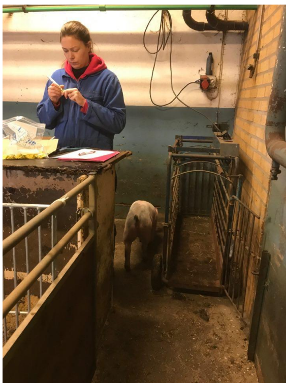
Figur 3: Vägning av grisar