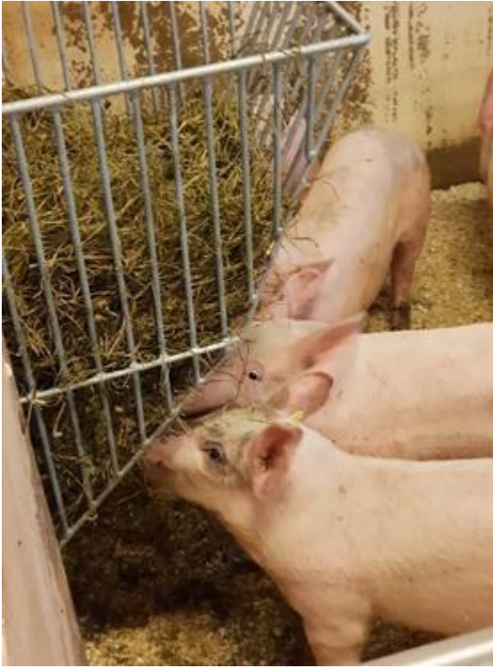
Figur 1. Foderhäck