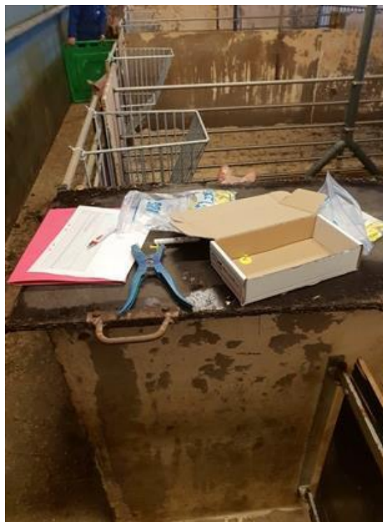
Figur 4: Öronmärkning

Vid insättning dokumenterades grisarnas vikt separat utav oss och när försöket avslutades dokumenterades den av Bollerups förman. Se bilaga 1. Ett veckoschema placerades i anslutning till varje box där all data kunde dokumenteras. Se bilaga 2. Här fanns en bedömningsskala för bitskadorna på grisarna. Se tabell 1. Det fanns även ett övrigt utrymme där annan viktig information kunde dokumenteras. Övriga skador som dokumenterades i studien var grisar med beteenden som påverkade gruppen. Det har även dokumenterats vilken typ av skador grisarna hade.