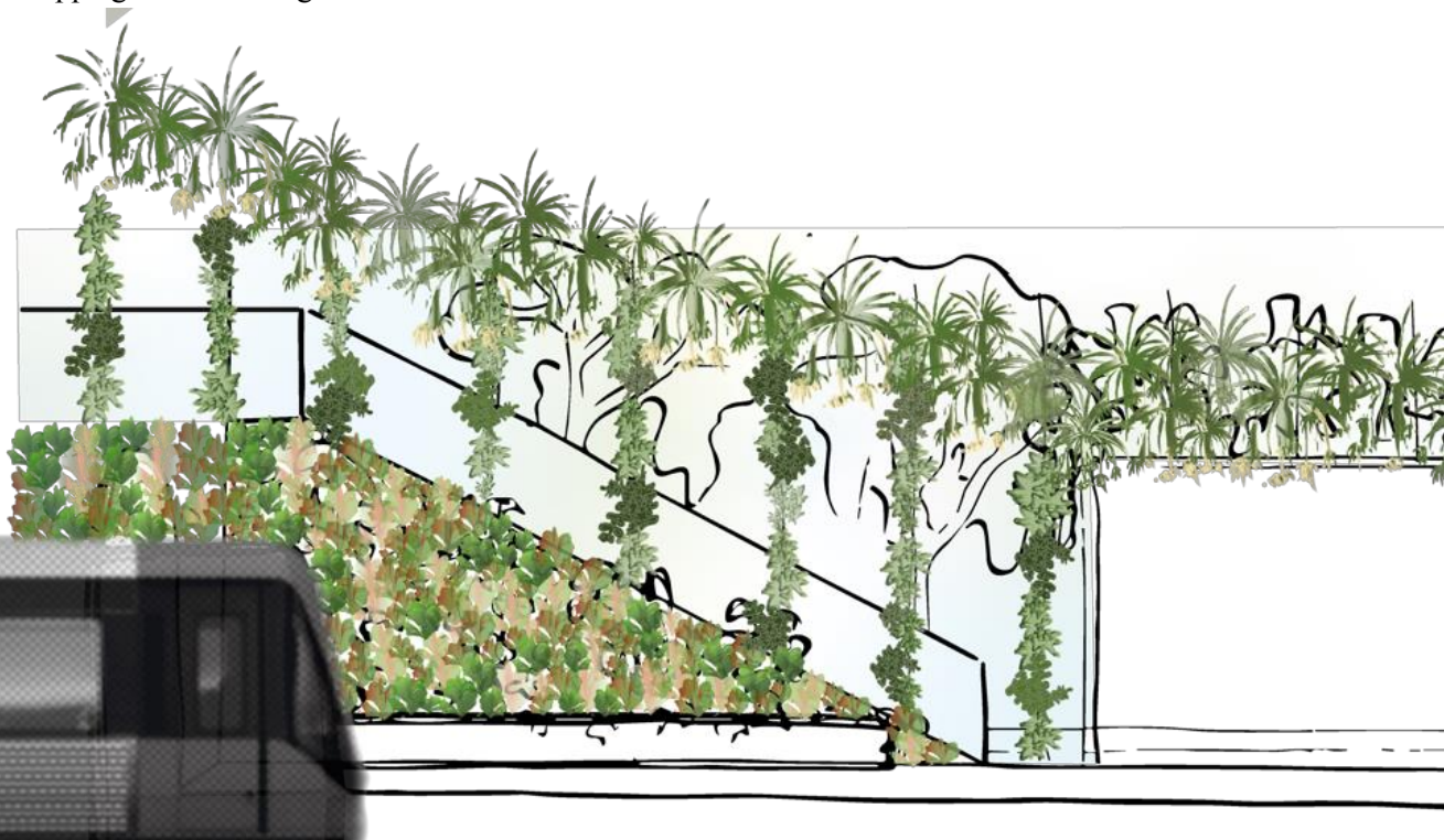
Figur 2 – Perrong. Små, suckulenta xerofyter massplanteras till en effektfull växtvägg. De tar upp minimalt med volym och är resurssnåla. Epifyter bidrar till vägledning och inramning. De befinner sig i suspension och drar nytta av en viss mängd ljus genom ljusbrunnarna, och bör vara anslutna till en bevattningskälla. Genom glasrutorna behålls översikten över entréns utemiljö.

Öka platsens orienterbarhet. Växtgestaltningen förbättrar orienteringsförmågan genom att utgångar ramas in av epifyter i suspension och leder sedan ögat i en uppåtgående riktning.