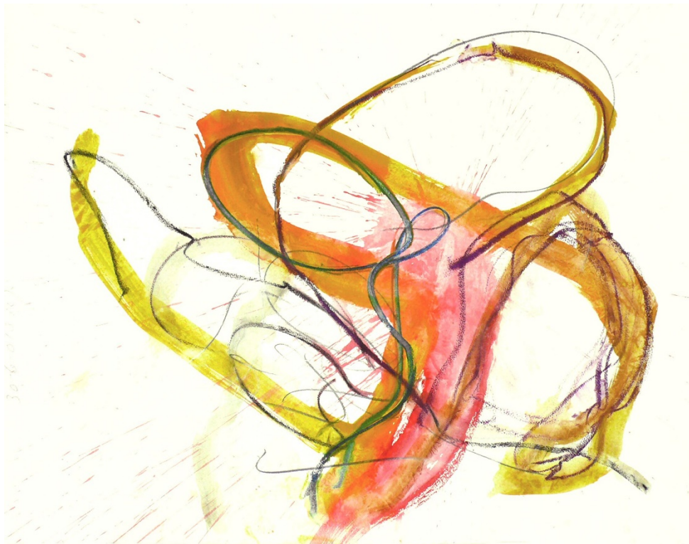
Figur 1: Splot av Fons Heijnsbroek (CC-BY)