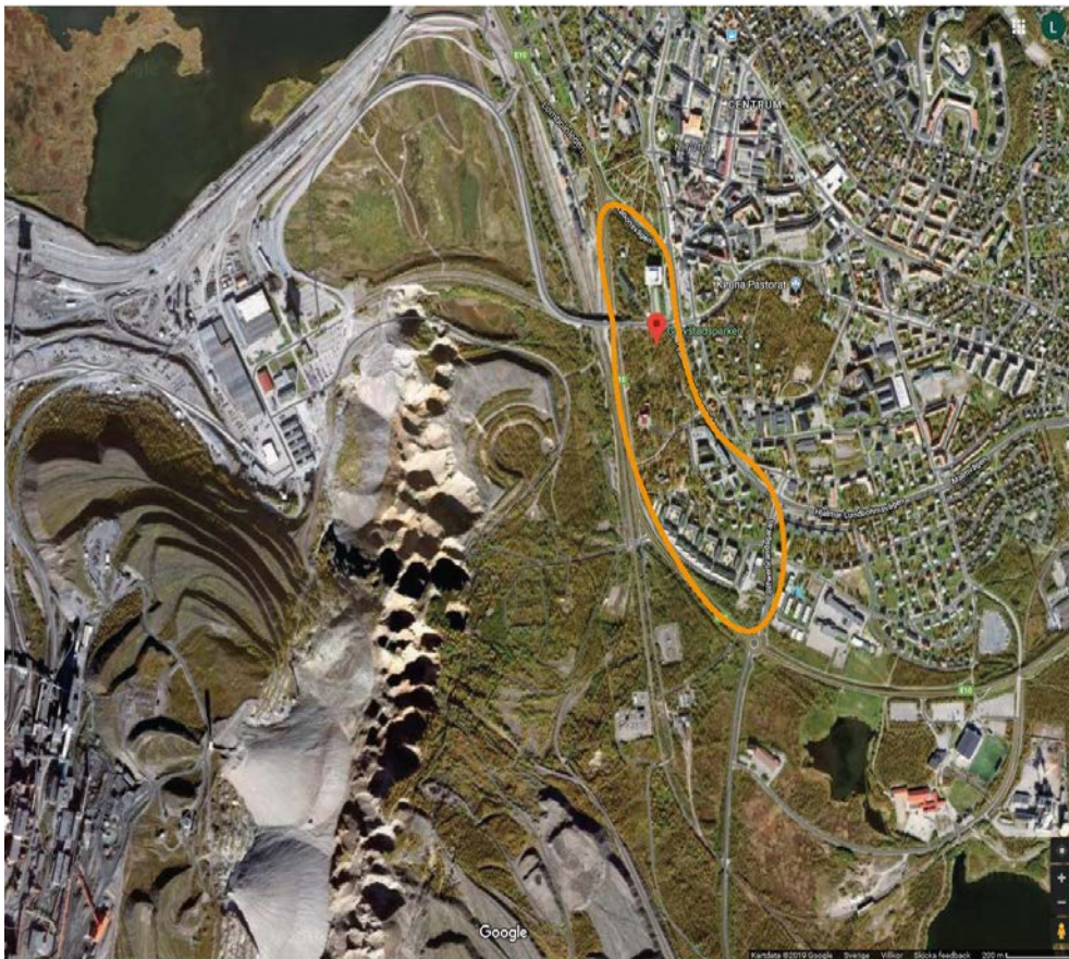
Figur 2: Gruvstadsparken Kiruna.

När kommunen bestämt sig för att ta emot LKABs erbjudande började diskussioner om en stadspark mellan gruvan och staden enligt Orrje & Lindholm (2013). Under ledning av Statens konstråds representant Peter Lundström bildades en projektgrupp 2010. Redan tidigt under projektets gång betonades vikten av god arkitektur och konst. En tävling och tre intresseanmälningar annonserades ut till konstnärer och arkitekter i landet. Intresset visade sig vara stort och totalt 122 bidrag skickades in till projektgruppen för att analyseras. De ansvariga ville få ett förslag på hur en presentation av gränsen mellan park och gruva kunde se ut. Sedan ville de ha tre förslag på hur gestaltningen i Gruvstadsparken kunde se ut utifrån tre teman (Orrje & Lindholm 2013).