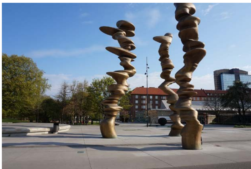
Figur 5: Points of view.

Det första offentliga rummet som besöktes var Konsthallstorget i närheten av tågstationen Triangeln. På det lågmälda torget finns konstverket Points of view som tillkom 2017. Det består av tre stycken tolv meter höga dansande bronsskulpturer. Varje pelare väger runt tio ton och är det största offentliga konstverket som Malmö har (Malmö stad 2017). Konstnären Tony Cragg är en brittisk skulptör, en av världens största inom skulptur. Hans storhet ligger i att han hela tiden utmanar gränsen mellan det konstgjorda och naturliga, han använder sig även ofta av återbrukade material (Lisson Gallery u.å).