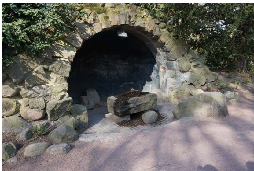
Figur 10: Ormet