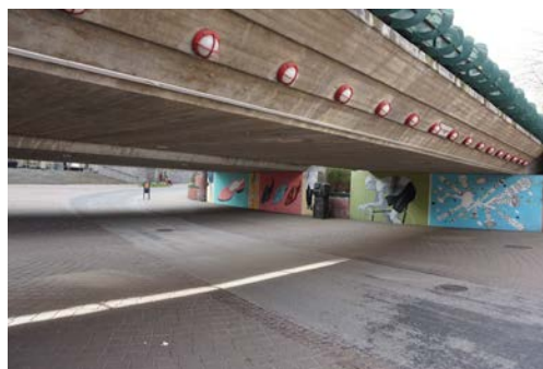
Figur 7: Konstverk av Nicklas Hellberg

Tunneln valdes ut till gaturen for tunnlar ar en del av stadsplaneringen och att det fanns ett varde i att planerare reflekterar over vad som ar en god utformning i en tunnel. De infallsvinklar deltagarna framst diskuterade pa plats var trygghet, rumslighet, osakerhet och konstverket.