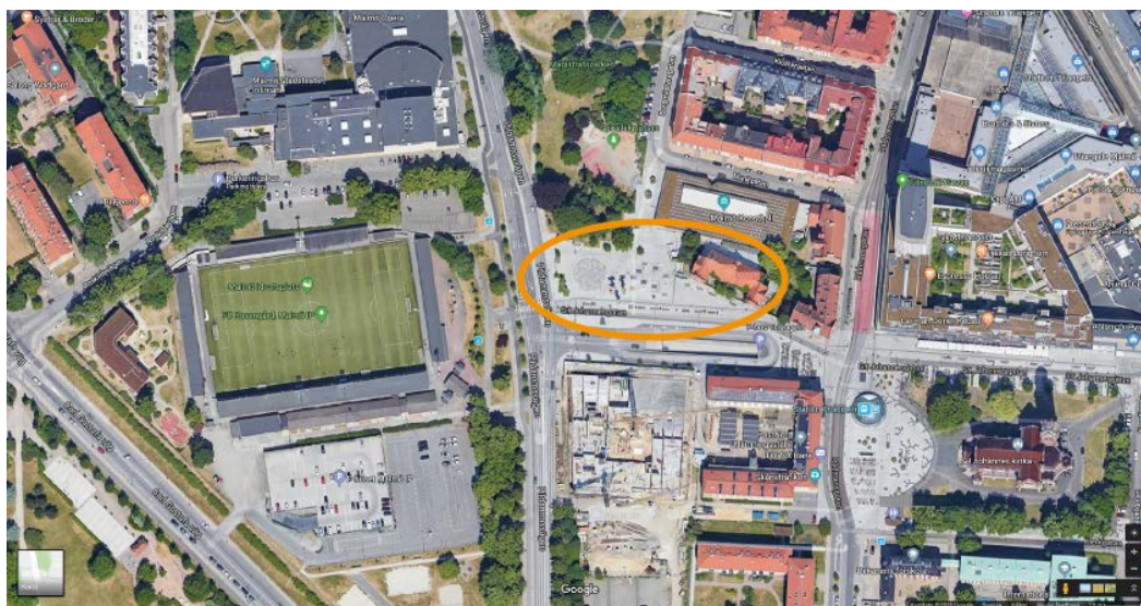
Figur 3: Konsthallstorget Malmö.

Konsthallstorget ligger centralt i Malmö och passeras dagligen av många människor. Torget som är 1000m 2 ligger inklämt mellan olika knutpunkter i staden såsom Triangelns P-hus-nedfart, Magistratparken och Malmö Idrottsplats. Från torget skymtas Malmö Opera och i motsatt riktning skymtas Triangelns tågstation (Malmö stad 2008). Malmö Konsthall som står i torgets hörn är ritat av arkitekten Klas Anselm 1975. Konsthallen har en estetisk och funktionell stil med enkla material som trä, betong, glas och metall. Utställningshallen räknas till Nordeuropas största och har enligt Malmö konsthall (u.å) oändliga möjligheter.