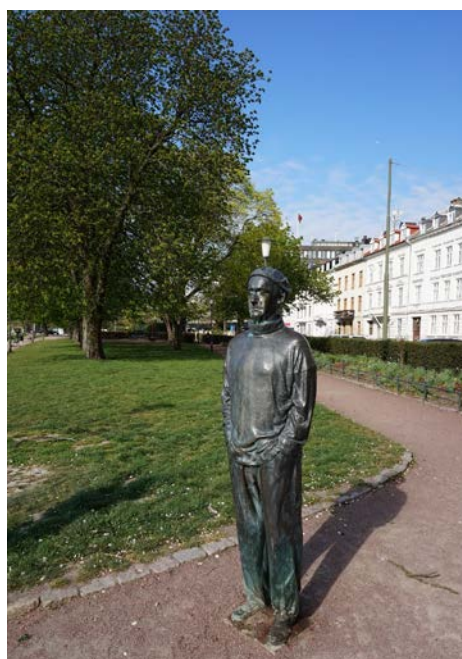
Figur 8: Det svenska tungsinnet

Det svenska tungsinnet valdes ut till gåturen för att statyn tar upp en intressant aspekt, den väcker känslor och kan trösta där den står mitt på gången och gråter, vilket är ovanligt i stadsmiljöer. Det kunde leda till en intressant diskussion hos landskapsarkitektstudenterna. De sex infallsvinklarna som deltagarna främst diskuterade var trygghet, rumslighet, känslor, ljud, placering och estetik.