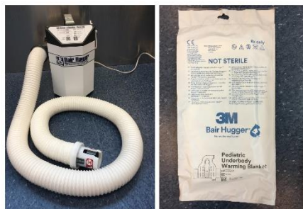
Figur 1 Bair hugger.