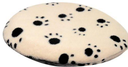
Figur 3 Snugglesafe.