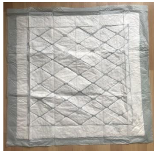
Figur 2 Absorberande hygienskydd.