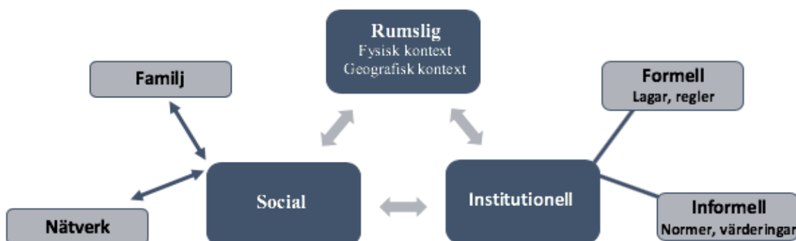
Figur 3. Hur olika nivåer av kontext hänger ihop (baserat på Welter, 2011, egen bearbetning).

För att få en bild av hur komplex kontexten är kan den delas upp i rumslig, institutionell och social kontext (Welter, 2011). Det är olika lager av kontext som alla påverkar entreprenören men de är även kopplade till varandra. I den rumsliga kontexten inkluderas den fysiska omgivningen och den geografiska placeringen (ibid.). Den institutionella är uppdelad i formell (lagar, regler) och informell (normer, värderingar) (ibid.). Slutligen är det den sociala kontexten som inkluderar relationer och kontakter, där är entreprenörens nätverk inräknat (ibid.). För att få en övergripande bild av de olika lager av kontext presenteras de i figur 3.