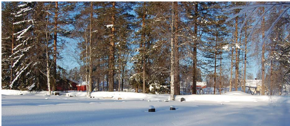
Vegetationen utanför Överklintens begravningsplats

Begravningsplatsen är öppen och har björkar längs insidan av stenvallen. Utefter mittgången går en björkallé som ser nyplanterad ut då träden är små. Eftersom det är vinter och en meter snö kan jag inte se markvegetationen men av erfarenhet vet jag att det är gräsmatta på hela begravningsplatsen. Mellan vissa gravar finns små låga häckar. Dessa häckar bildar med hjälp av gångarna begravningsplatsens kvarter.