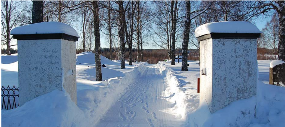
En välkomnande entré på Ånäsets kyrkogård

kategorin är ljud dit jag räknar ljud som ofta åstadkoms av mänskliga aktiviteter t ex buller (Caspersen & Skärbäck, 2006; Nordh, 2006). När jag besökte begravningsplatserna stannade jag upp, blundade och lyssnade efter vilka ljud som fanns omkring mig.