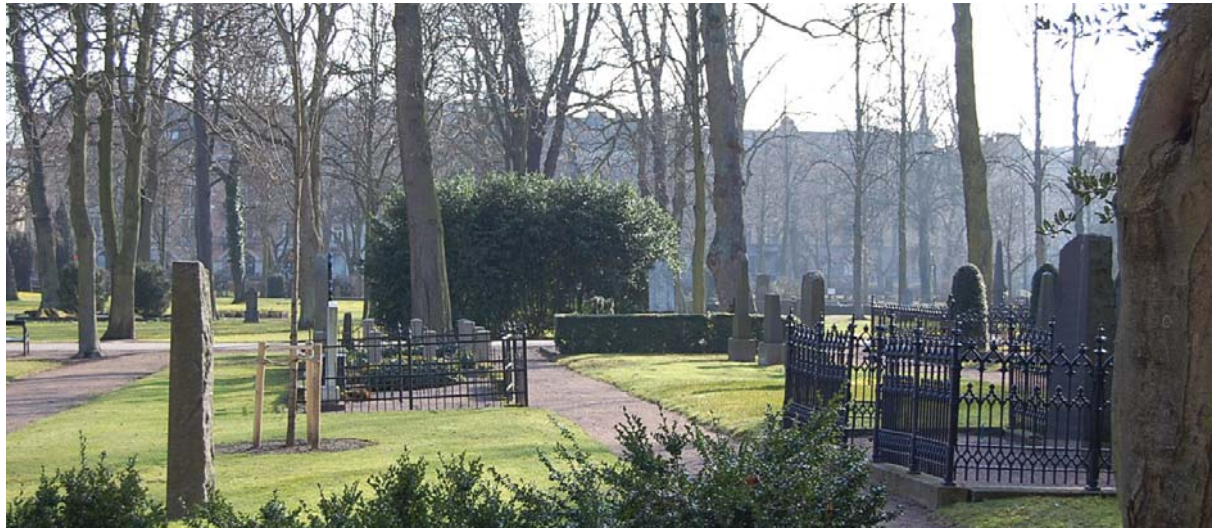
Den variationsrika vegetationen på Gamla kyrkogården i Malmö

Med sin variationsrika växtlighet bildar begravningsplatsen en oas i staden, ett grönt rum. Det finns många små intima rum på platsen, alla med sin egen karaktär och kvalitet.