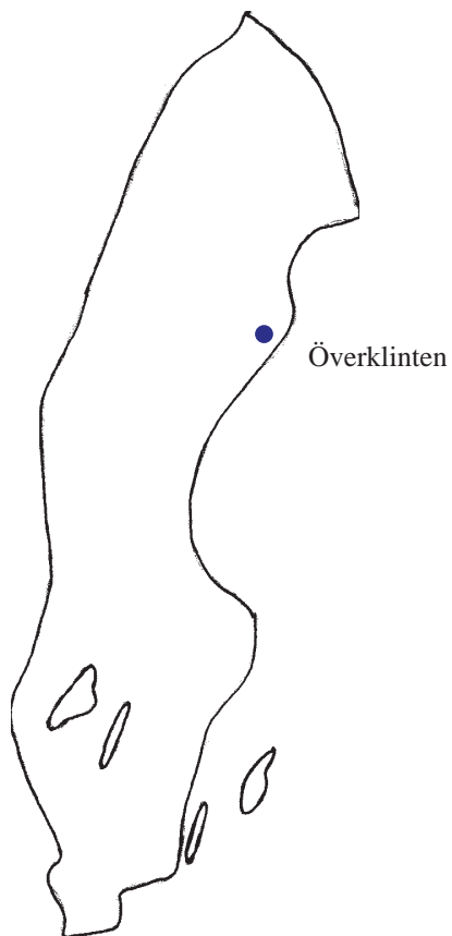
Entré till Överklintens begravningsplats

Vid platsbesöken användes analysmetoden som utformats för ändamålet.