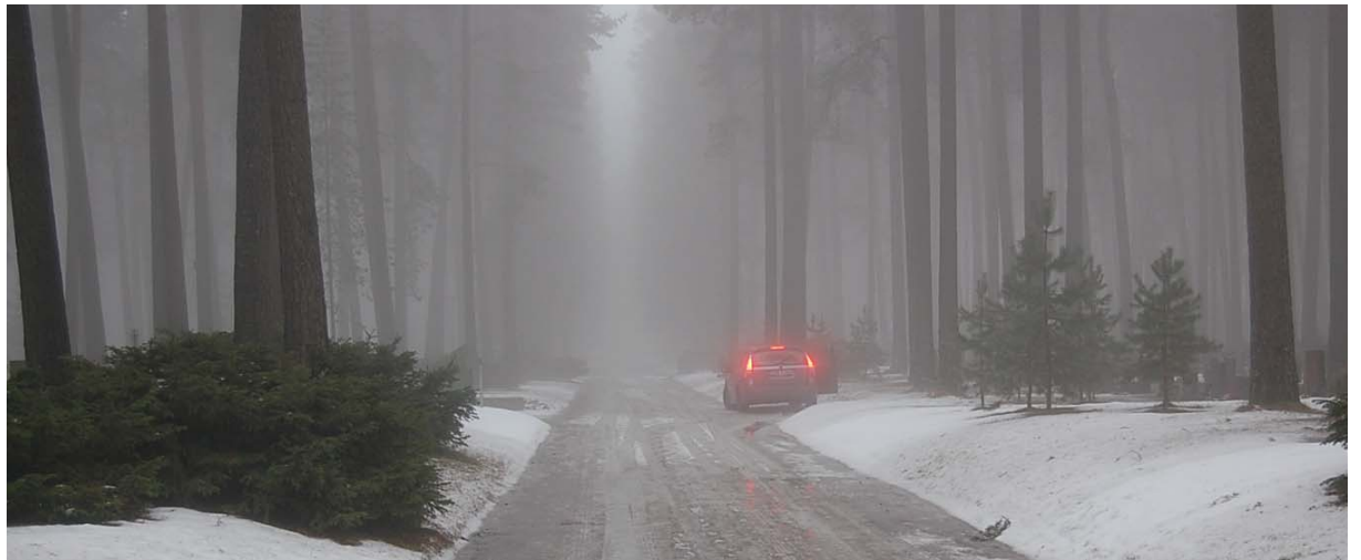
Bil på Skogskyrkogården i Stockholm

Fastän begravningsplatsen ligger i Stockholm så upplevde jag den som lugn, spännande och intim. Jag kände mig inte uttittad någonstans förutom kanske i det stora öppna rummet. Det enda störningsmoment jag upplevde var bilarna som rörde sig runt i området.