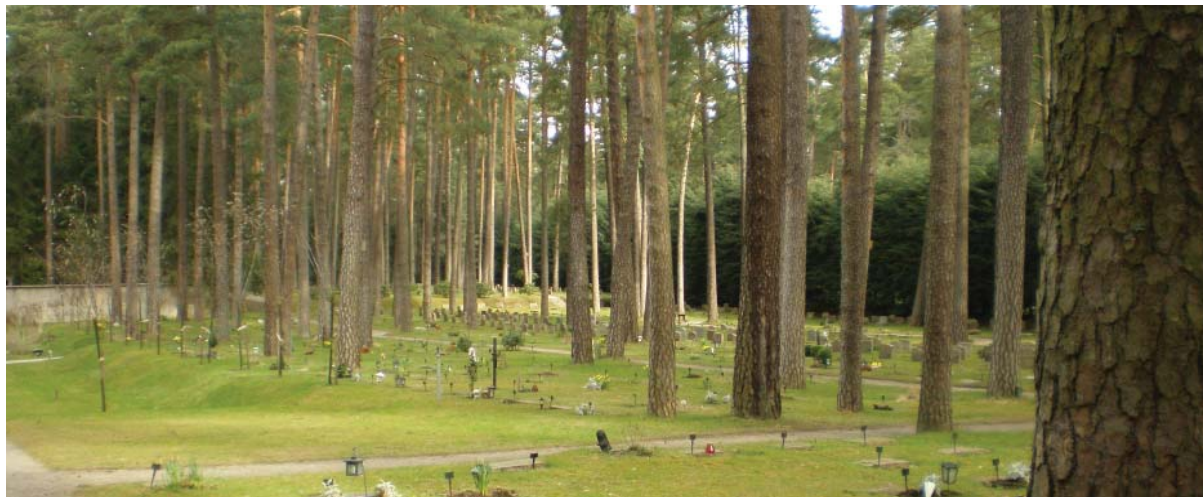
Gravar spridda under en pelarsal av tallar på Skogskyrkogården i Stockholm