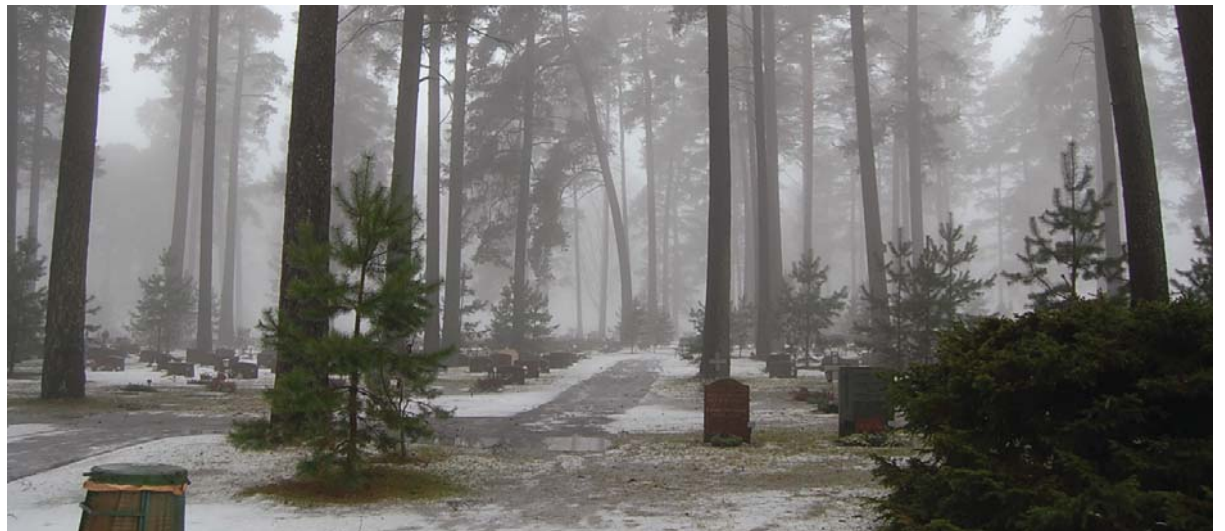
Pelarsal med pågående föryngring på Skogskyrkogården i Stockholm

Vegetationen domineras av höga tallar och granar som bildar storslagna pelarsalar, där gravarna sticker upp mellan träden. Det pågår även en föryngring av träden genom att små tallar växer mellan de stora. Där finns även kvarter där björk är det dominerande trädslaget. Dessa platser är inte lika storslagna utan mer ombonade. Pelarsalarna genomskärs av siktlinjer riktade mot olika kapell. Marken består mest av gräsmatta. På vissa ställen, där det inte är några gravar, har man