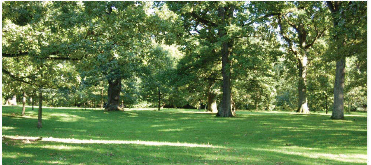
Den rofyllda platsens vegetation i Alnarpsparken

Inom miljöpsykologin beskrivs en rofylld plats som rymlig men med trädridåer som bildar mindre rum. Bland dessa rum finns stora solbelysta gräsytor omgärdade av stora träd. Det finns även mindre rum som avskiljs med trädstammar och små buskage (Grahn, 1991).