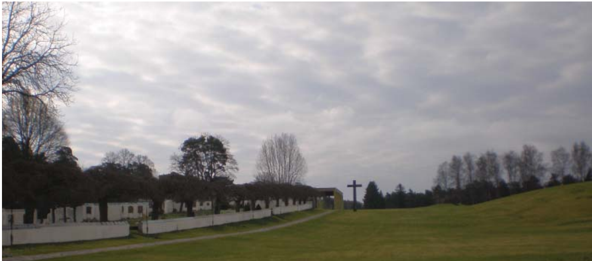
Det stora öppna rummet innanför entrén till Skogskyrkogården i Stockholm

När man kommer in på begravningsplatsen möts man av ett stort öppet rum med golv av gräs. Här kunde jag känna kontakten med himlen och nyfikenheten väcktes att gå vidare. Efter det stora rummet kom jag till pelarsalarna. De avgränsas av gångar och vägar som bildar kvarter. Det är inte många buskar på området som bidrar till att skapa mindre intima rum. Dessa rum skapas i stället genom markens topografi.