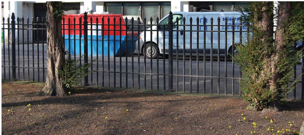
Avgränsningen runt Gamla kyrkogården i Malmö