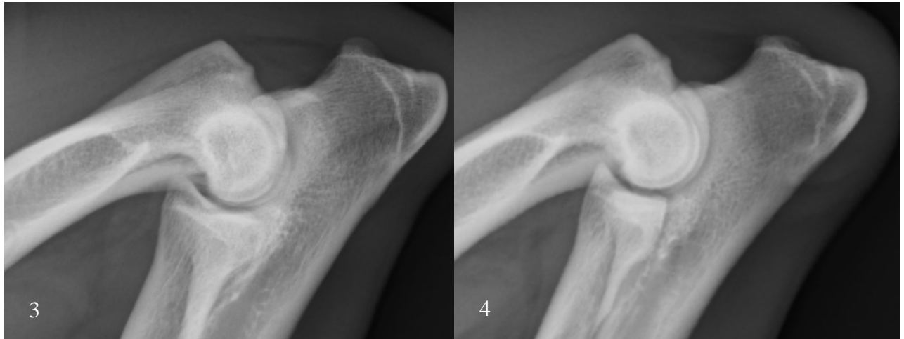
Bild 3 och 4. Måttlig subtrochleär skleros (vänster), ett tidigt radiologiskt fynd vid FCP. Till höger syns en frisk armbåge med normal radiologiska täthet.

FCP har visat sig vara kopplat till osteochondros (Bieżyński et al. , 2010). Patologier i PC förekommer ofta i kombination med lesioner i humeruskondylens ledbrösk (Rezende et al. , 2012). Vid FCP i kombination med en kraftig radioulnar inkongruens är det möjligt att dessa förändringar i humerus representerar "kissing lesions" som tros vara sekundära friktionsskador (Samoy et al. , 2013).