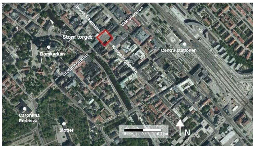
Figur 1. Situationskarta. Visar Uppsalas innerstad. Stora torget är markerat i rött. Underlagskarta: Flygfoto 2018. © Uppsala kommun 2018, bearbetad av författarna.

”Uppsalas torg fyller viktiga funktioner i stadslivet som plats för möten, handel, kultur och rekreation. Innerstadens befintliga torg har potential att utvecklas, få en mer flexibel användning och gynna stadslivet mer än vad de gör idag.” (Uppsala kommun 2015, s 51).