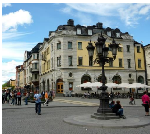
Figur 6. Foto taget på Stora torget. Lampan på torget är exempel på hur detaljer tillför estetiskt värde på en plats.