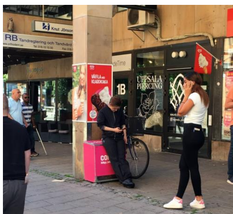
Figur 5. Foto tagit på Stora torget. Visar exempel på hur den fysiska utformningen kan fungera som ståstöd vid vistelse på torget. Foto taget av författarna 30 maj 2018.

Enligt Gehl (2010) söker sig personer till element som de kan stå och luta sig mot. Exempelvis att kunna stå eller luta sig mot en fasadvägg, pelare eller stolpe. Dessa element kan kallas ståstöd. (Gehl 2010, s 134)