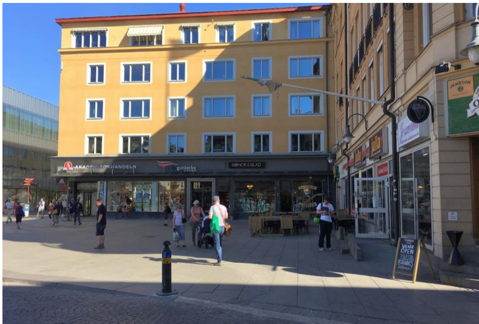
Figur 11. Bild över del C på stora torget. Bilden visar uteservering till restaurangen Jalla Jalla till höger. Akademibokhandeln är placerad på hörnet av byggnaden till vänster. Foto taget av författarna 11 april 2018.