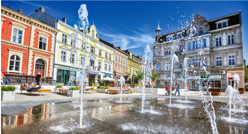
Figur 19. Bilden visar hur ett torg kan vara flexibelt. På sommaren används ytan för fontäner, på vinter kan ytan exempelvis användas för marknader.