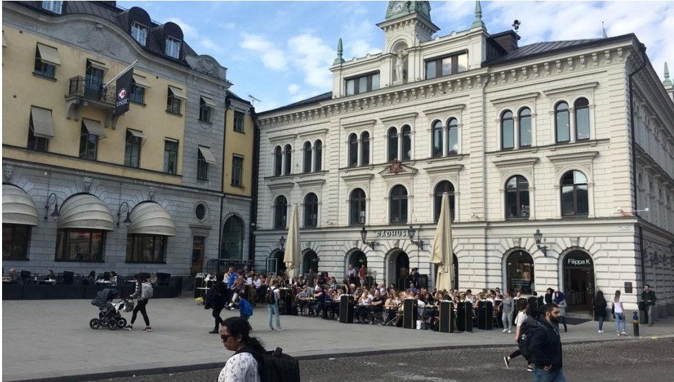
Figur 8. Bild över del A på Stora torget. Bilden visar Rådhuset som är den vita byggnaden med uteservering, till vänster syns uteserveringen för snabbmatsrestaurangen Max. 11 april 2018.