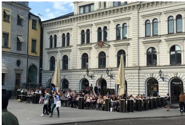
Figur 15. Bild över del A av Stora torget. Visar aktiviteten på uteserveringen och de estetiska fasaderna. Foto taget av författarna 11 april 2018.

Eftersom del A endast består av två uteserveringar har platsen inte en variation av flera olika funktioner. Därför sker det i stort sett bara aktiva möten om uteserveringarna finns och är besökta. Den här delen av torget har därför behov av fler blandade funktioner för att främja sociala interaktioner under större delen på dygnet och vistelse av en större mångfald av människor.