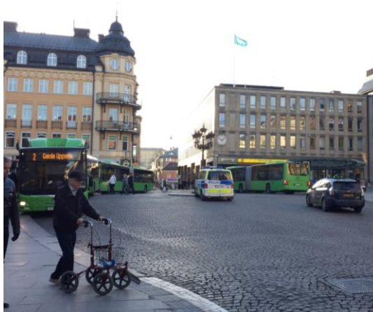
Figur 4. Foto över stora torget. Visar vägen som utgör en stor yta av torget. december 2017.

Förutom trafiken har även brottsligheten en stor påverkan på människors känsla av säkerhet på offentliga platser (Khan, Khder, H & Mousavi 2015). Vad som