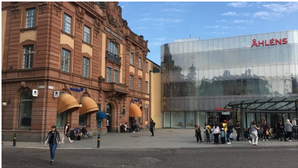
Figur 10. Bild över del B på Stora torget. Bilden visar busshållplatsen till höger. I den vänstra byggnaden finns en gymnasieskola och Nordea. Längs med byggnaden finns tre bänkar utplacerade. Fotot taget av författarna 11 april 2018.