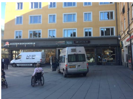
Figur 18. Bild av del D på Stora torget. Visar hur ytan används för bilar att stanna upp på vid behov.

Vid observation av torgets olika delar identifierades faktorer som kunde förbättras för att främja det sociala livet mellan människor. Alla delar har olika kvaliteter och svagheter ur aspekten att en plats ska bidra till möten och social interaktion mellan människor. Trots att några delar av torget har svagheter, som bland annat dåligt med blandade funktioner och attraktivitet, så uppfyller Stora torget i helhet en variation av både funktioner och olika typer av upplevelser. Att det finns en blandning av skola, affärer, snabbmatsrestauranger, finare uteserveringar och enklare sittplatser utplacerade gör Stora torget till ett relativt mångfunktionellt utrymme där människor kan vistas och mötas av olika anledningar. Däremot är de positiva kvaliteterna med Stora torget relativt ojämnt fördelade över hela ytan. De blandade funktionerna är inte jämnt utspridda över torget, vissa delar är bortglömda och utgörs endast av en tom yta att passera. Det är tydligt att där människor vistas