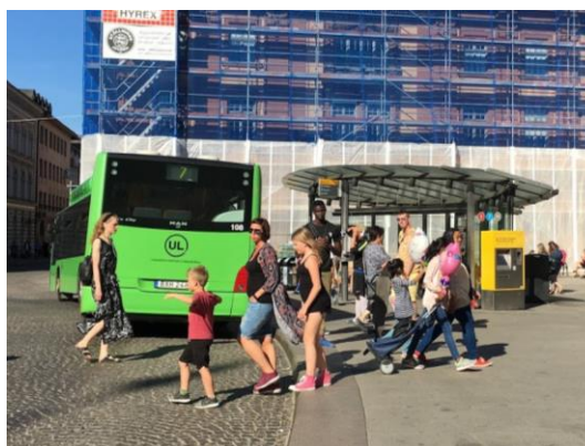
Figur 17. Bild av del C på Stora torget. Visar aktiviteten vid busshållplatsen.

Fördelarna på platsen bidrar till möten och aktiviteter, samtidigt finns det kvaliteter som saknas. Det är en relativt liten variation av aktiviteter på platsen. De flesta möten som sker blir korta i väntan på bussen. Att förbättra platsens attraktivitet hade kunnat skapa en större variation av möten och att en mångfald av människor vistas platsen. Attraktiviteten hade kunnat förbättras genom att bland annat placera ut fler sittplatser i det gynnsamma läget i solen. I litteraturoversikten redogjordes det hur människor gärna kombinerar nytta med nöje. Istället för att väntan på bussen sker vid en busshållplats hade människor likaväl kunnat nyttja sittplatser placerade runt om. Detta kunde bidra till en annan typ av mänsklig aktivitet där det finns möjlighet till att betrakta och uppleva det som sker på torget i samband med väntan på bussen. Sittplatser är inte enbart positivt i det avseendet att det bidrar till attraktivitet på en plats, sittplatser är även något som bidrar till en ökad tillgänglighet. Tillgänglighet innebär att det både ska vara enkelt att röra sig från en plats till en annan men att det även ska vara enkelt för alla att vistas på en