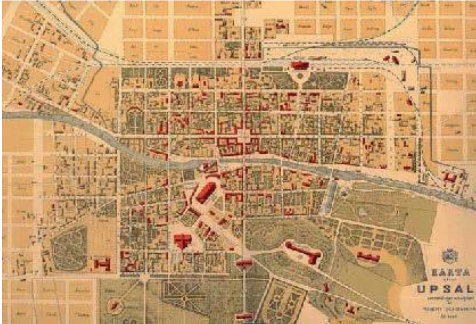
Figur 2. Historisk karta över Uppsala. Visar att innerstadens rutnätsstruktur utgår från Stora torget. Karta av Robert Schumbers från 1882.