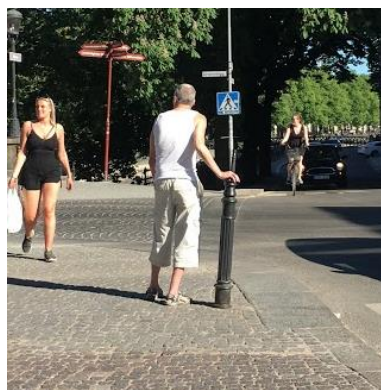
Figur 16. Bild som visar hur fysiska element på offentliga platser kan fungera som ståstöd. Foto taget av författarna 30 maj 2018.

Att de tre bänkarna nästan alltid var upptagna påverkar tillgängligheten på platsen. Det fanns på så sätt inte tillräckligt med sittplatser för exempelvis äldre eller funktionshindrade att ta en kortare paus för att återhämta sig.