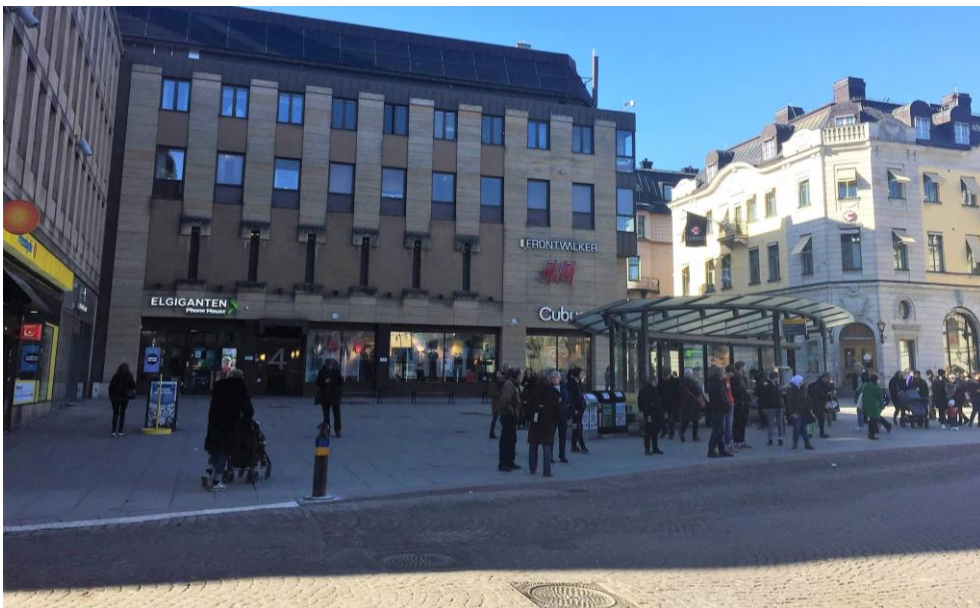
Figur 9. Bild över del B på Stora torget. Bilden visar busshållplatsen till höger. Till vänster finns en pressbyrå. Till vänster finns det även ett övergångsställe där trottoaren är nedsänkt. Foto taget av författarna 11 april 2018.