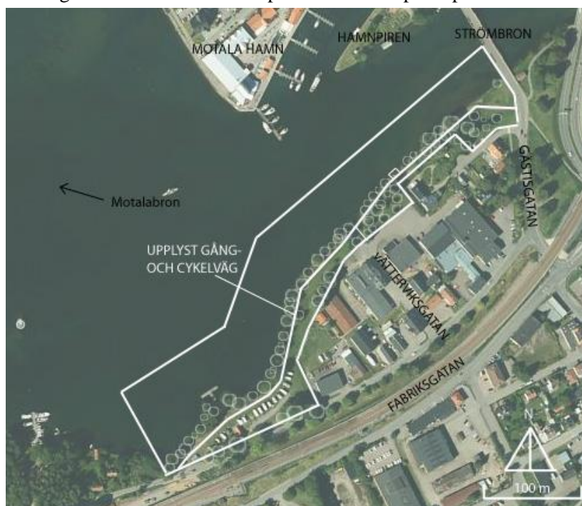
Figur 2. Avgränsningskarta som visar planområdet i vitt. Utformad av författaren.

Kandidatexamensarbetet motsvarar heltidsstudier på 40 timmar per vecka i tio veckor och ger 15 högskolepoäng, vilket gör att arbetets omfattning är begränsat. Arbetsområdet är avgränsat till det som i dagsläget kallas Motalavikens södra strandstråk. Detta arbete omfattar ett gång- och cykelstråk samt vattnet 40 meter ut från strandlinjen. Studien avgränsas till en övergripande vision för platsen enligt rumsliga kvalitetskriterier som presenteras i en principskiss.