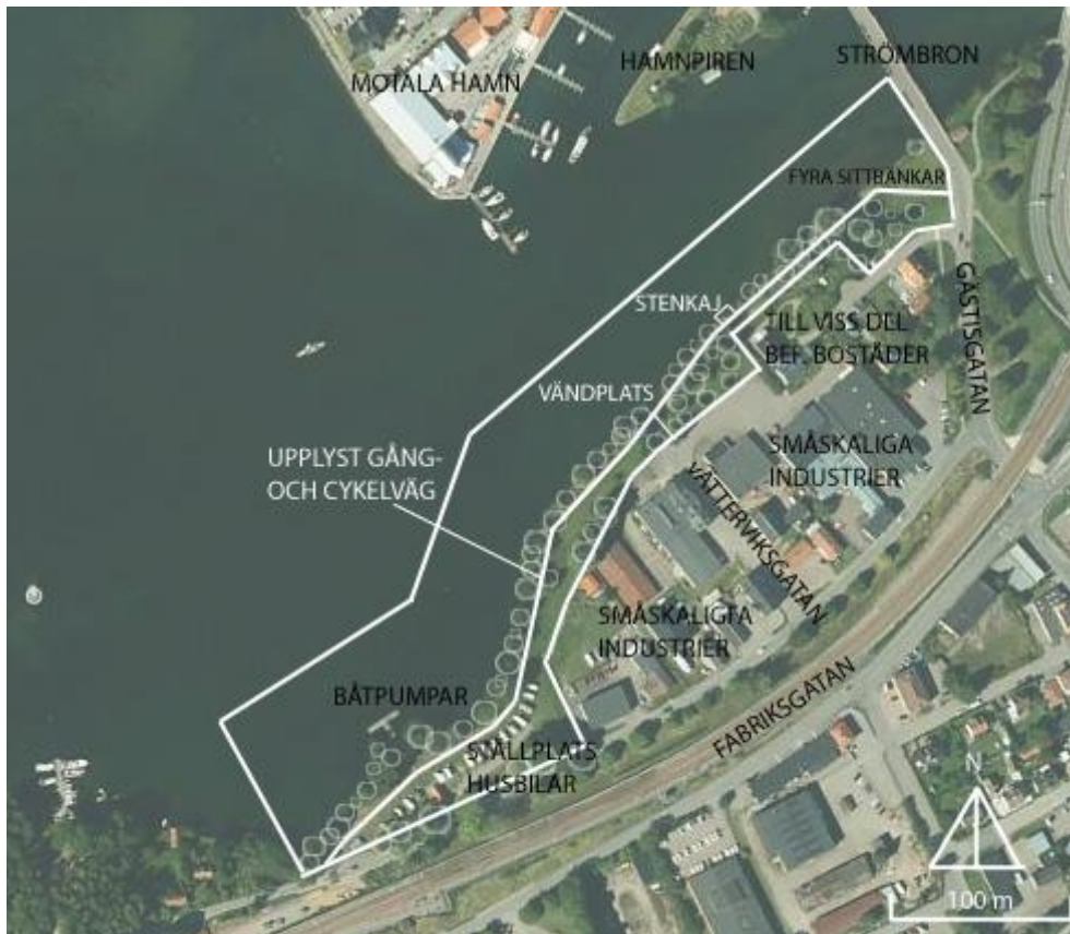
Figur 4. Bild som visar planområdets inkludering enligt Metha (2014). Utformad av författaren.

upplyst strandstråk. Det är begränsat med aktiviteter och beteenden som utövas längs vägen, då den mestadels används som passage. Säkerheten har inga fasta installationer med grindar, vakter, kameror men strandvillornas och industriernas nära fönster utgör en mindre trygghet. Sammantaget kan man anse området som tillgängligt och öppet för en allmänhet, som dock idag inte är alltför talrik på stråket. Möjligheten att delta i aktiviteter och sociala beteenden längs stråket finns men variationen här är begränsad idag. Man passerar huvudsakligen området på väg någonstans om man inte rastar hund eller njuter av sjöutsikten. Området har potential till ökad variation, vilket jag hoppas kunna visa med min principskiss.