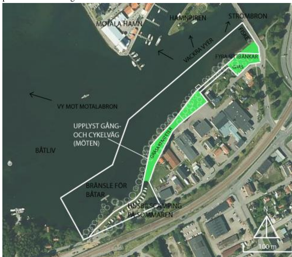
Figur 5. Bild som visar planområdets meningsfulla aktiviteter enligt Metha (2014). Utformad av författaren.

observation är negativ för denna dimension, "Meaningful Activities", trots att platsen har vissa begränsade aktiviteter.