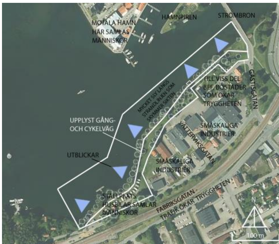
Figur 7. Bild som visar planområdets säkerhet enligt Metha (2014). Utformad av författaren