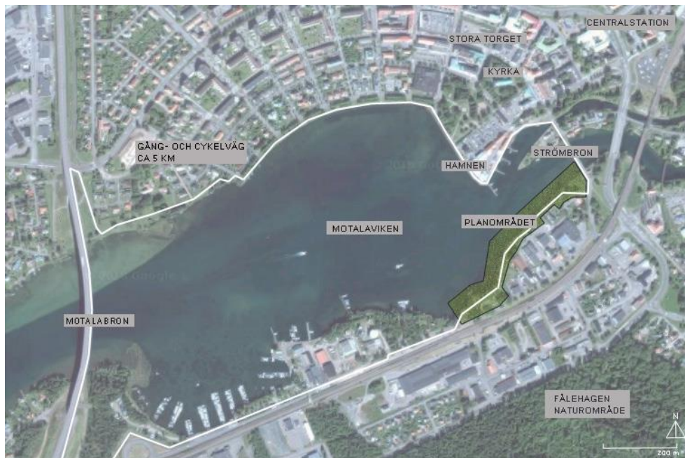
Figur 1. Översiktlig karta som visar planområdet "Motalavikens södra strandstråk" i grönt och dess placering i staden. Utformad av författaren.

Tidigare under 1900-talet har området varit präglad av industrier och på grund av dess centrala läge vid Vättern, finns även verksamheter kopplade till båtlivet i staden. Området var tidigare beläget i utkanten av Motala men på grund av att staden växer har området nu blivit mycket centralt. Idag behöver området en ny användning för att tillmötesgå stadens behov (Svensson 2016). Förslaget att förstärka social interaktion på platsen bygger på en vetenskaplig litteraturstudie.