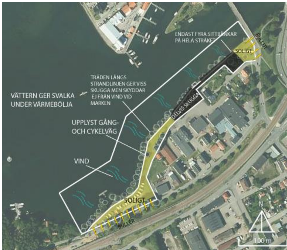
Figur 6. Bild som visar planområdets komfort enligt Metha (2014). Utformad av författaren.