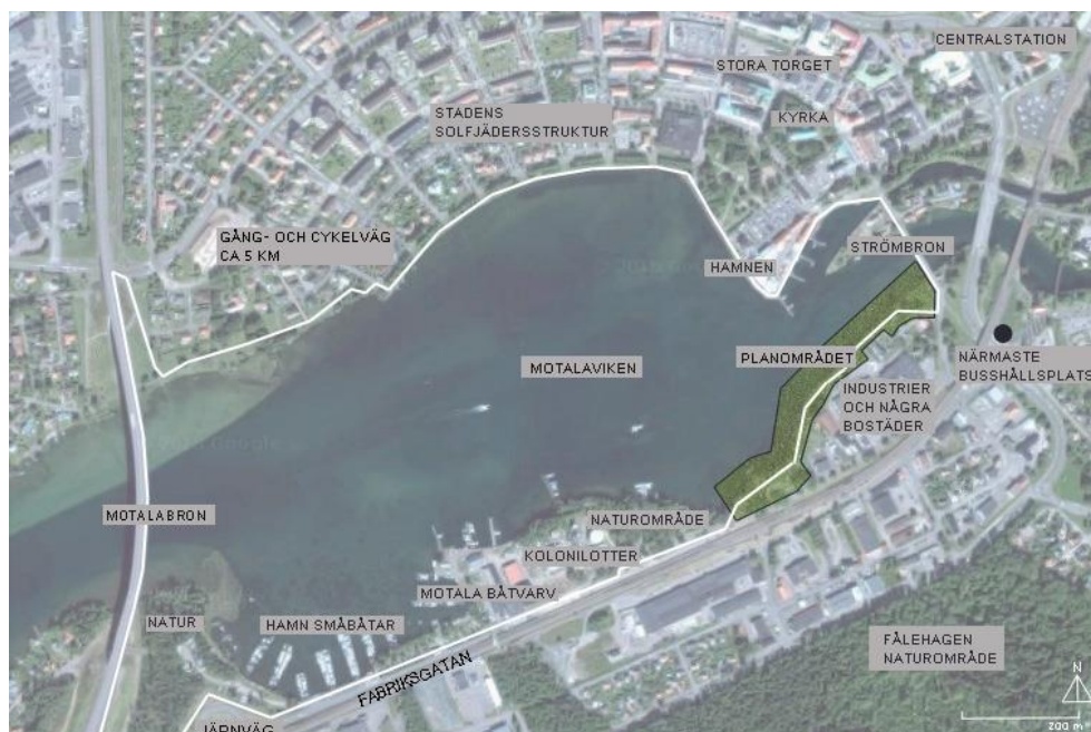
Figur 3. Översiktlig karta som visar viktiga målpunkter i Motala samt planområdet "Motalavikens södra strandstråk" i grönt. Utformad av författaren.