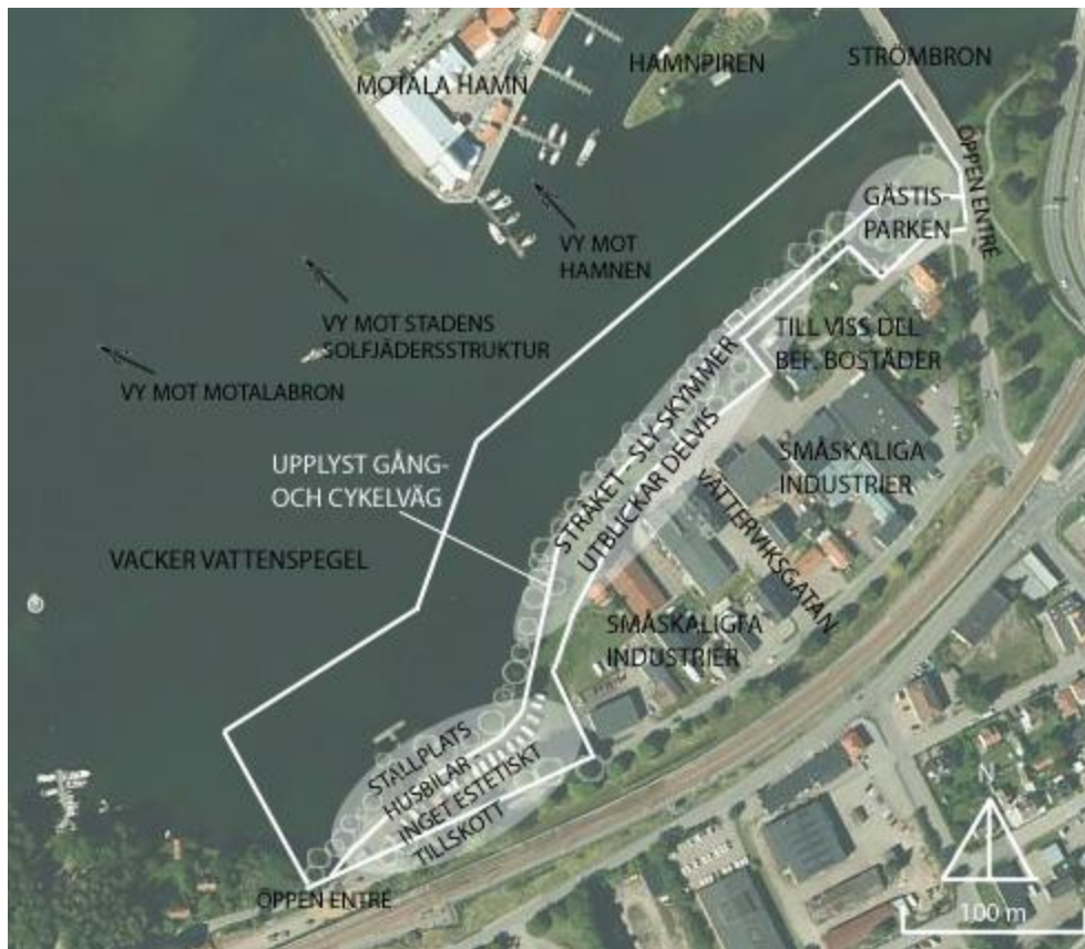
Figur 8. Bild som visar planområdets trivsel och välbefinnande enligt Metha (2014). De tre vita områdena visar områdets olika delrum. Utformad av författaren.

Strandstråket uppfattas som attraktivt av människor, dock inte speciellt intressant, då det nu saknar sådana intressehöjande egenskaper och kontext. Själva stråket i sig utgör en sammanhållen enhet, som avgränsas av vatten och kvartersmark. Mehtas begrepp "enclosure" kan sägas beskriva området till del - man kan känna sig "inne i området". Tre gröna sub-rum (synbara delrum) finns även i strandstråket - gästisparken, stråket och husvagsytan. Variationsrikedomen längs stråket är fattig och borde kunna förbättras avsevärt. Det saknas i stort sensorisk sinnes-komplexitet och området är ganska enahanda frånsett vattnet. Staden har heller inget gjort av själva stranden, som delvis döljs bakom sly och buskage. Om den byggda miljön i ögonhöjd är intressant och spännande, så tenderar hela ytan bli intressant enligt Ralph Erskine, världsberömd arkitekt (Gehl s.92, 2010). Därför är det viktigt att de planerade byggnaderna (Svensson 2016) längs strandstråket har intressanta verksamheter på markplanet. Sevärdheter längs strandstråket stimulerar vidare upplevelsen av stråket. Sammantaget kan området sägas ha stor kvalitativ rumslig potential vid en designad förnyelse.