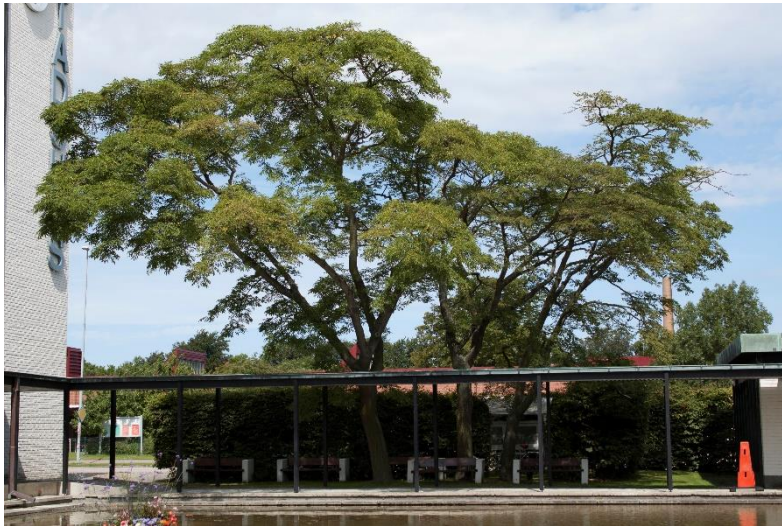
Figur 4: Sibiriskt korkträd vid Stadshuset i Höganäs.

I utvärderingen fokuserade jag på utseende hos fullvuxna träd. Vid en nyplantering med sibiriskt korkträd skulle det ta många år innan den önskade karaktären uppnåtts. Under lång tid skulle platsen vara kraftigt förändrad. Även en förnyring av paraplyalmarna skulle upplevas som ett stort ingrepp på platsen. Men den skulle nog lättare accepteras då den syftar till att återställa platsen till dess ursprung. Paraplyalmarna har också redan som unga sin speciella grenarkitektur, vilket återställer en del av utseendet direkt vid nyplantering och gör det lättare att se vad som med tiden kommer att utvecklas.