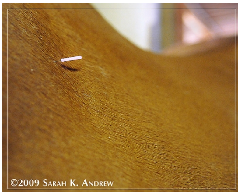
Illustration 1: Akupunktur på häst.

Ett mer västerländskt sätt att se på saken är att då nålarna sticks in och stimulerar nervändar frisätts kemikalier i muskeln som i sin tur signalerar till hjärnan att minska smärtan och påskynda läkningen (9). Det har visat sig att 71% av akupunkturerna som beskrivs i den kinesiska medicinen stämmer väl överens med välkända triggerpunkter* (15). När akupunktören genom att sätta sin nål stimulerar en viss akupunktur kan det initiera neurologiska och vaskulära svarsreaktioner, och akupunktur verkar även kunna stimulera flera olika typer av receptorer. Hos hästar har det beskrivits att det även höjer kortisolnivåerna i blodet och stimulerar till frisättning av beta-endorfin (7). Beta-endorfin är en morfinliknande peptid som binder till opioidreceptorer, och är en del av den kroppsegna smärthämmningsmekanismen, vilket bidrar till smärtlindring. Även den så kallade portmekanismen har betydelse för akupunktörens smärtlindrande egenskaper. Portmekanismen innebär att A \delta – och C fibrer, via en rad olika signalsubstanser, blockeras av framför allt A \beta -fibrer, och därmed orsakas en segmentell smärthämning. Detta sker vid bland annat tryck så som akupunktur, massage eller elektrisk stimulering på det smärtdrabbade området (16).