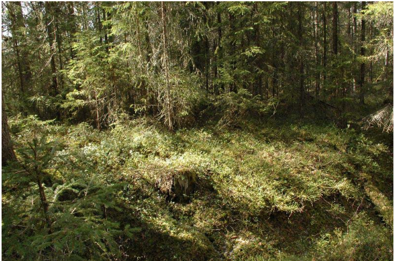
Bild 1 Den kolbotten som valdes för milan.

Efter en kort promenad i skogen fastnade vi för en totalt igenvuxen kolbotten några hundra meter nordväst om Rönnäsgården. Efter en del planerande och teori var det dags att ta tag i de betydligt mera handfasta delarna av projektet.