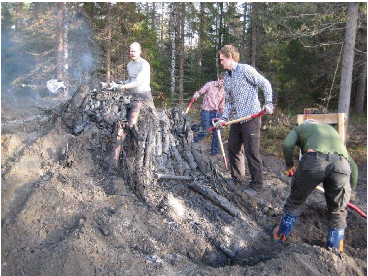
Bild 5 Under stybben låg ca 4000 liter prima björkvedskol och väntade.

Ett första rivningsförsök gjordes en dryg vecka efter att milan stänges. Försöket avbröts då milan fortfarande var mycket het och började brinna så snart stybben avlägsnats.