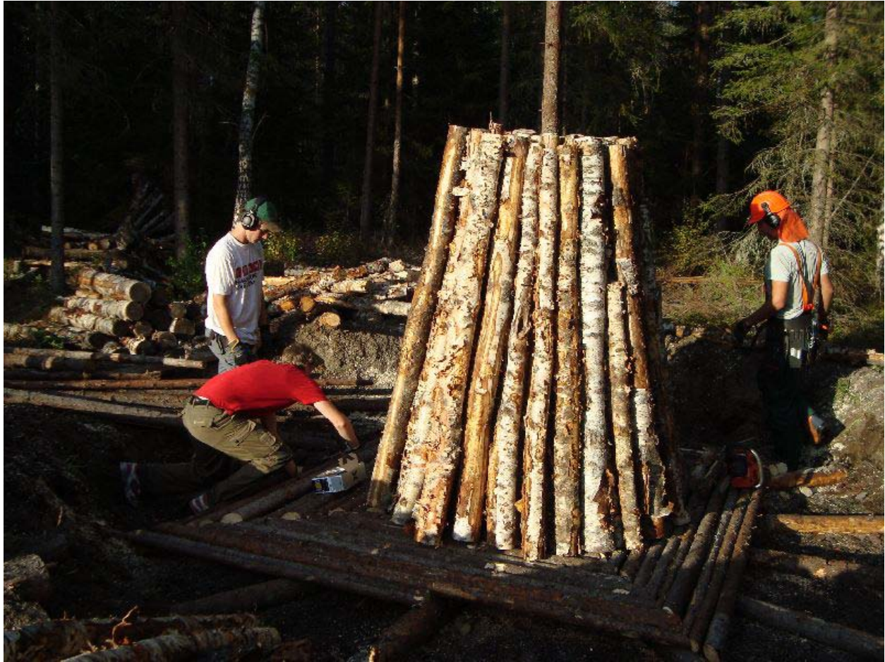
Bild 3 Milan reses samtidigt som rostret färdigställs. Det är av yppersta vikt att alla stockar står exakt parallellt med kungen, den stock som är ställd i centrum på milan. Om detta misslyckas föreligger en stor risk att milan rasar under uppbyggnaden.

Efter resningen var det dags för risningen av milan. Risningens syfte är att skapa ett lager mellan kolveden och stybben. Samtidigt som granriset förhindrar stybben att tränga in i milan har det även en isolerande effekt.