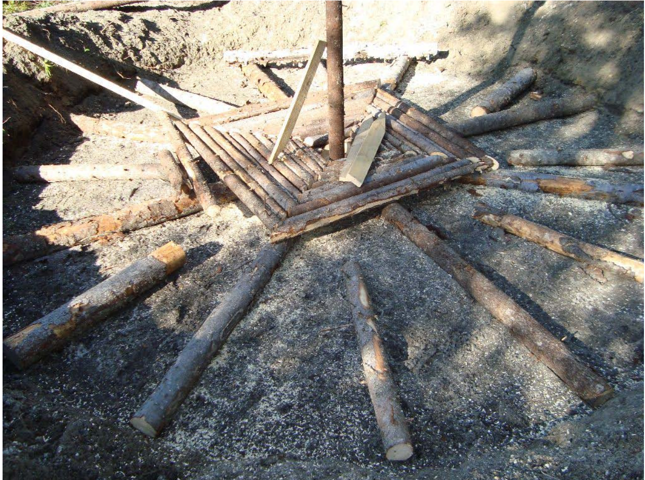
Bild 2 De grova stockarna som ligger på marken kallas vasar. Deras uppgift är att hålla uppe golvet, eller rostret, som kolveden skall stå på. Under rostret drar milan in det syre den behöver till förbränningen.

Vasarna i en mila har två uppgifter; att tillåta luft att förflytta sig under milan och att bära rostret som virket reses på. Detta arbete var inte komplicerat men ändå relativt omfattande. De klena granar som röjts bort våren 2008 kom här till användning som roster.