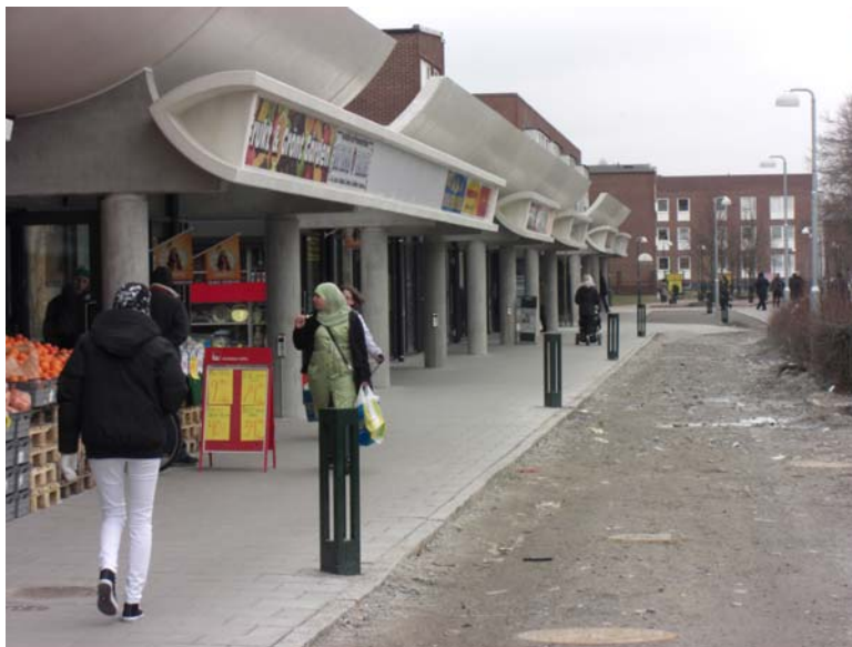
Figur 1. Gatny. Bokaler i Rosengård.

I Rosengård ser man möjligheterna att öka välfärden både ekonomiskt och socialt ”genom att blanda funktioner, verka för ökad etablering av företag och skapa goda offentliga platser” (Malmö Stad 2008 s. 32). Som en del i detta arbete har åtta så kallade bokaler uppförts i stadsdelen (Malmö Stad 2008 s. 15, MKB 2010). En bokal är en kombinerad bostad och lokal, som inkluderar både boende och verksamhetslokal. Bostadsytan varierar mellan tre och fem rum. Detta är ett nytt koncept för MKB, Malmös kommunala bostadsbolag, och är enligt dem själva ”ett steg i att utveckla våra bostadsområden” (MKB 2010). Bokalerna är ett nytt tillägg i bebyggelsen i Rosengård, vilket innebär en ändring i ursprungsplanerna som upprättades vid planeringen av området. Dessa hade uttalade restriktioner om funktionsuppdelning. Här planeras alltså en annan form av funktion in i de oblandade bostadsområdena. Ursprungsbebyggelsen i Rosengård är avsedda för boende och kontor – butikslokaler ingår inte i planbestämmelserna. Därför krävs att nya detaljplaner görs om man vill ändra på detta (Malmö Stad 2008 s. 15). Uppförandet av bokaler är alltså en konkret och genomförd del av arbetet med förtätning och uppluckrandet av det ensidiga bostadsområde som Rosengård utgör.