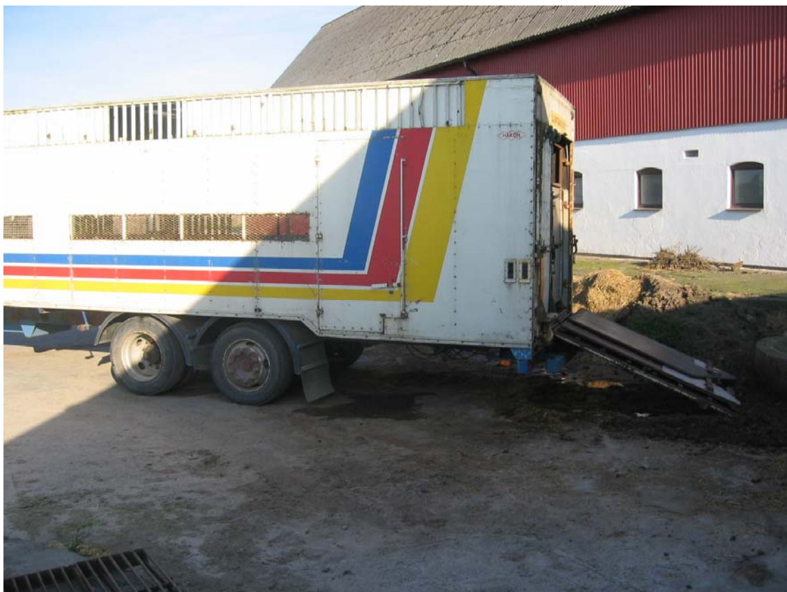
Figur 1. Exempel på egen transportvagn.

Utslussning av djur bör ske via ett slussystem. Det ska finnas ett slussrum (utlastningsrum) som kan mynna i en drivgång eller till en transportvagn, eller en kombination av dessa. Det är viktigt att man rengör utrymmet efter varje användning och att inte utslussning sker oftare än var tredje dag. Utslussningen kan ske på olika sätt. Antingen drivs djuren i en drivgång och sedan direkt upp på transportvagnen. De kan också lastas på en transportvagn som tillhör gården (figur 1). Sedan så kör man ut djuren till en utlastningsmodul (minst 150 m från besättningen) där djuren lastas om till slaktbilen. Transportvagnen skall rengöras och desinficeras mellan användningarna. Vid transport av livdjur krävs det att transportvagnen inte har kört konventionella grisar den senaste månaden och att den är rengjord och desinficerad före transporten. Det är viktigt att personalen tänker på att de använder speciella skodon i utlastningsmodulen samt att de kläder som har använts där tvättas direkt (Wallgren, 1993; Wallgren och Vallgård, 1998).