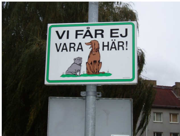
Figur 11 Seved 2, skylt.

inte. Samma boende är ändå nöjd med att ha fått bort cyklarna från att stå vid källartrapporna för det väsnades mycket när cyklisterna låste fast sina cyklar med en kedja i trapppröcket till källartrappan. Trots skylten mot rastning av hundar ( se figur 11) så är det ändå ägare som rastar sina hundar utan att ta upp efter sig.