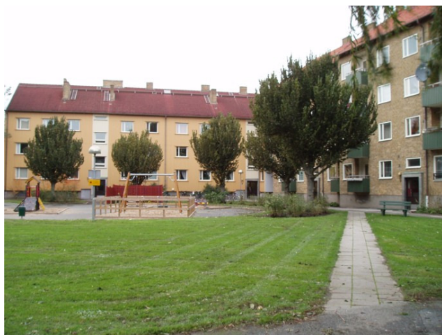
Figur 7 Seved 2, väster ut.

Jag har valt att göra min fallstudie på bostadsgården Seved 2 (se figur 6, 7, 8), runt gården ligger fyra hyreslägenhetshus som ägs av MKB. Jag har intervjuat MKB:s förvaltare och vaktmästare om vad de tycker om Seved 2 och vad de upplever att de boende tycker och känner för sin utemiljö. För att få ett så brett urval som möjligt har jag intervjuat fem boende i husen runt gården, både kvinnor och män i olika åldrar som har bott på gården olika länge. Intervjuerna är gjorda under hösten och vintern 2006.