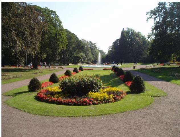
Figur 5 Stadsparken i Lund.

Min reflektion är dock att ett sådant ingrepp kan ändra karaktären på parken och förstöra den naturliga upplevelsen under dagens ljusa timmar. Istället bör det finnas alternativa gångvägar att ta sig fram på utan att behöva passera igenom parken.