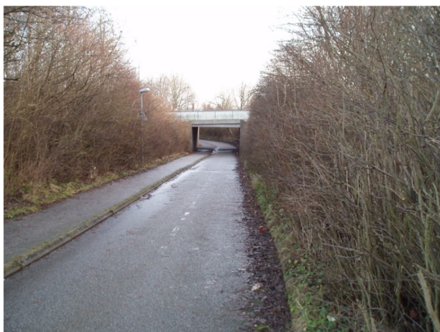
Figur 4 Gångtunnel med hög vegetation.

För att uppnå större trygghet ur brottsynpunkt är det bäst om man kan undvika trafiklösningar som innefattar gång- och cykeltunnlar. (Listerborn, 2000; Boverket, 1998)