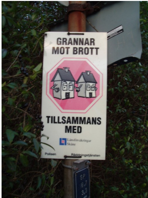
Figur 1 Grannsamverkans skylt.

fastighetsförvaltare bygger upp ett socialt nätverk där man samarbetar och hjälper varandra. Målet med grannsamverkan är att öka tryggheten och minska brottsligheten. Det är framför allt i villaområden som grannsamverkan är vanlig, men det förekommer även i flerbostadshus. I områden där det finns grannsamverkan sätts skyltar upp att det pågår ett gemensamt arbete mot brott. Ett exempel på grannsamverkan är när någon åker bort och grannarna hjälper till att hålla koll på huset, genom att ta in post och klippa gräs med mera. (Boverket, 1998)