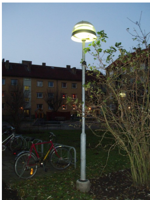
Figur 9 Seved 2, belysning.

Alla boende tycker att belysningen (se figur 9) är tillräcklig, varken för mycket eller för lite. Det upplevs tryggare inne på gården än ute på gatan. Metallportarna (se figur 10) inger också en sorts trygghet, att man kan stänga den bakom sig och sen även stänga dörren till trapphuset bakom sig.