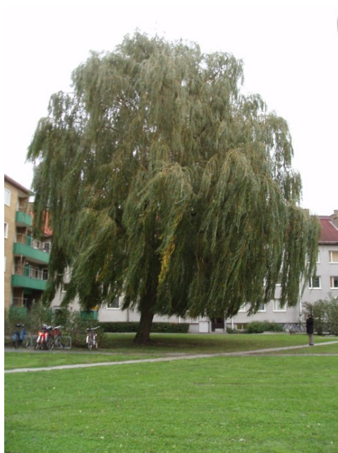
Figur 8 Seved 2, öster ut.