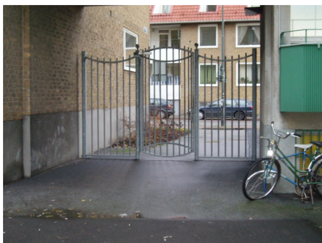
Figur 10 Seved 2, ingång från Bragegatan.

Alla boende tycker att belysningen (se figur 9) är tillräcklig, varken för mycket eller för lite. Det upplevs tryggare inne på gården än ute på gatan. Metallportarna (se figur 10) inger också en sorts trygghet, att man kan stänga den bakom sig och sen även stänga dörren till trapphuset bakom sig.