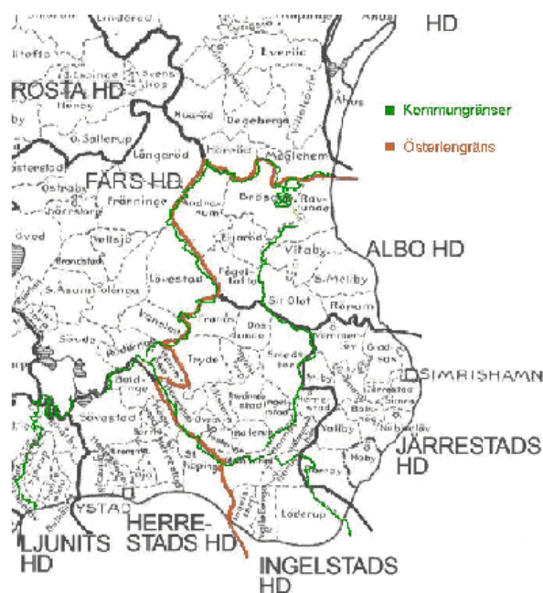
Fig. 1. Karta över Österlen med kommungränser och häradar. Reviderad av författaren. Ursprungskartan återges med tillstånd av DDSS Demografisk Databas Södra Sverige

Geografisk avgränsning har gjorts till Österlen. ”Tre häradar: Ingelstad, Järrestad, Albo, kustremsan från Haväng söderut till Sandhammaren och runt udden förbi Hammars backar, slättbygden innanför med dess byar, Simrishamn som den obestridda centralpunkten - detta är Österlen.” (Löfström, 1994 s.12) Österlen betyder egentligen österut och finns med i lexikon från 1876 (s.10). Motsvarande om väster - Västerlen användes också (s.9). Ingen egentlig gräns finns för området som kallas Österlen, men för att ha något att utgå ifrån är det området som Löfström beskriver som i det här arbetet menas med Österlen.