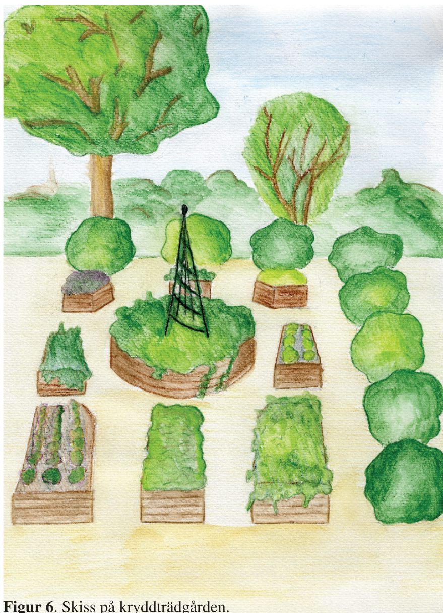
Figur 6. Skiss på kryddträdgården.

utspridda i rabatter över hela tomten. Jag tycker att det är väsentligt att återuppta perennrabatterna vid framsidan av huset som finns på ett av de gamla fotografierna.