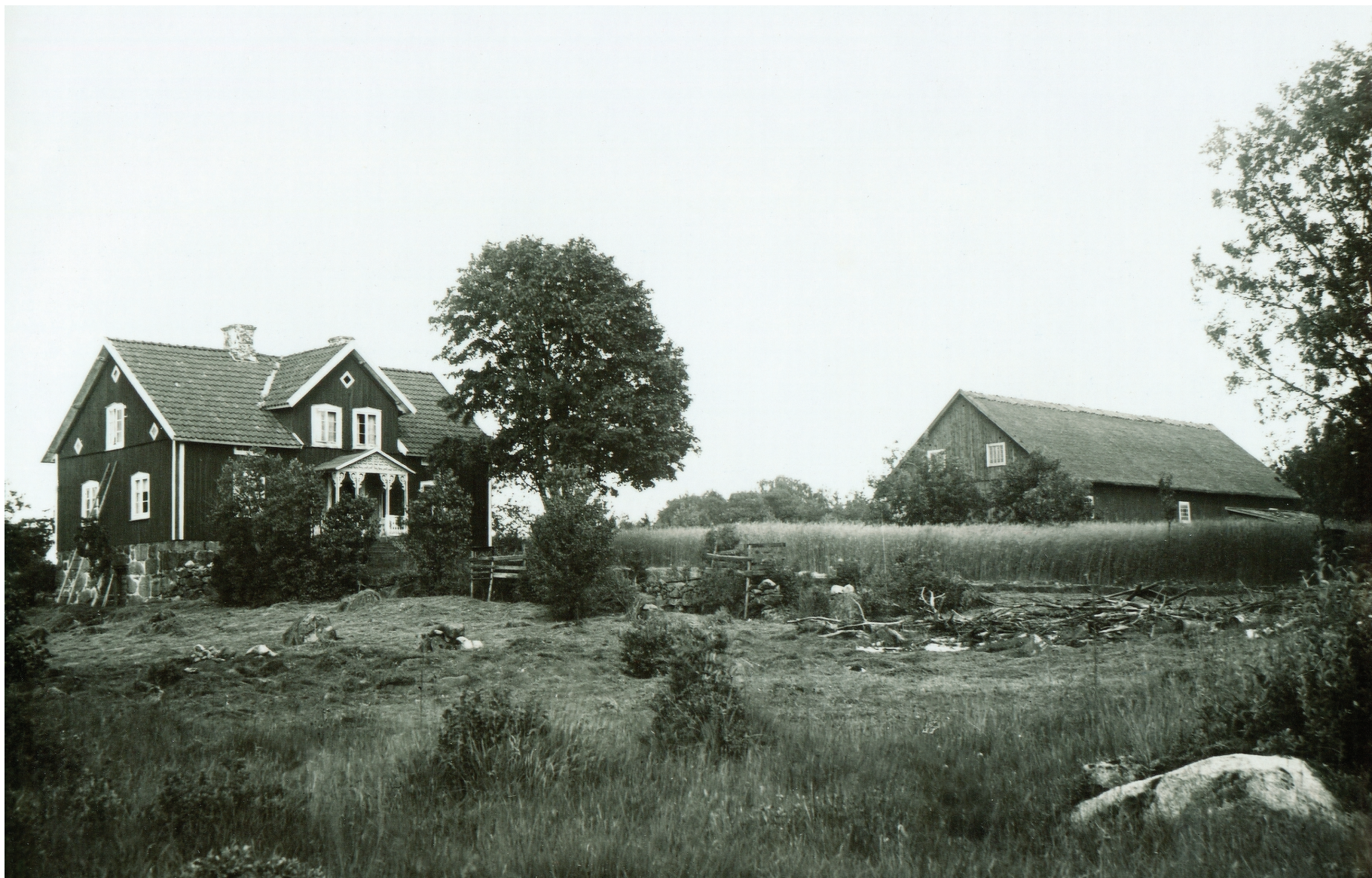
Figur 5. Gården och dess omgivning sedd från vägen.