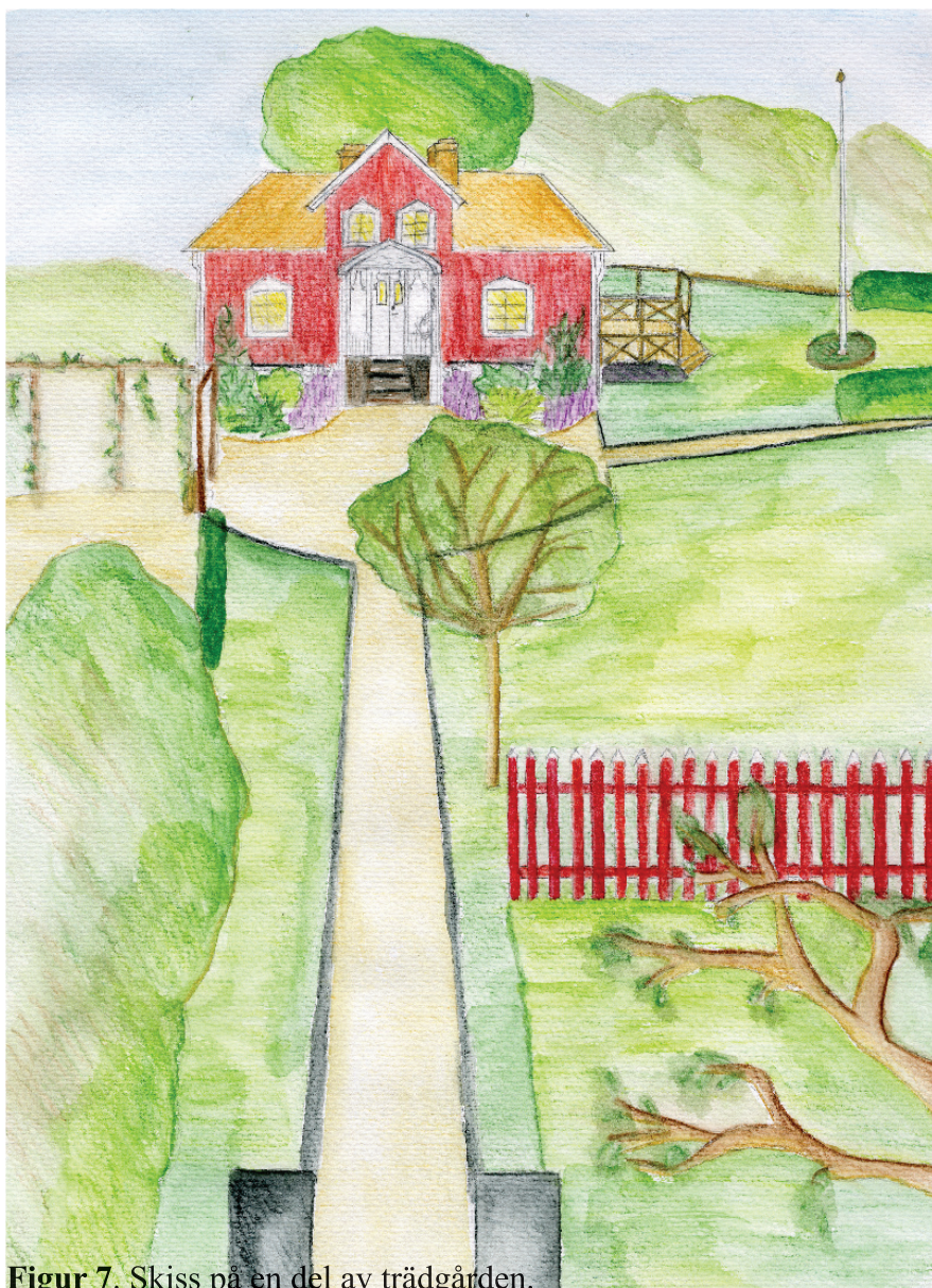
Figur 7. Skiss på en del av trädgården.

kantklippning. Eftersom husgrunden inte är helt jämn och med tidigare erfarenhet av att det inte är bra att plantera växter och gräs intill huset, skulle det därför vara lämpligt att lägga singel närmast ca 30 cm brett. För att få ett visst skydd mot ogräs som växer upp i singelytorna kan man använda en spärr av geotextil. Det skyddar inte helt mot rotagräs och inte heller mot fröogräs som sprids med vinden men den begränsar en stor del.