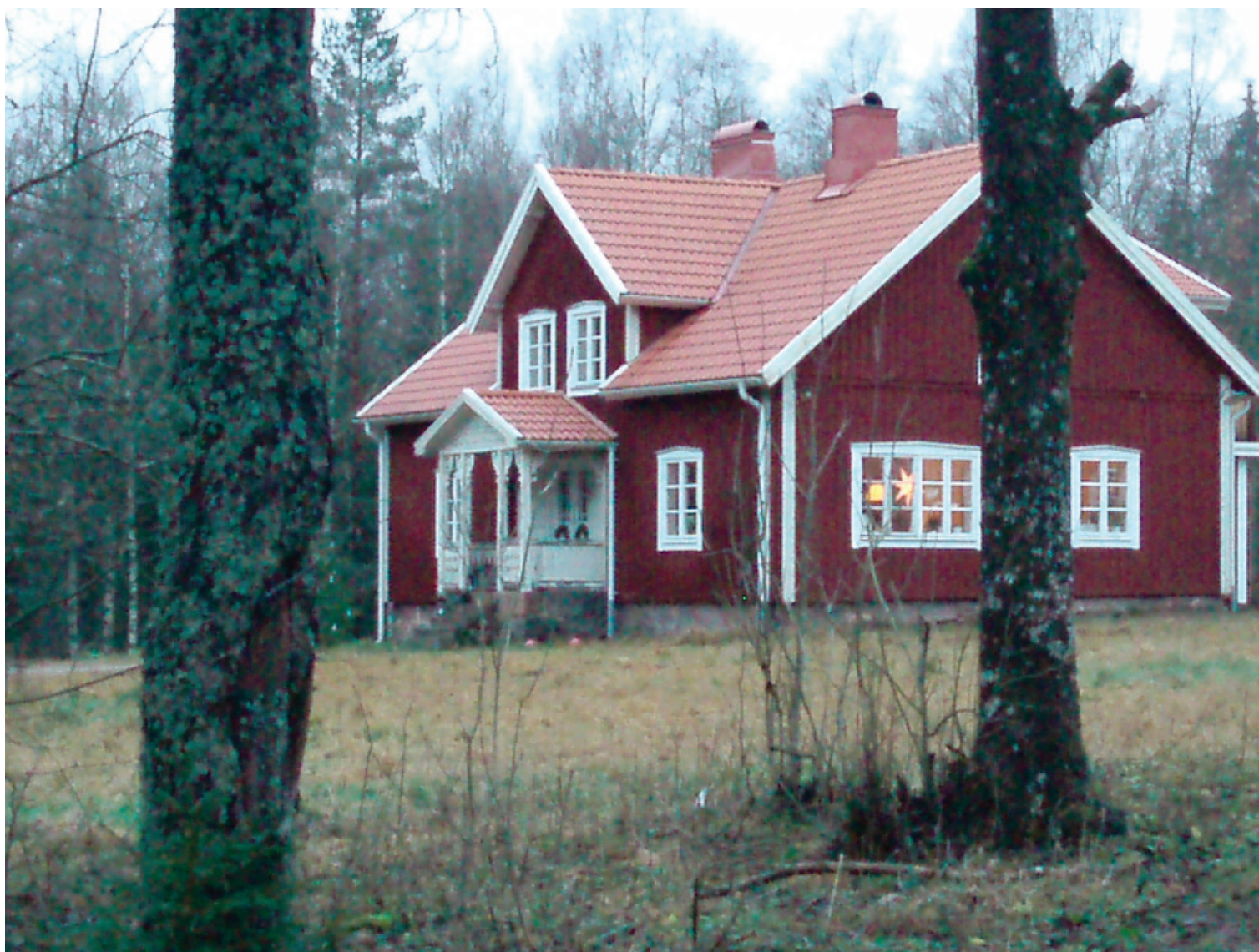
Figur 2. Boningshuset på Östregård.