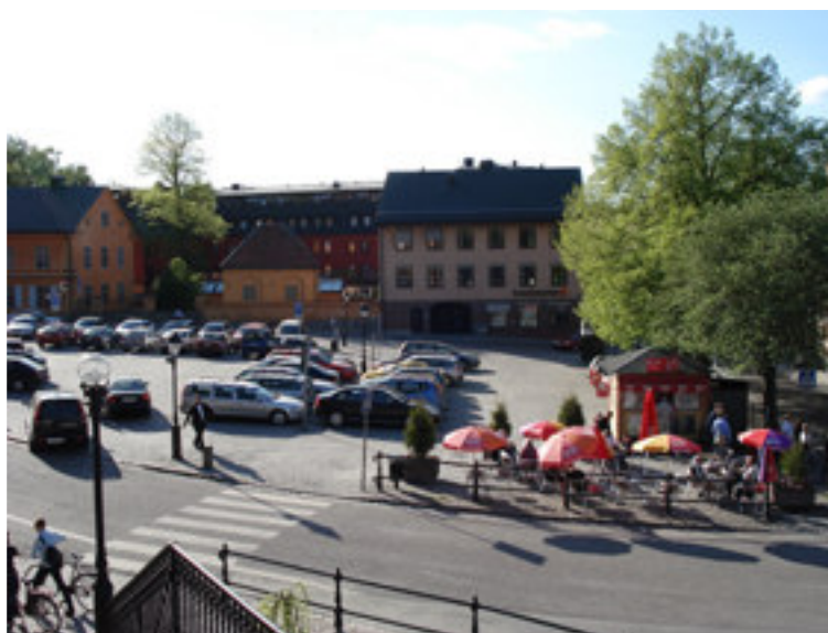
Fig. 7. På bilden ser vi dagens S:t Eriks torg som idag är en bilparkering med några träd.

Enligt foto från 1902 kan man se nyplanterade träd och dessa kan vara de som står där idag. Vid början av 1900-talet var det fortfarande handel på hela torget, man sålde alla slags matvaror fram tills Saluhallen byggdes år 1909. 53