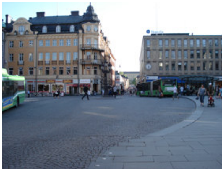
Fig. 4. Bussarna har en central roll på dagens Stora torget, men det är ändå en plats som anpassats för de gående.

Torget's förändringar har främst skett under 1900-talet i och med att torghandeln togs bort och trafiken fick en central roll på platsen.