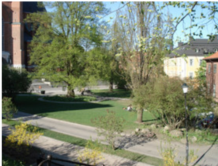
Fig. 8. På bilden ser vi Riddartorget som idag är en park.

Sedan mitten av 1700-talet kallats det Riddartorget och man tror att det är efter räntmästaren Peter Julinsköld som lät uppföra Dekanhuset som privatbostad under 1740-talet. 59 Enligt bild från 1760-talet kan man se att torget var en öppen yta med vägar längs kanterna. År 1868 är platsen torg på kartan och 1880 är det park så under åren där emellan har funktionen ändrats.