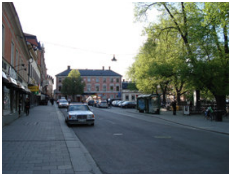
Fig. 6. Fyristorg domineras av vägen, men har en del grönska med träden längs ån.

1954 anlags bilparkering på torget som i början var avstängd på handelsdagar, men på 1990-talet parkerades det där även på handelsdagar. Hälften av parkeringarna togs bort 1999 och idag får man bedriva handel på de delar som inte är parkering. 43