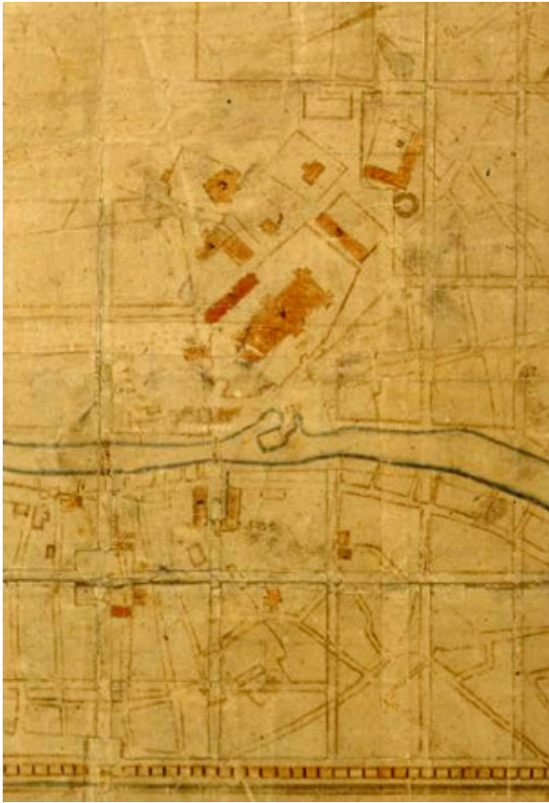
Fig. 2. Del av 1643 års stadsplan över Uppsala med de centrala torgen. Under den nya rutnätsplanen kan man se stadens tidigare struktur.