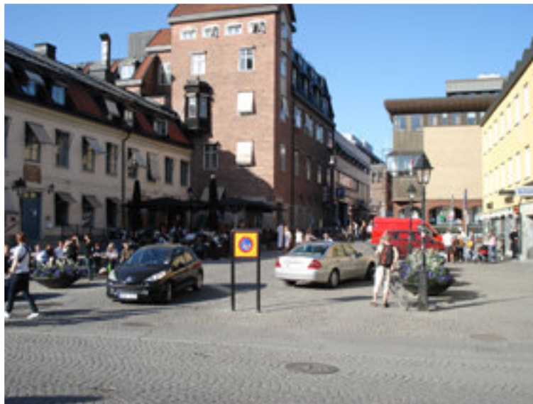
Fig. 5. Som vi ser på bilden är Gamla torget idag en plats med många funktioner som ska få plats på en liten yta.

På 1850-talet byggdes ett äldre hus vid torget om som inhyste hotell och bokhandel. Detta gav torget en större betydelse som affärsmiljö. 34 Enligt fotografier av torget kan man se att det under 1900-talet haft olika markutformning och under en tid fanns det träd här.