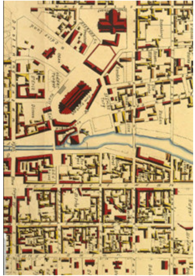
Fig. 3. Del av 1880 års stadsplan över Uppsalas centrala delar där de centrala torgen finns med.