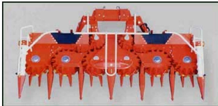
Figur 1. "Kemper 345" är ett radoberoende majsbord. I figuren syns de sex kugghjulsliknande tallrikarna och även inmatningstrummorna.

Kemper har ett radoberoende majsbord (se figur 1) som kan kopplas till självgående hackar. Majsbordet är ett "Kemper 345-bord". Det är ett bord från Kempers 300- serie med en arbetsbredd på 4,5 m. Bordet är utrustat med sex tallrikar. På dessa tallrikar sitter fingrar, likt ett kugghjul, som ska föra in grödan mot den klingan som roterar under den kugghjulsliknande tallriken. Båda snurrar åt samma håll, men den undre klingan snurrar betydligt fortare. (Nilsson, pers. medd. 2005) På så vis huggs grödan av och transporteras sedan vidare mot inmatningskanalen. Vid denna intransport komprimeras grödan ytterligare och blir inmatat i valsarna med hjälp av två aggressiva lodrät stående trummor. (Champion Danmark A/S, 2005)