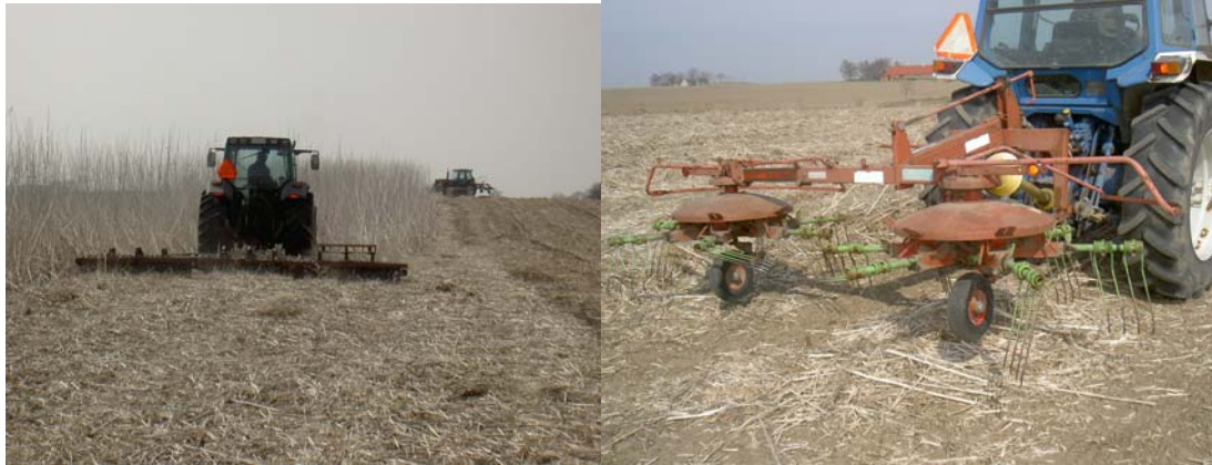
Figur 7. T.v. Thomas ringvältar hampan. T.h. Strängläggaren med två rotoror som strängade den tillplattade hampan.

Dagen innan mitt besök hade han haft en rapshuggare ute på fältet för att stränglägga hampan. Detta fungerade inte alls, då det inte fanns något motstånd alls i rötterna utan dessa följde med upp. Efter att med mycket stopp och stor möda kört en längd på detta viset med väldigt ojämn sträng som resultat bestämde sig Thomas för att hitta en annan lösning på strängläggningen. Eftersom relativt mycket av hampan låg ner och mycket var avbrutet plockade Thomas fram ringvälten. Efter en överfart låg hampan platt på marken, han kunde sedan stränglägga hampan med en vanlig strängläggare med två rotoror. Detta visade sig fungera utmärkt (se figur 7).