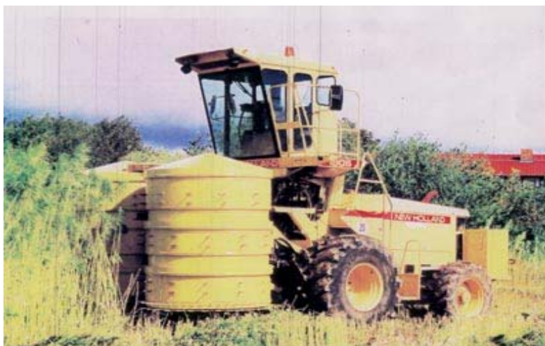
Figur 3. "Blucher 02-2." Denna hampskor demaskin ar byggd pa en New Holland 2205. I figuren ser man de vertikala trummorna med knivar i flera nivauer. Hyttens arbetshojd kan stallas in fran tva till tre meter over marken, allt for att foraren ska ha god uppsikt. (Kranemann Gartenbaumaschine GmbH, 2004)

Blucher-skordaren ar tillverkad pa ett tyskt foretag som heter Kraneman Gartenbaumachinen GmbH. Detta foretag tillverkar aven specialmaskiner for bl.a. skord av vegetabilier och frukt. Blucher-maskinen (se figur 3) har tva vertikala cylindrar (trummor) med knivar i flera nivauer. Dessa knivar kapar stjalken i stande position i ca 40-60 cm langa bitar som laggs i strangar. Eftersom det vid denna skor demetod produceras hoga och luftiga strangar ar villkoren for att rotning och torkning goda. Maskinen kan ocksa koras i regn eller vid kapning av treiga grodor utan att materialet lindrar sig kring de roterande delarna (Nilsson, 2003). De delarna pa stjalken dar frona sitter placeras overst pa strangen, pa sa satt underlattas skord av frona. Kraftbehovet for hela maskinen ar totalt 140 kW, for skordeaggregatet ar det 70 kW. Arbetsbredden ar 3,3 m. Framkorningshastighet ar 4-12 km/h och skordekapaciteten ar 1-3 ha/timme (Kranemann Gartenbaumaschine GmbH, 2004).