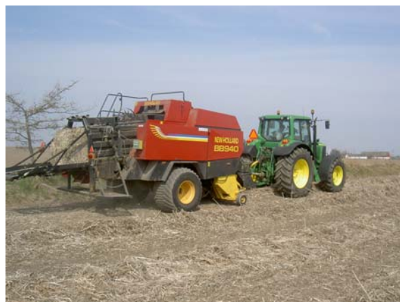
Figur 8. Fyrkantpressen, en New Holland BB 940, gjorde balar av storleken 90x80x150 cm

Thomas hade sparat en remsa vid ena sidan av fältet så att jag kunde se hur det sett ut innan strängläggningen och hur det gick till när han ringvältade och strängade. Storbalspressen var också på plats, en New Holland BB 940 (se figur 8). Snittaggregat finns på denna modell av press, men det användes inte. Storleken på balarna blev 80 x 90 x 150 cm och vikten ca 150 kg/bal. Att balarna var så lätta beror på den höga ts-halten (90 %).