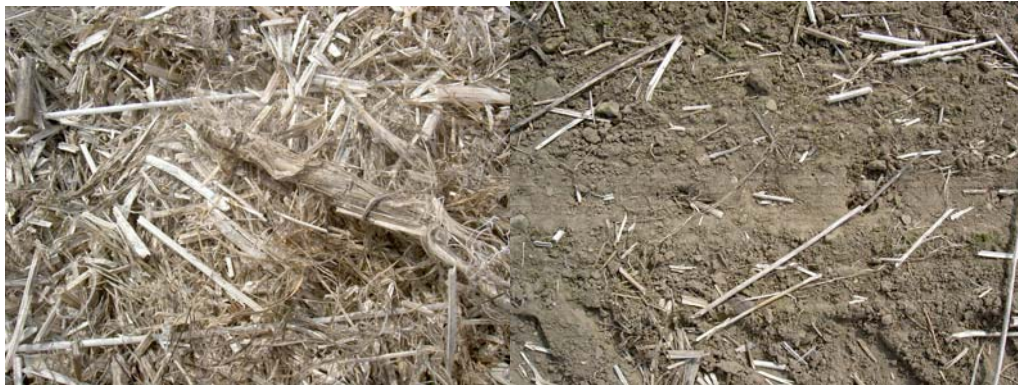
Figur 9. T.v. I mitten av fotot syns en bit av en rot. T.h. Hål i marken efter rötterna, som drogs med upp.

Efter att bara ha pressat två balar blev det stopp i maskinen, med ca en timmes arbete för att få loss den packade hampan. Stoppet kan nog ha berott på att pressen var lite rostig och ”trög”. Resterande hampa gick bra att pressa (med undantag för ytterligare ett stopp). Pickupen (helt vanlig pickup) på pressen plockade upp förvånansvärt rent särskilt med tanke på att den stränglagda hampan låg direkt på marken och inte på stubb som annars är brukligt, detta på grund att rötterna drogs med upp vid strängläggningen (se figur 9).