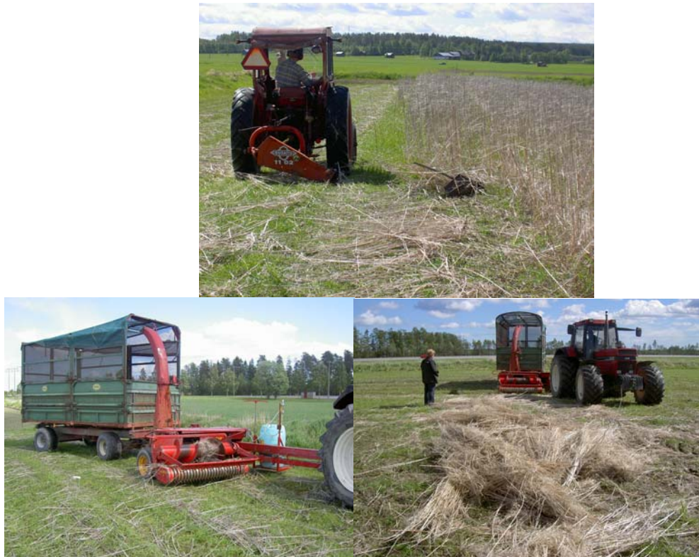
Figur 10. Dessa foton kommer från Röbbäcksdalen där man odlar den korta oljehampan Finola. Överst: Fällning med dubbelkniv. Underst: Hackning med Taarup exakthack