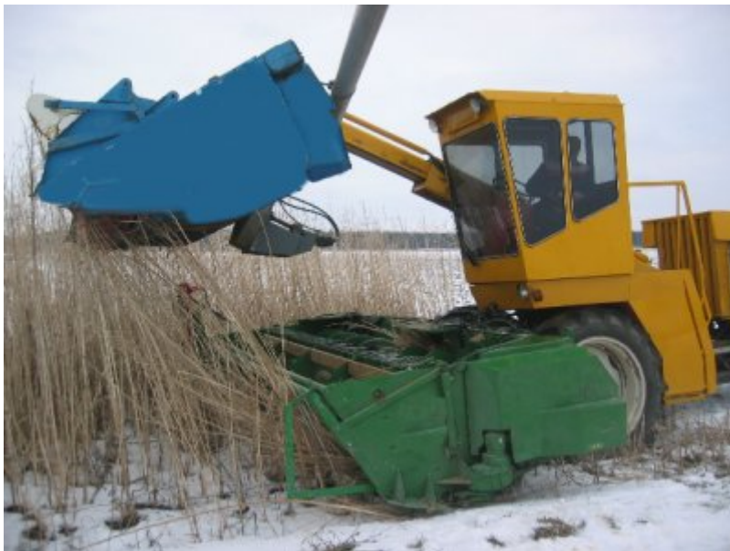
Figur 5. Här är Big H ute på provkörning i fält. Som synes är detta på vintern och det finns därför inga frö att skörda. Lägg märke till det undre bordet som är Champions bord för helsädesensilering.