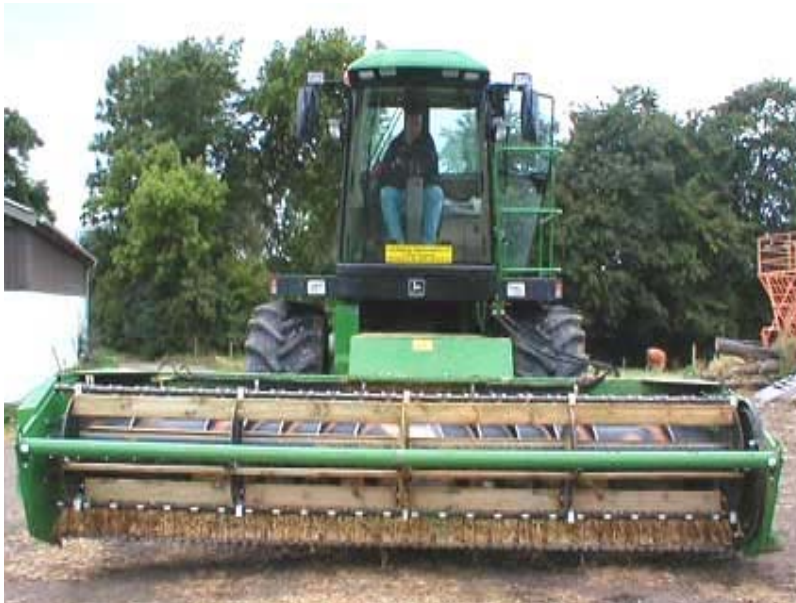
Figur 2. Champions bord för helsädesensivering monterat på en självgående exakthack med förbom, bräddförsedd haspel, dubbelkniv och inmatningsskruv.

I figur 2 ser man en horisontell bom en bit framför skärbordet (syns även i figur 4). Funktionen för denna är att den trycker fram stjälkens övre del så att rotändan kommer först in till knivarna. Man kan även se en haspel med bräddor påskruvade, bakom haspeln finns en inmatningsskruv.