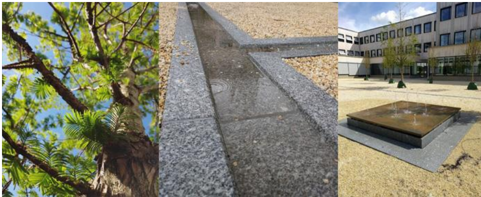
Figur 2. Från vänster: sekvoja med sitt speciella lövverk som skapar en exotisk känsla, dagvattenkanal i granit som bidrar med tydlig struktur och geometriskt formspråk, samt fontänen i koppar med sitt porlande vatten.

Den som träder in på innergården, kommer in i en miljö som är radikalt an-norlunda från de andra innergårdarna och utemiljöerna på campus. Där flera av de andra gårdarna har ett överflöd av växter så har Ulls hus innergård endast en trädart, kinesisk sekvoja Metasequoia glyptostroboides . Sekvojan är ett lövfäl-lande barrträd med distinkt uppsprucken stam, en skir krona, upprätt växtsätt och rakt genomgående stam. Det finns tjugotre träd av arten på innergården, i fyra olika storlekar. Detta ger illusionen av ett bestånd av träd i olika åldrar - nästan som om de frösått sig. Storleksskillnaderna ger variationen, istället för olika habi-tus, färg och detaljer. Träden står som utropstecken på marken som enda höjd-element över midjehöjd, och avsaknaden av undervegetation lyfter kontrasten ännu mer. Det finns inte mycket vandrande skugga från träden, utan de solbelysta