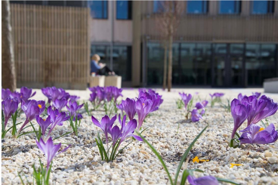
Figur 3. Tidig vårbloom av krokus på Ulls hus innergård. Bilden visar det karaktäristiska uttrycket med krokusarna och gruset, samt att gården är attraktiv och används redan tidigt på våren.

element och att krokusarna blommade tidigt på våren när behovet av vårtecken är stort. Krokusarnas blast vissnar sedan ner utan att skräpa allt för mycket och försvinner i gruset till nästa år. Färgen på krokusarna valdes för att den tidiga snökrokusen är lila. Att de senare krokusarna fått samma färg förlänger blomningen och ger ett enhetligt uttryck.